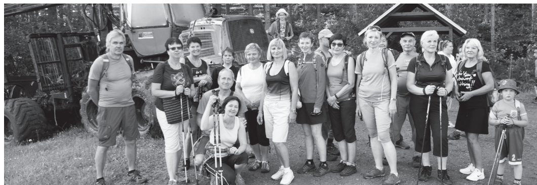
Srpnové počasí lákalo letos turisty i do míst blízko svých domovů. Boskovický Klub českých turistů se vypravil minulou sobotu na Olešnicko a rovněž proběhl již 16. ročník Pochodu po stopách pátera Ševčíka.