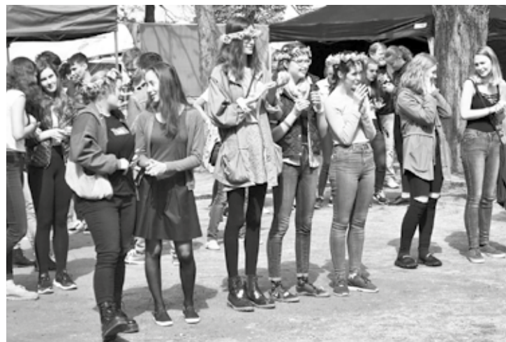
Studenti v Boskovicích oslavili tradiční Majáles.