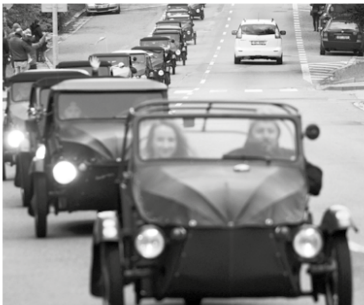
Společná jízda městem zakončila v neděli 5. května 22. Jarní sraz velorexů v Boskovicích. Tématem srazu bylo tentokrát U nás na Lontu neboli U nás na vesnici a pořadatelé zaregistrovali 134 strojů s posádkami.

dra Ščudla, který v letošní sezóně doplácí na věkový hendikep a plave s o rok staršími plavci, okusil atmosféru velkých závodů a především premiérově zvládl závody v padesátimetrovém bazénu. Ani ostřílené závodnice a nejstarší z pětky Natálie Horáková a Emma Ryšávková se v nabitých startovních listinách neztratily a zaplavaly svá osobní maxima. Lubomír Slezák, foto archiv