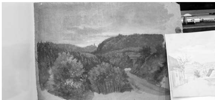
Wankelův obraz zachycující lesy v okolí Blanska.

„K vidění na výstavě je i unikátní milostný osobní Wankelův deník, nazvaný Ephemeriden, který si psal dnes těžko přeložitelným kurentem, a který muzeum letos připravuje k publikaci,“ doplnil s úsměvem Kostrhun. Výstava potrvá až do konce tohoto roku. (lín)