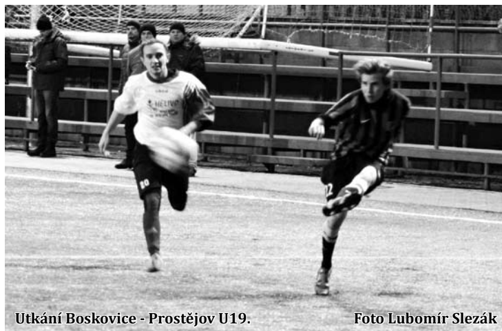
Utkání Boskovic - Prostějov U19.