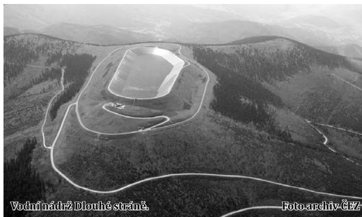
Vodní nádrž Dlouhé stráně.

Nádrž tohoto vodeního díla je umístěna v nadmožské výšce 1350 metrů nad mořem a bezesporu jde o jednu z turisticky nejnavštěvovanějších elektráren ve střední Evropě. Ročně si její areál prohlédne zhruba 80 tisíc zvědavců. Od nádrže lze pozorovat i nejvyšší moravskou horu - Praděd. V útrobach zařízení jsou hned dvě velká soustrojí TG. První z nich zrekonstruuvala ČKD Blansko Engineering již v minulosti a nyní získala zakázku i na TG2. Firma je známým výrobcem vodeních elektráren, které dodává do celého světa.