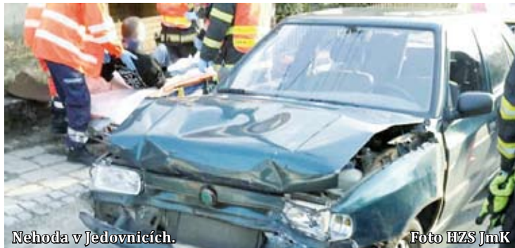
Nehoda v Jedovnicích.

Nehoda se stala krátce po deváté hodině dopoledne. Řidič auta nezvládl zatáčku, vyjel mimo vozovku a zajel do řeky. Příčinu nehody určí další vyšetřování. „Vůz byl pravou přední částí v řece Svitavě mezi obcemi Doubravice nad Svitavou a Lhota Rapotina. Na místě ošetřila záchranná služba tři zraněné a poté je převezla do nemocnice,“ popsal mluvčí jihomoravských hasičů Jan Dvořák s tím, že auto z řeky zpět na silnici vytáhli pomocí navijáku. Michal Záboj, Radim Hruška