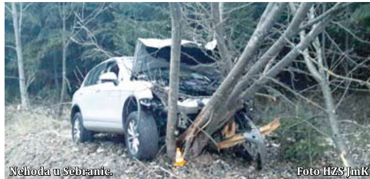
Nehoda u Sebranic.