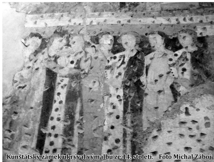
Kunštátský zámek ukrýval výmalbu ze 14. století.

Historie nynějšího kunštátského zámku se datuje do poloviny třináctého století. Rod pánů z Kunštátu, jehož nejznámějším příslušníkem byl někdejší český král Jiří z Kunštátu a Poděbrad, držel rodové