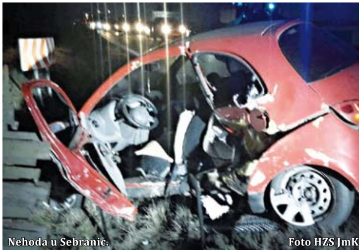
Nehoda u Sebranic.