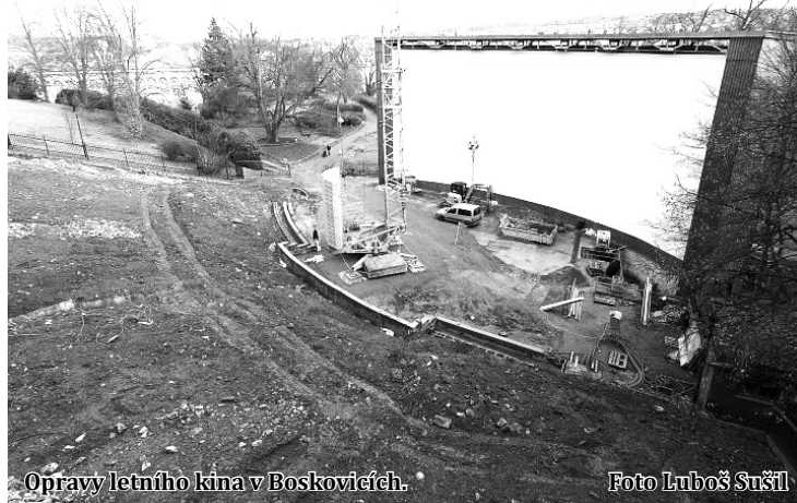
Opravy letního kina v Boskovicích.

V minulosti už město v amfiteátru rekonstruovalo pódium pod plát-