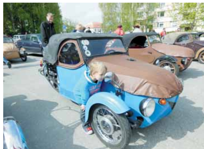
Tradice. První květnový víkend obsadili Boskovice a okolí milovníci třístopých vozítek. Uskutečnil se totiž další ročník sjezdu velorexů. * Čerstvé zboží. Také v Boskovicích už mají lidé možnost navštívit farmářské trhy. Konají se na Masarykově náměstí. Rozpis trhu naleznete na www.boskovice.cz.