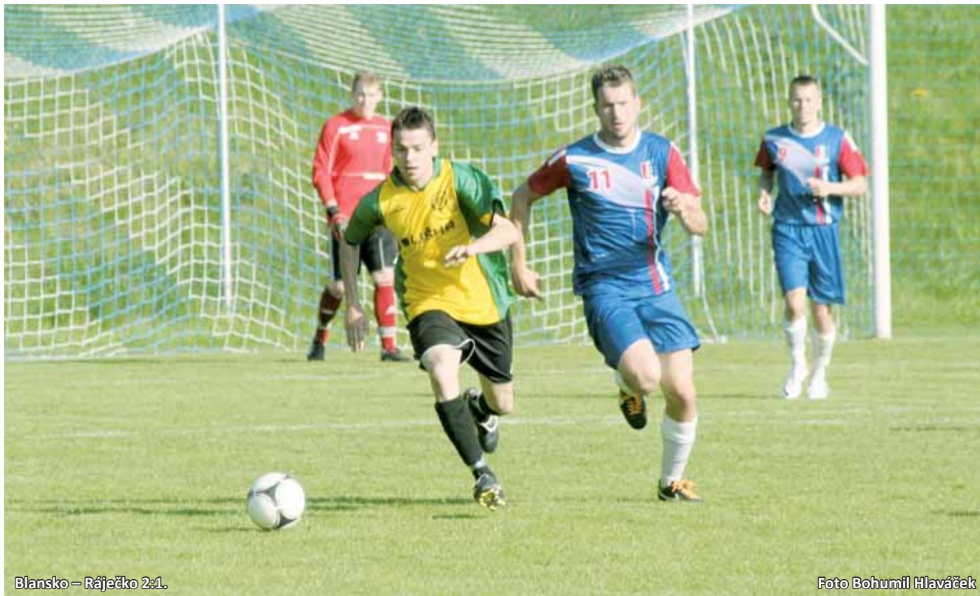
Blansko - Ráječko 2:1.

V Ráječku na těžkém terénu gól nepadl. Domácí sice měli více ze hry, Bosonohy ale špatný dojem