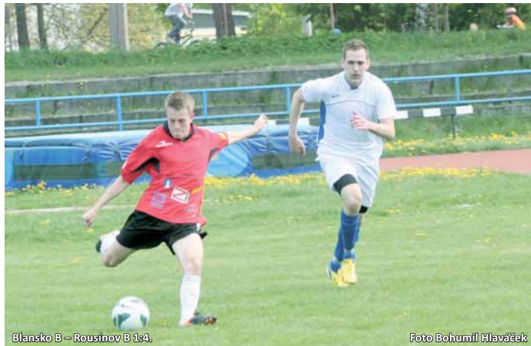
Blansko B – Rousínov B 1:1.