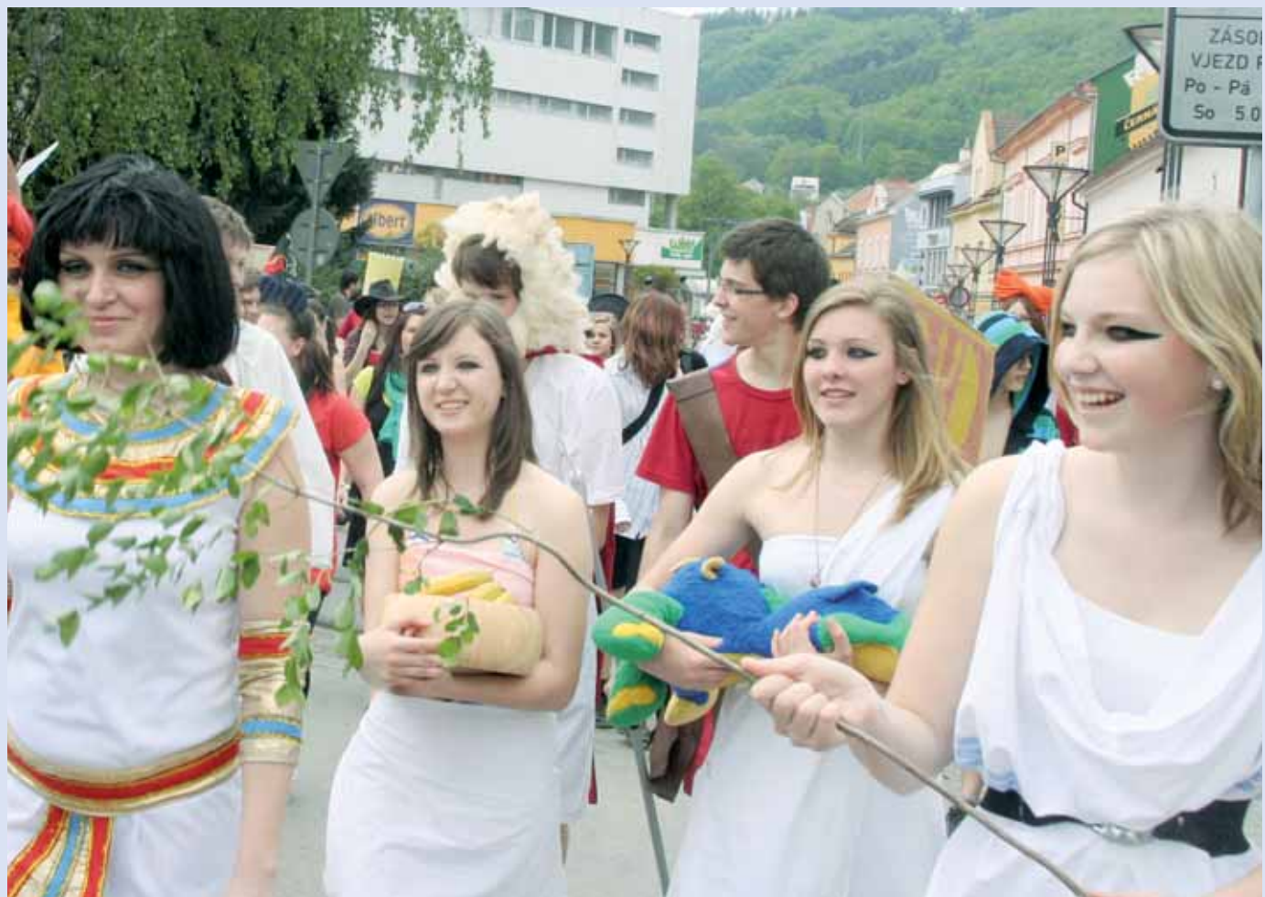
Studentská recese. I letos se vydali do ulic studenti a žáci blanenských škol v rámci Majálesu 2013. Průvod vyrazil od OA a SZdš a svoji pouť ukončil v prostorách zámekového parku. Fotoreportáž na straně 12.