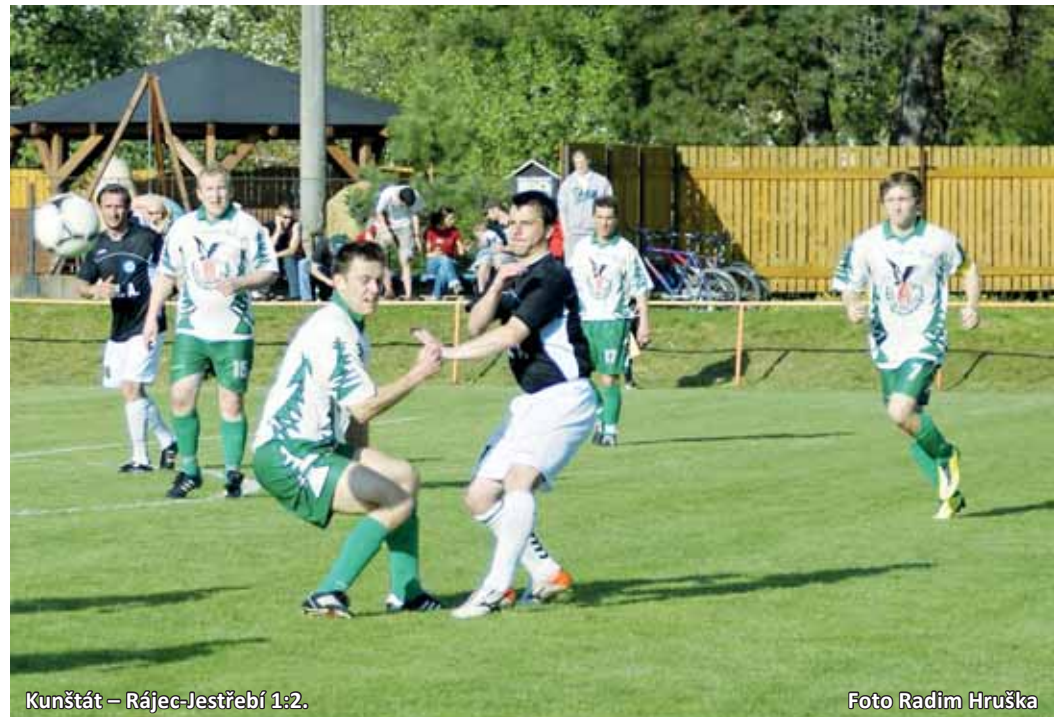
Kunštát – Rájec-Jestřebí 1:2.

Hrušovany – Rájec-Jestřebí 1:1 (0:1) , Palkaninec. Rájec-Jestřebí: Polák – Vágner, Hejč, Klimeš, Kučera – Palkaninec (80. Hepp), Šmerda, Sedlák, Skácel