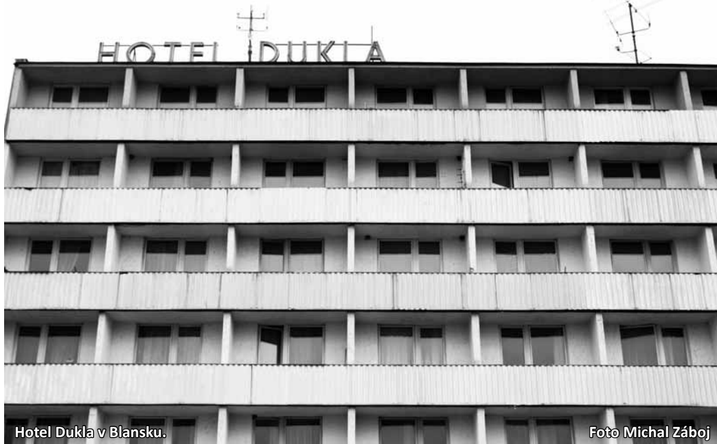
Hotel Dukla v Blansku.