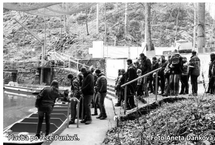
Plavba po řece Punkevě.

„Oficiálně by se měla hala otevřít 1. září, ale jestli tomu tak