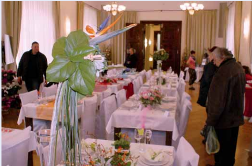
Svatby. V pátek a sobotu si mohli návštěvníci křtinského zámku v rámci svatebního miniveletrhu prohlédnout nejen ukázky svatebních tabulí, ale také práce šikovných cukrářů, květinářů, kosmetičky, kadeřnice nebo fotografa. Více fotografií na www.zrcadlo.net .