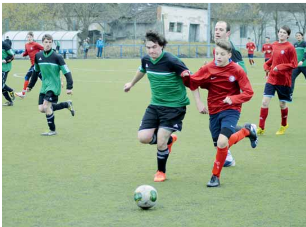
Utkání dorostenců Boskovic a Víseck.

Ve 26. minutě skončilo utkání nešťastně pro obránce Buchtu. Po vzdušném souboji upadl na pravou ruku, kterou si zranil,