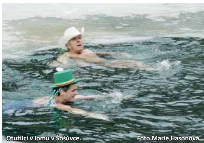
Otuzilci v lomu v Šošůvce.

V neděli 1. března se zatopený lom v Šošůvce změnil v zimní koupaliště. Sjeli se totiž otuzilci z blízka i z dále, aby divákům ukázali, jak se to dělá. Pořadatelé ovšem museli den předtím vysekat díru do ledu.