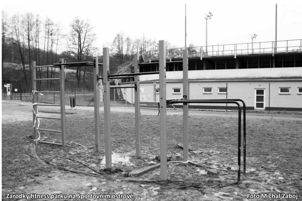
Zárodky fitness parku na Sportovním ostrově.

Park by měl sloužit všem věkovým kategoriím od dětí a mládeže až po seniory. „Pohyb v tomto místě je velký. Jsme přesvědčeni, že bude park využíván. Byli bychom rádi, aby se do projektu zapojila i TJ Olympia, která by na svém stadionu mohla poskytovat