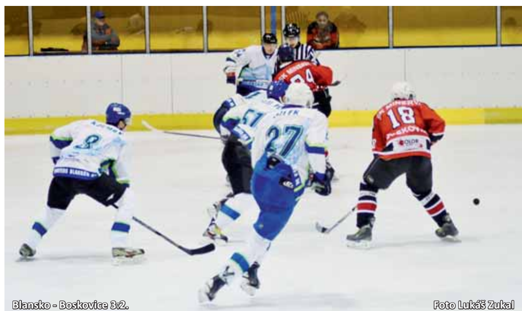
Blansko - Boskovice 3:2.