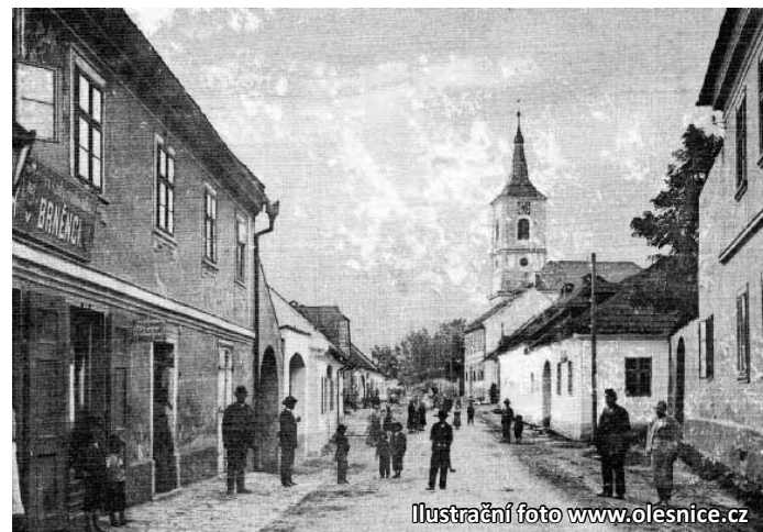
Ilustrační foto www.olesnice.cz

„Pro řadu lidí, kteří se zabývají historií nebo si pamatují vyprávění svých předků, bude kniha možností si dění před sto lety oživit. Při přípravě mně velmi pomohla veřejnost, především olešnická, to ale neznamená, že bude knížka zaměřena jen na úze-