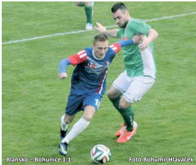
Blansko – Bohunice 1:1.

Další výsledky: Rosice – Tasovice 3:0. Líšeň – Bystrc 1:2. Napajedla – Hodonín 2:2.