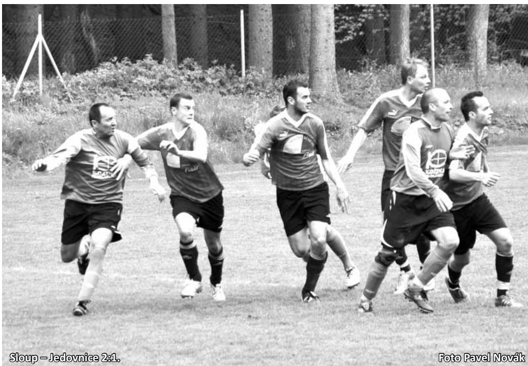
Sloup - Jedovnice 2:1.

Zápas rozhodla hrubá chyba kompletní vavřinecké defenzivy ve 13. minutě. Utkání mělo jinak vcelku vyrovnaný průběh.