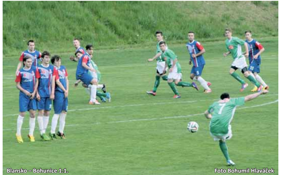
Blansko – Bohunice 1:1.