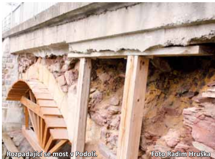
Rozpadající se most v Podolí.

Podolí - Neutěšený stav mostu v místní části Letovic – Podolí už nějakou dobu komplikuje život řidičům. V místě je doprava svedena do jednoho jízdního pruhu a přes most směrem na Vísky od dubna vůbec neprojedou těžká nákladní auta. Ta se musí vydat na objíždnou trasu směrem na Letovice, Kladoruby a Drválovice. A právě tady nastává problém. V lesním úseku mezi Kladoruby