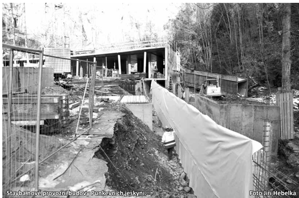
Stavba nové provozní budovy Punkevních jeskyní.

Nastanou ale další komplikace. Kvůli pokládce inženýrských sítí bude od poloviny března rozkopaná a uzavřená cesta od Skalního mlýna. Turisté se tak už tudy nedostanou k Punkevním jeskyním vláčkem ani pěšky.