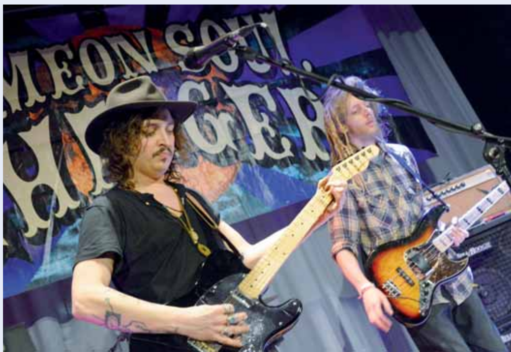
Koncert. Boskovický zámecký skleník zažil v sobotu kousek pozitivně naladěného Woodstocku v podobě koncertu americké rockové kapely Simeon Soul Charger.