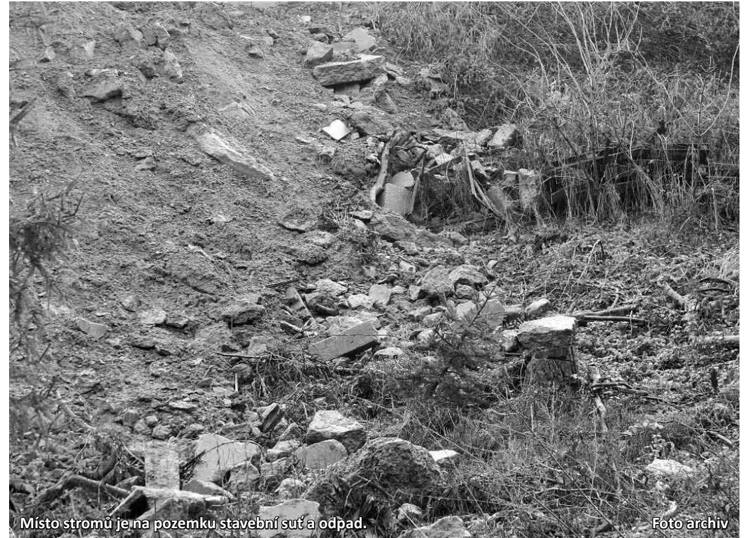
Místo stromů je na pozemku stavební suť a odpad.

„Odbor životního prostředí naopak nařídil, že pozemek musí