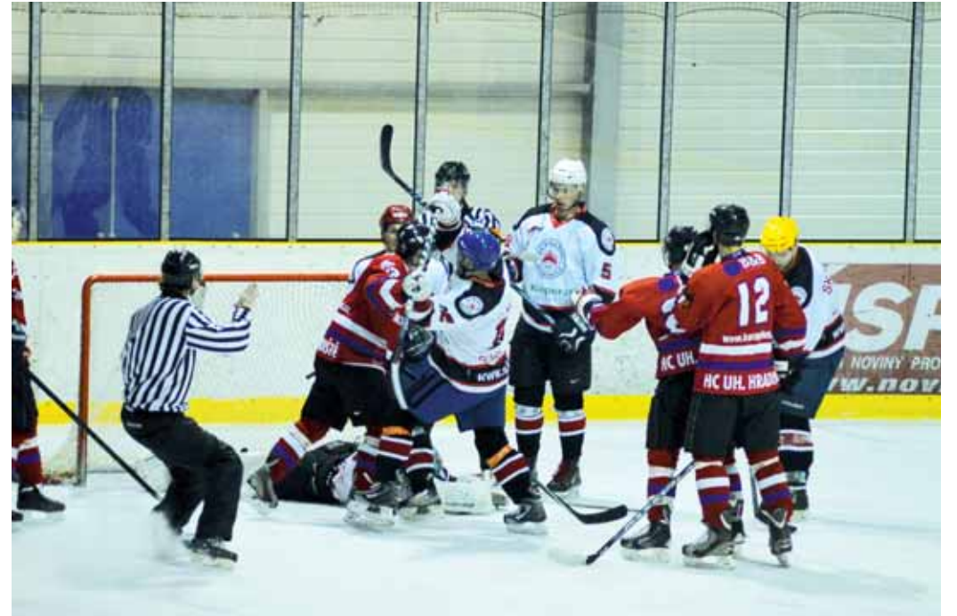
Závěr před brankou. I přes vysokou výhru Boskovic bylo na ledě rušno.