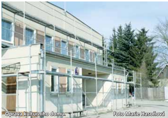
Oprava kulturního domu.

Opravy se dělají především z důvodu snížení energetic-