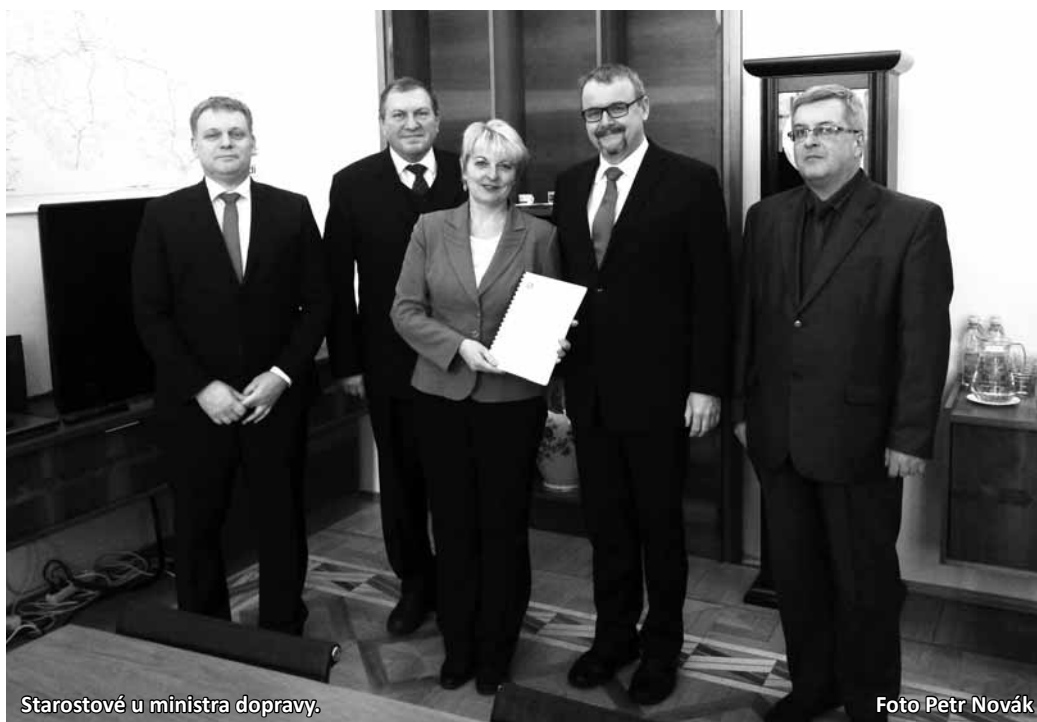
Starostové u ministra dopravy.

Turistický Pochoď po dálničním tělese R43 se koná pravidelně od roku 2010. Organizátoři tak chtějí uspišit stavbu rychlostní silnice, která by nahradila současnou komunikaci I/43 z Brna na sever.