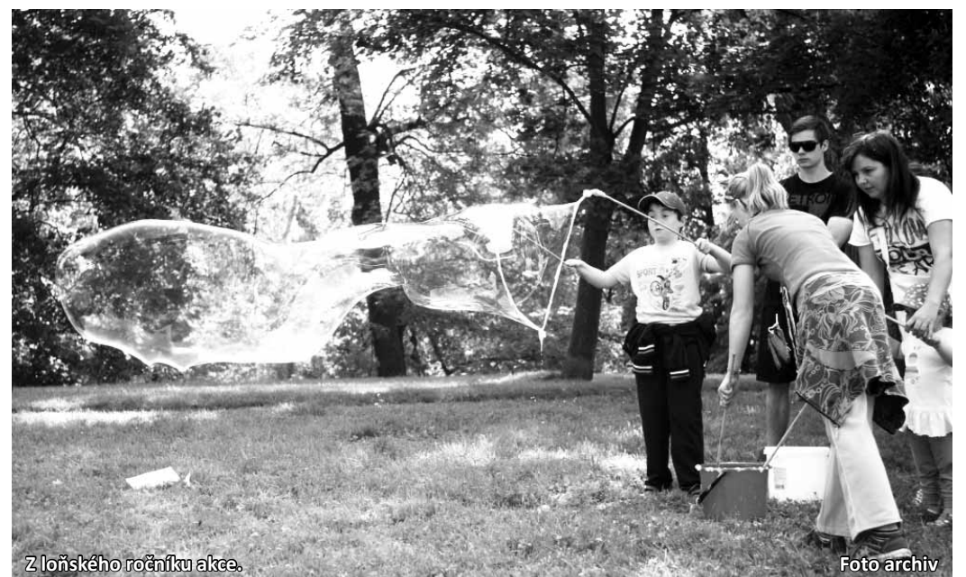
Z loňského ročníku akce.

Přes den tedy blanenský park opět zaplní stánky s aktivitami jednotlivých organizací pro děti a mládež, večer pak budou následovat koncerty i tradiční noční hra. Cílem BambifESTU je ukázat dětem, jaké mají ve svém