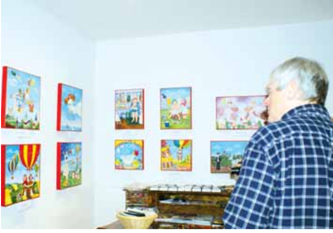
Výstava. Až do 27. dubna bude v letovecké galerii Domino k vidění výstava obrazů s jarní tematikou Mirky Strejčkové a dětí z letovecké mateřské školy v Komenského ulici.