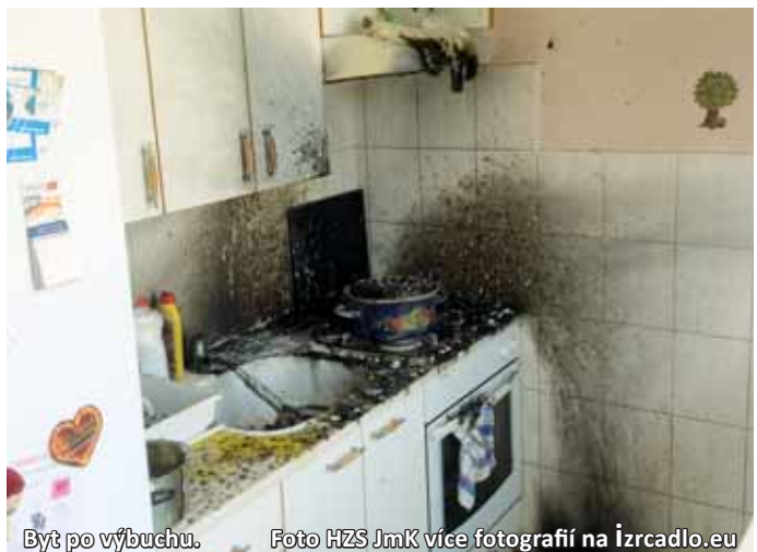
Byt po výbuchu. Foto HZS JmK více fotografií na izrcadlo.eu

Výbuch se v panelovém domě ve Dvorské ulici těsně