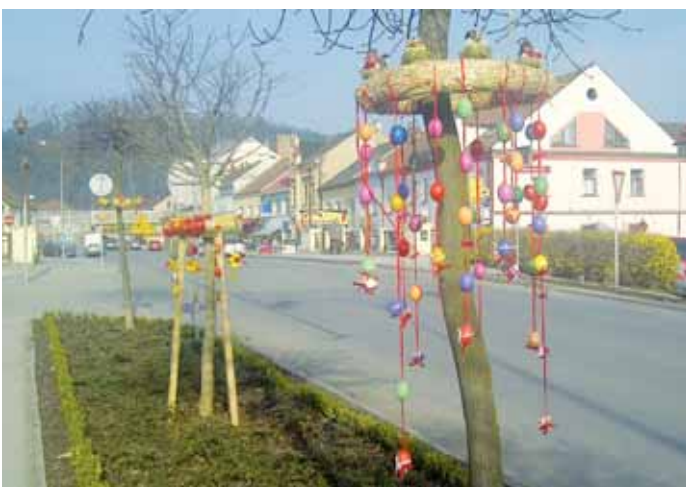
Výzdoba. Letovické Masarykovo náměstí dostalo novou velikonoční výzdobu. Postaraly se o ni děti z tamní školní družiny.