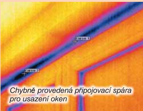
Chybně provedená přípojovací spára pro usazení oken

využití týká zejména při aplikaci dodatečných zateplovacích systémů, zateplení střech či stropů, při výměně oken a dveří. V případě tepelných ztrát se na termosnímku vybarví kritické místo, které představuje tepelný únik výrazněji barvou než místa s dobrou tepelnou izolací. Jednoznačně se tedy projeví například chybné usazení kotev zateplovacích systémů, nedostatečná izolace podhledů skrytá pod palubkovým obkladem nebo sádkokartonem, chybně