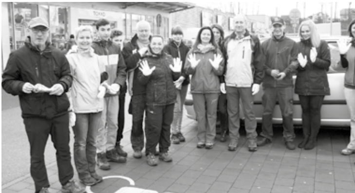
Letošní akce Uklidme Česko! se v Boskovicích zúčastnil rekordní počet dobrovolníků, a to asi 225. V rámci sedmi oficiálních skupinek, které uklízely následující lokality: Bačov, Vratíkov, Hrádkov, Mladkov + břeh řeky Svitavy, Pilské údolí, Doubravy a oblast Otakara Kubina a Mánesova + prostor za nemocnicí se navíc do úklidu pustila i řada dalších dobrovolníků sama za sebe. Město Boskovice vybavilo dobrovolníky pytlí, drobným občerstvením a firma LANIK poskytla pracovní rukavice.