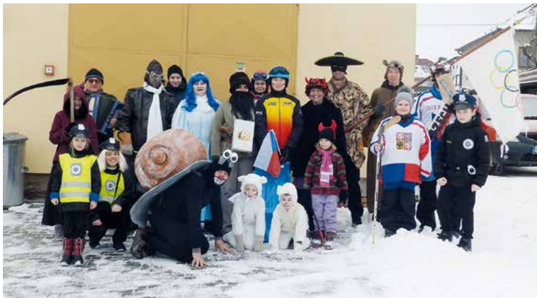
Maškary vyšly do ulic v sobotu desátého února také v Sulíkově.