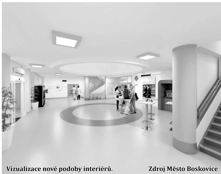
Vizualizace nové podoby interiéru.