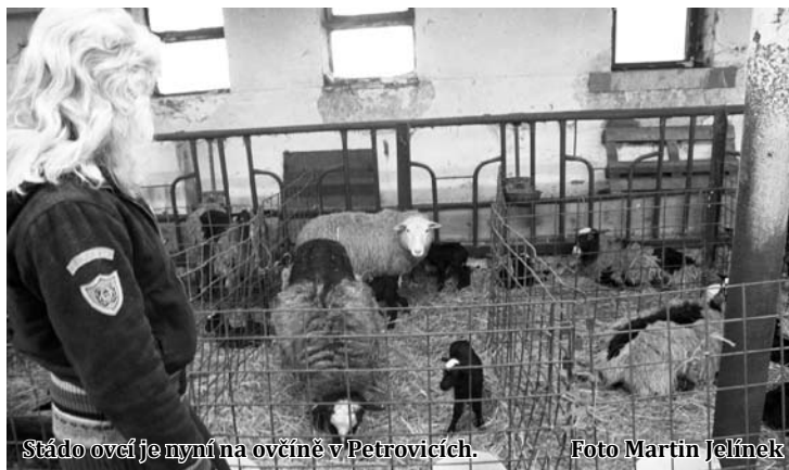
Stádo ovcí je nyní na ovčíně v Petrovicích.