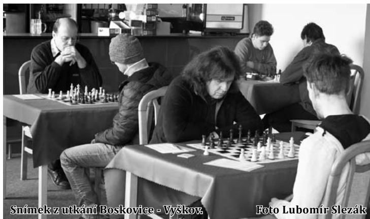
Snímek z utkání Boskovice - Vyškov