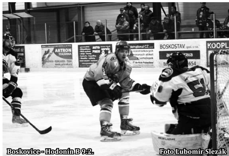
Boskovice - Hodonín B 9:2.

Pro Hodonín B znamená prohru konec nadějí v boji o play-off. Velká Bíteš doma porazila Rosice a pojistila si tak osmou příčku.