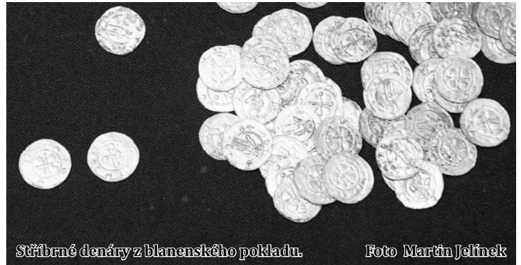
Stříbrné denáry z blanenského pokladu.

Možná šlo podle něj o platbu, kterou někdo dostal za své služby, pak se vydal do Brna, měl strach o své peníze, zakopal je někde u cesty a pak se pro ně už nevrátil, protože pravděpo-