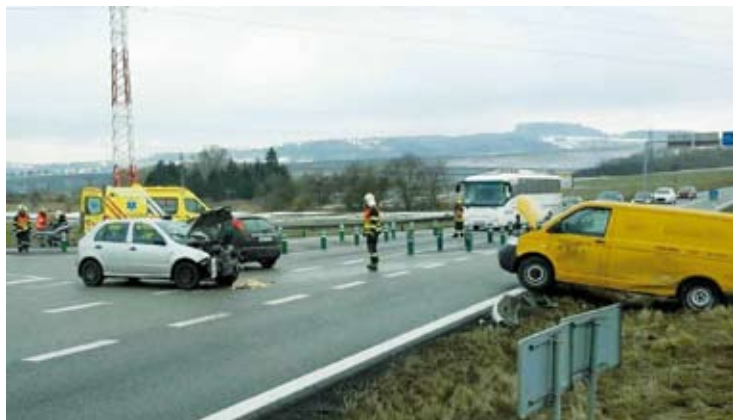
Křižovatka silnice I/43 a II/150 nedaleko Sebranic se v sobotu stala dějištěm další dopravní nehody. Tentokrát se na ní srazilo osobní auto s dodávkou. Výsledkem bylo zranění jedné osoby.