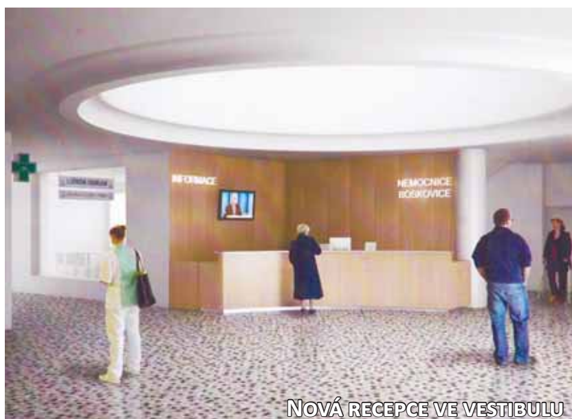
NOVÁ RECEPCE VE VESTIBULU

vy včetně výměny oken a dveří. Zateplen byl celý východní blok nemocnice a realizace bude pokračovat v letošním roce zateplením západního křídla. V roce 2011 rozšířila nemocnice spektrum operačních výkonů v oblasti cévní chirurgie. V následujících letech se předpokládá další rekonstrukce a restrukturalizace jednotlivých oddělení a ambulancí tak, aby nemocnice splňovala náročné požadavky, které jsou na zdravotnická zařízení kladena v 21. století.