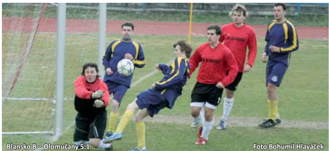
Blansko B – Olomučany 5:1.

Zápas se jevil vyrovnaně jen ze začátku. Skóre otevřel hlavou Beneš, zvýšil z penalty Pokorný. Po změně stran sice Klíma snížil, pak ale již měli hlavní slovo pouze domácí, kteří dalšími třemi góly rozhodli zápas zcela jasně ve svůj