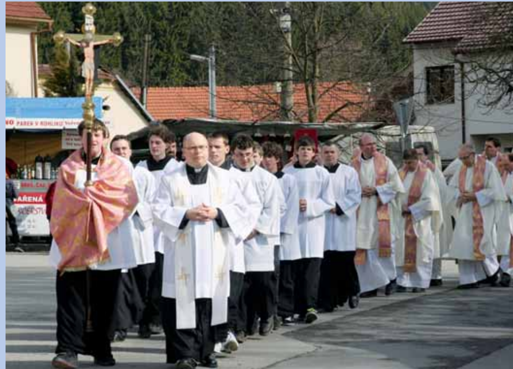
Pouť. Vždy týden před Velikonoce se na Květný pátek sejdou tisíce věřících, aby se pomodlili k Panně Marii Sedmibolestné ve Sloupu. Ani letošek nebyl výjimkou.