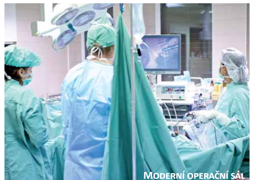
MODERNÍ OPERAČNÍ SÁL