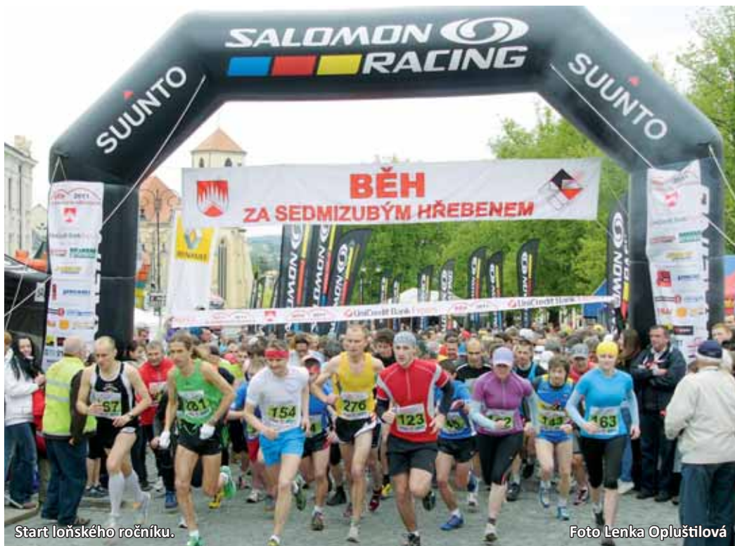
Start loňského ročníku.