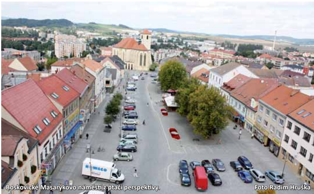
Boskovičské Masarykovo náměstí z ptáčích perspektivy.

Zaměříme se mimo jiné na čistotu chodníků. Obrovský problém máme s psími exkrementy. Mimo zájem nezůstane ani veřejná zeleň. Pokud uspějeme v dotačních programech, tak by letos mohlo dojít na úpravu oblasti sídliště v ulici Otakara Kubína. V plánu je také revitalizace aleje v ulici Svatopluka Čecha, která je v současné době asi nejzávažnější v Boskovicích a určitě si zaslouží pozornost. Město chceme také více otevřít lidem, konkrétně myslím městský