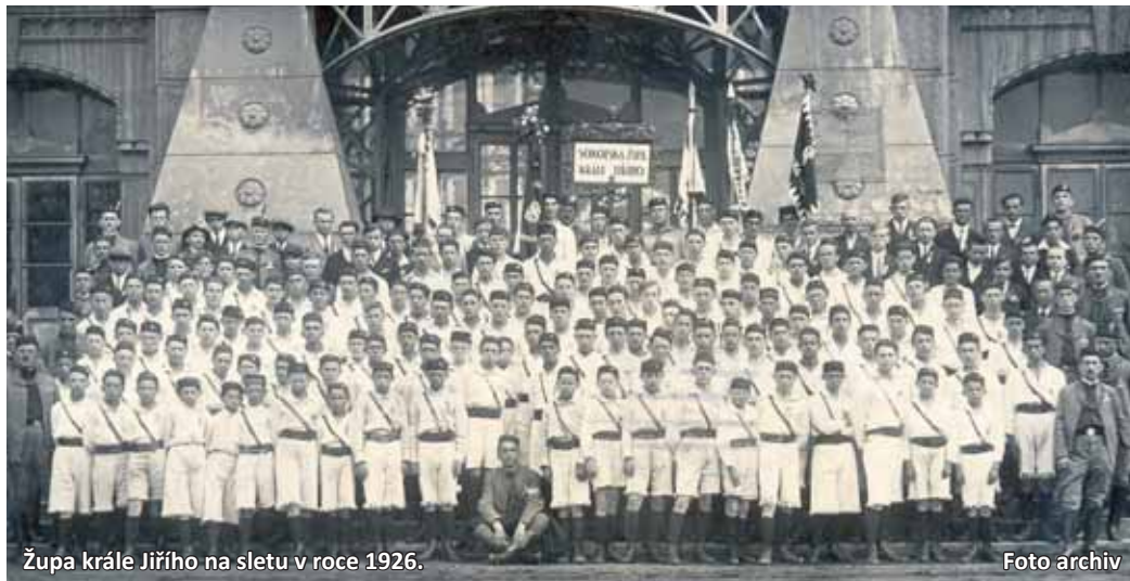
Župa krále Jiřího na sletu v roce 1926.

Nejtěžší období pro Sokol byly naopak obě totality, které postihly český národ. V druhé světové válce byl Sokol zakázán a zahynuly tisíce statečných členů. V roce 1945 byl Sokol obnoven a vzeplal se