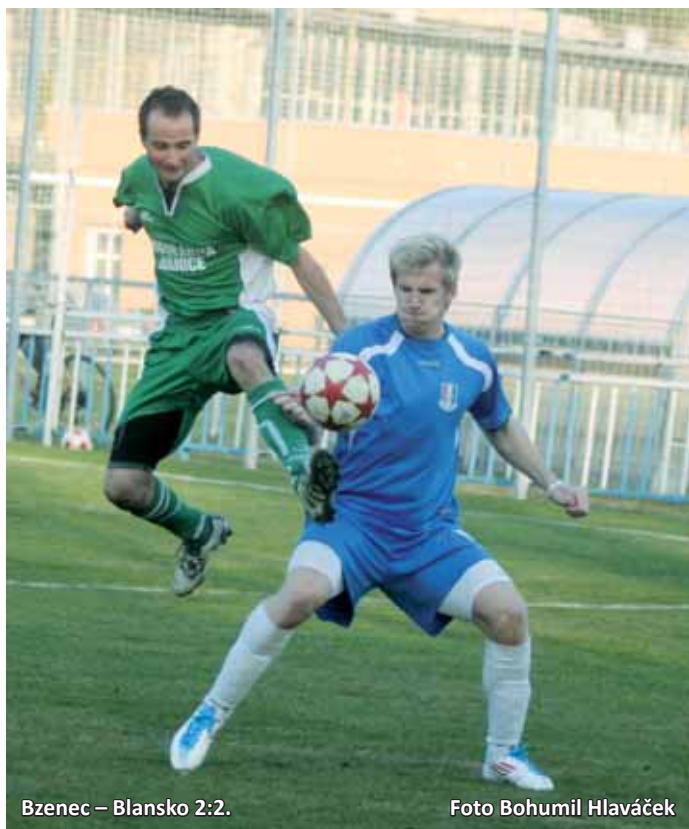
Bzenec – Blansko 2:2.

V půli se vítr otočil v neprospekch Blanenských, na jejich trvalém tlaku se ale nic nezměnilo. Střelec a asistent se v případě druhého gólového zásahu v 55. minutě tentokrát proměnili – nahrával Doležel a cílil Šenk. Brankový