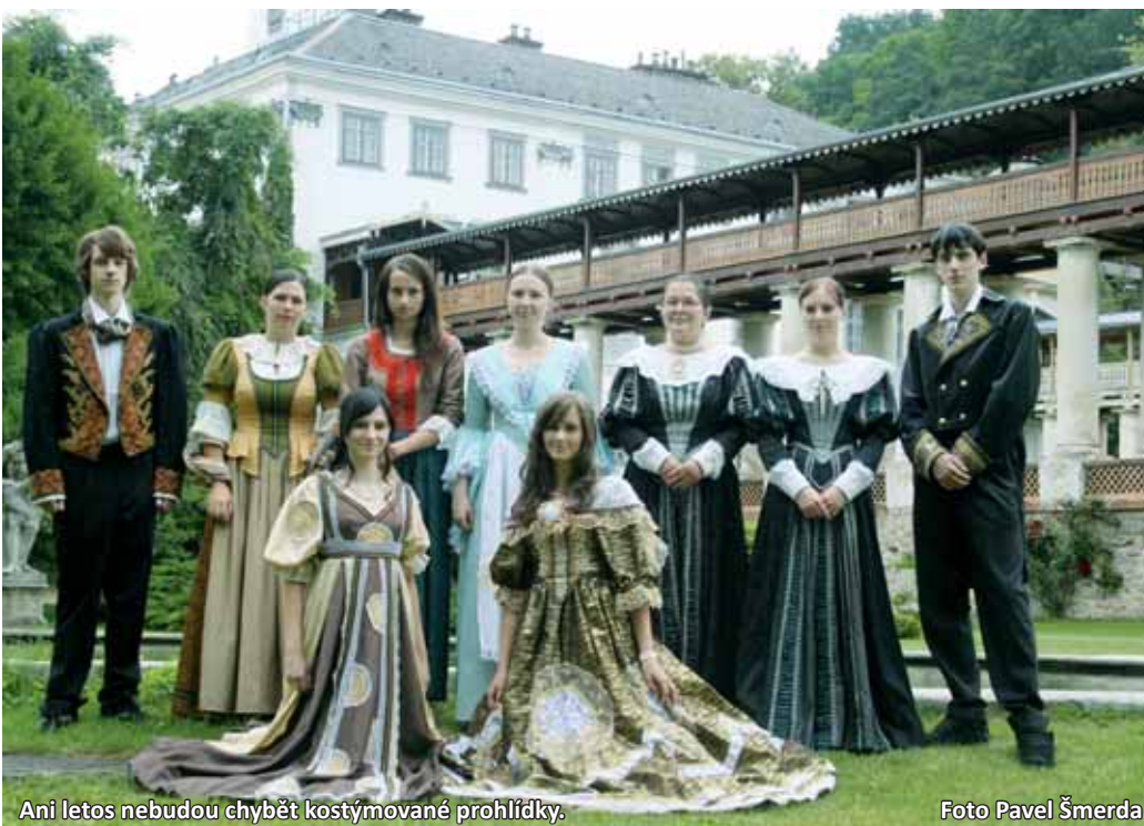
Ani letos nebudou chybět kostýmované prohlídky.

Co se týká investic, ke konci loňského roku byla díky mimořádně dotaci dokončena obnova dřevěné pergoly v zahradě zámku. „Plánovali jsme pokračování v obnově klasicistních sloupů kolonády. Bohužel prioritu musí dostat řešení nálezu dřevokazné houby v severním křídle hlavní zámecké budovy. Sanace těchto prostor bude náročná nejen finančně, ale