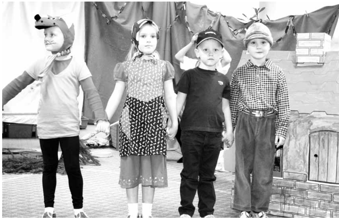
Vzdělávací zařízení. Velký zájem o školky je téměř všude. V některých městech a obcích se tedy rozhodli svoje zařízení rozšířit.

Nová třída školky funguje na místě bývalé družiny. „Tu jsme přesunuli jinam. Vybudovali jsme kompletně nové sociální zařízení, jinak větší zásahy nebyly nutné, protože prostory byly naprosto vyhovující. Pouze