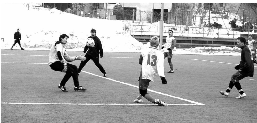
Výhra domácích. Ve vzájemném duelu porazilo béčko Boskovic blanenskou juniorku.

Zápas začal velmi ospale, oba týmy se probraly až po dvaceti minutách hry. Nebezpečnější byla Líšeň. Belej nejprve mířil vedle, pak se musel proti Vrtěnovi vytáhnout bravurním zákrokem Trubák. Jediné nebezpečí pro domácí branku znamenaly standardní situace Farnika, jedna z jeho střel ze hry skončila těsně vedle. V závěru půle hasil nebezpečí na brankové čáře Janíček.