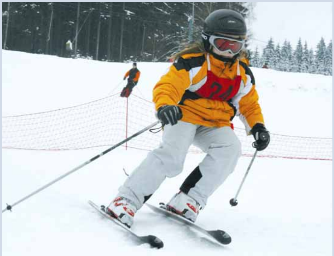
Lyžování. Rekordních dvaasedmdesát lyžařů ve čtyřech kategoriích se postavilo na start 1. ročníku závodu v obřím slalomu, který se konal v sobotu v lyžařském areálu v Hodoníně u Kunštátu. Výsledky na str. 10.