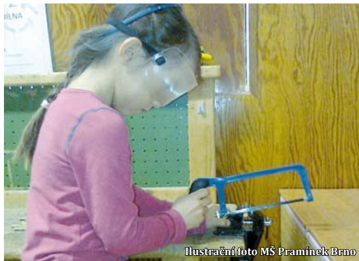
Ilustrační foto MŠ Prámínek Brno

Kromě odborných kurzů pro pedagogy se pořádá též série přednášek a diskuzí. V minulosti se debatovalo například o Hejného metodě, v nejbližší době se chystá setkání s ředitelkou ZŠ