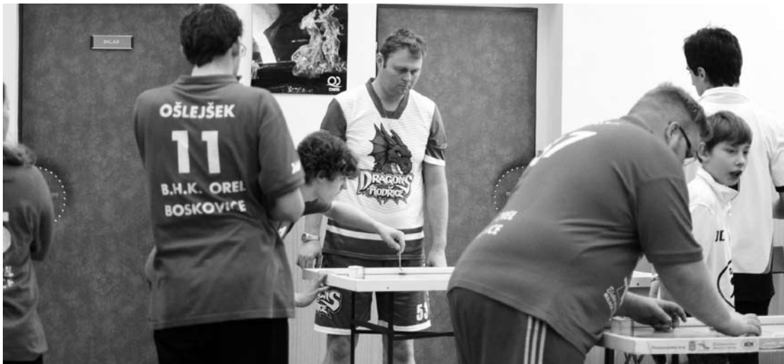
V boskovické Orlovně byl v sobotu rozehrán letošní ročník první ligy ve šprtci. Domácí Orel Boskovice hostil týmy BHC Dragons Modřice a Gunners Břeclav. S Modřicemi Orel prohrál 7:13, Břeclav porazil 13:4.

Pořadatelem turnaje jsou Služby Boskovice, s.r.o., partnerem Pivovar Černá Hora, ceny obdrží první 3 družstva. Hrací doba je 2x45 minut, je povoleno střídát libovolný počet hráčů. Lubomír Slezák