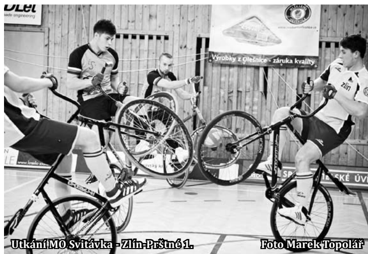
Utkaní MO Svitávka - Zlín-Pršténé 1

Výsledky: Sokol Zlín-Pršténé 1 - Sokol Zlín-Pršténé 2 6:1, MO Svitávka - SC Svitávka 11:0, Přerov-Zlín - Favorit Brno 1:2, Zlín-Pršténé 1 - Sokol Šitbořice 4:1, Zlín-Pršténé 2 - MO Svitávka 3:8, SC Svitávka - Přerov-Zlín 2:3, Brno - Šitbořice 3:4, Zlín-Pršténé 1 - MO Svitávka 1:2, Zlín-Pršténé 2 - Přerov-Zlín 1:6, SC Svitávka - Šitbořice 3:3, Zlín-