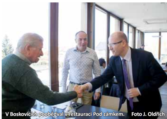
V Boskovicích poobědval v restauraci Pod zámekem.

Bohuslav Sobotka na návštěvě Blanska také uvedl, že chce urychlit stavbu rychlostní silnice R 43. Projekt, který je zařazen mezi strategické cíle vlády, tak čeká revize. Kvůli tomu se mají v nejbližší době sejít zástupci vlády, Ředitelství silnic a dálnic a Jihoomoravského kraje. „Abychom se podívali se na to, v jakém stavu je příprava stavby, jaké jsou hlavní překážky, aby tady bylo jasné zadání pro státní správu, na co by se měla soustředit, abychom s výstavbou R 43 pohnuli,“ podotkl Sobotka.