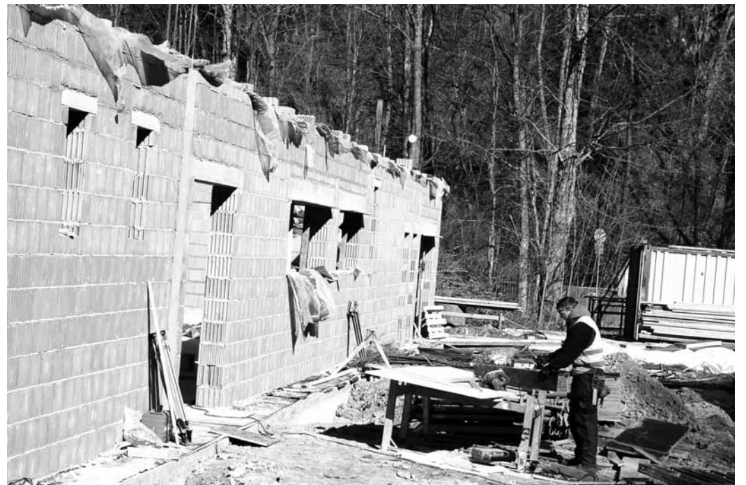
Stavenišťe. Už v květnu příštího roku by měli mít návštěvníci Moravského krasu možnost navštívit nový Dům přírody. Stavba roste, expozice se připravují.

Projekt je spolufinancován Evropskou unií – Evropským fondem pro regionální rozvoj a státním fondem životního prostředí ČR v rámci operačního programu Životní prostředí. Dotace z EU představuje 85 procent z celkových 84 milionů korun, pěti procenty přispěl Státní fond životního prostředí a deseti procenty ministerstvo životního prostředí. U Skalního mlýna vzniká klasické návštěvnické středisko s vnitřní i vnější expozicí, s programem pro návštěvníky jeskyní, s možností programů pro školy a podobně.