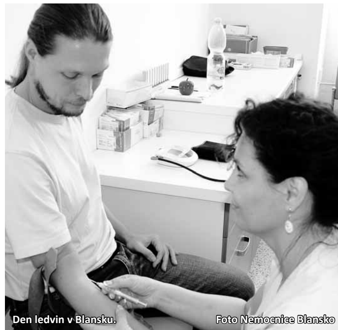
Den ledvin v Blansku.

Třiačtyřicet lidí navíc doporučili sledování praktickým léka-