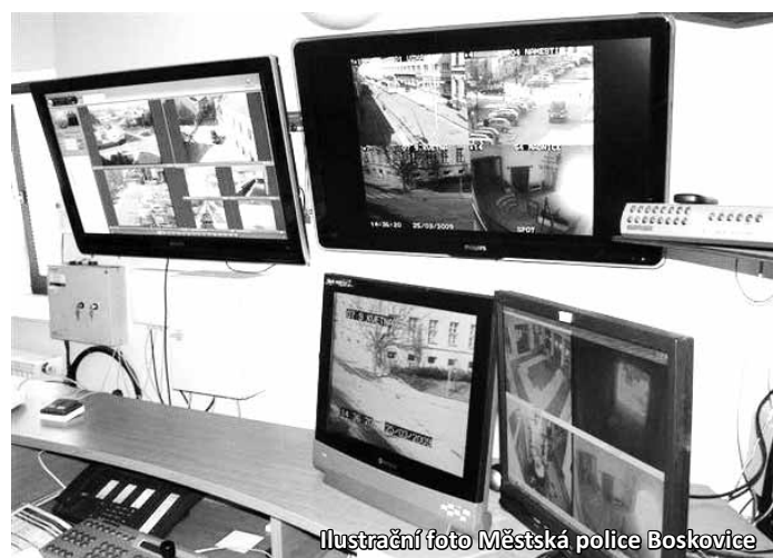
Ilustrační foto Městská policie Boskovice

Pořízení nových kamer město přijde na více než půl miliónu korun. V současnosti už má Městská policie Boskovice k dispozici jedenáct venkovních a tři vnitřní kamery v budovách úřadu.