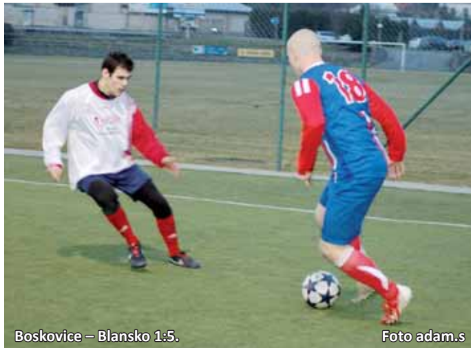
Boskovice – Blansko 1:5.