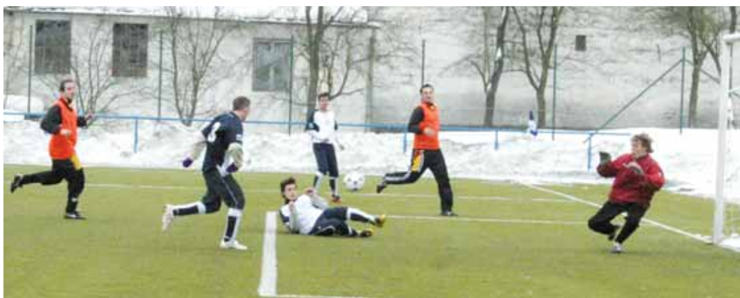
Chyba. Obrana Lipoveckých (v oranžovém) se zapoměla a kunštátská útočná vozba střílí pohodlně první branku utkání.

Boskovice - Svitavy 4:0 (1:0) , Janíček, Koudelka, Preč, Vorlický. Boskovice: Gruber - Doležel, Martinek, Horák Jak., Přikryl - Horák Jan, Preč, Váněk - Vorlický, Janíček.