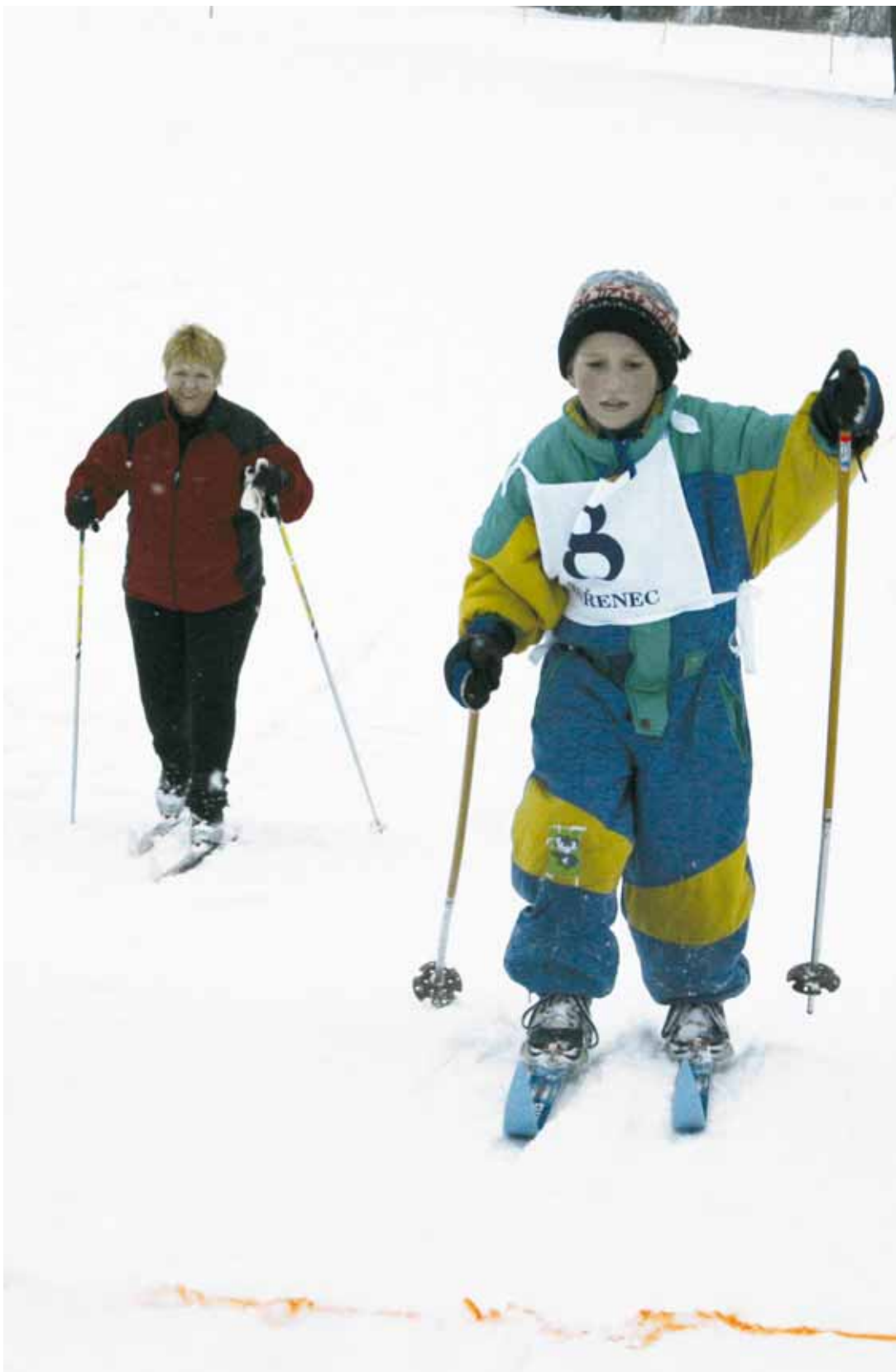
Kořenecká lyže. Atmosféru opravdových závodů v běžeckém lyžování si v Kořenci někteří sportovci vyzkoušeli vůbec poprvé. Startovalo i sedm dětí mladších deseti let.