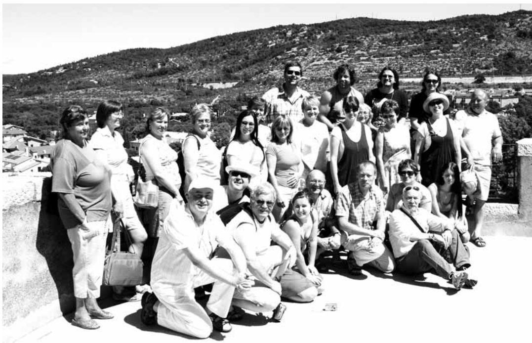
Kantila. Smíšený sbor slaví letos čtyřicet let své existence.