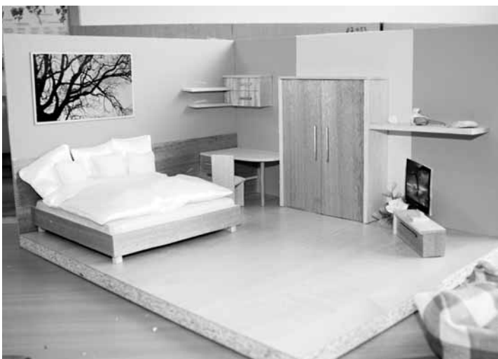
Zmenšený svět. V rámci projektového vyučování vytvářeli nábytkáři návrhy zařízení interiérů.

„Ukazujeme studentům, čím se jednou budou žít, a na druhou stranu firmám, že vyrůstá nová generace schopných pracovníků. Organizačně se na akci podílela doslova celá škola. Na programu byly prezentace firem, přednášky, ale také módní přehlídka, projektové vyučování nebo stavební veletrh. Naši studenti mimo jiné připravili soutěže pro žáky základních škol,