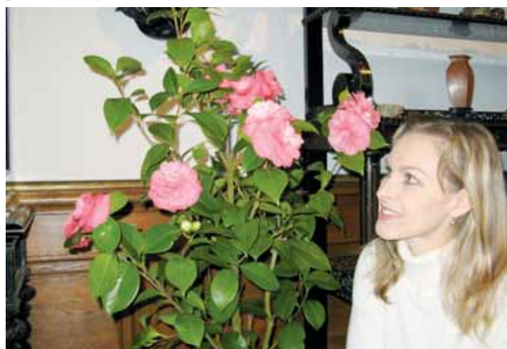
Krásna květin. Také v letošním roce ozdobi kamélie komnaty Státního zámku Rájec nad Svitavou.

Tehdy byl výzkumný úkol ukončen a nevědělo se, co s materiálem, který tam byl soustředěn. Byla škoda ho zlikvidovat, tak padla volba převést ho na jižní Moravu, kde byla