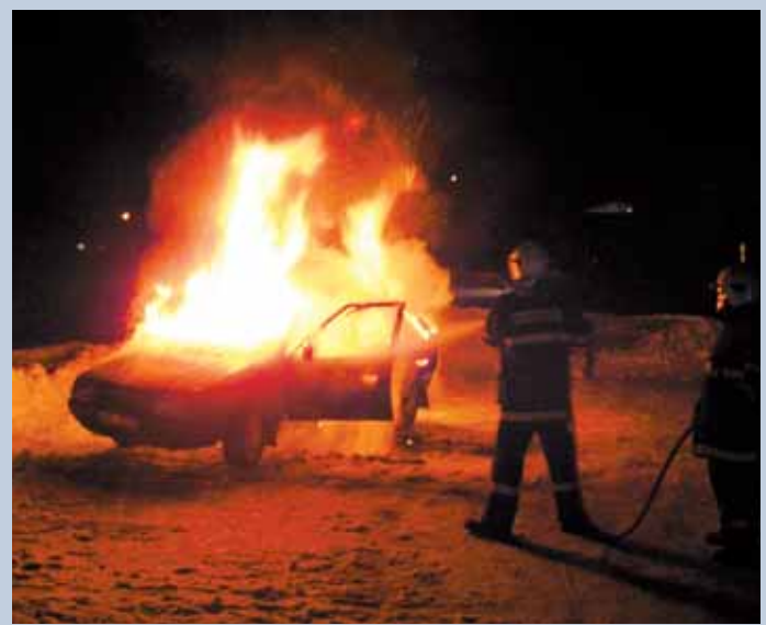
Plameny. Blanenský hasiči likvidovali minulý týden v pondělí ve večerních hodinách požár osobního auta na parkovišti u obchodního domu Billa v Blansku. Jak oheň vznikl, je stále v šetření. (př)