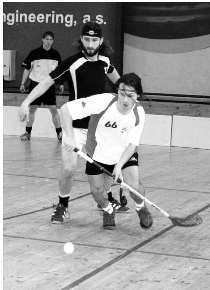
Domácí turnaj. Na domácí palubovce hrálo běčko Atlasu svůj turnaj jihomoravské ligy. (výsledky na str. 10)