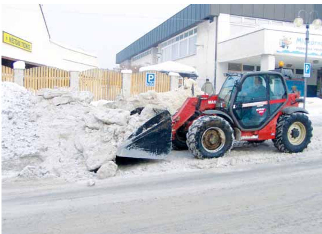
Úklid. Sněhové masy musela z olešnických ulic a náměstí odvážet technika.

Sníh nepůsobí komplikace jen na silnicích, trápí také lidi pohybující se po chodnicích. „To, co jen málokdo po schválení změny zákona o odpovědnosti za škody způsobené neudržováním chodníků a místních komunikací očekával, se stalo skutečností. Hned první zima je tak bohatá na sníh, že jeho úklid způsobuje