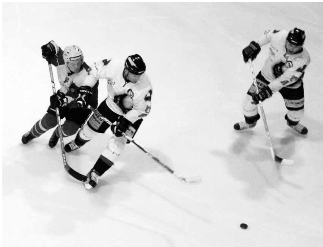
Nevydařený týden. Blanenští hokejisté po středeční vysoké prohře v Hodoníně nedokázali na domácím ledě dát Vsetínu ani jeden gól.

lejší a důraznější v osobních soubojích. Blansko vážila kombinace, nedařila se nátlaková hra a také střelba byla velmi slabá. Ve 14. minutě překvapila Jirkůva střela z úhlu a Vsetínští se radovali. Přesilovka Blanska vyšla bez efektu.