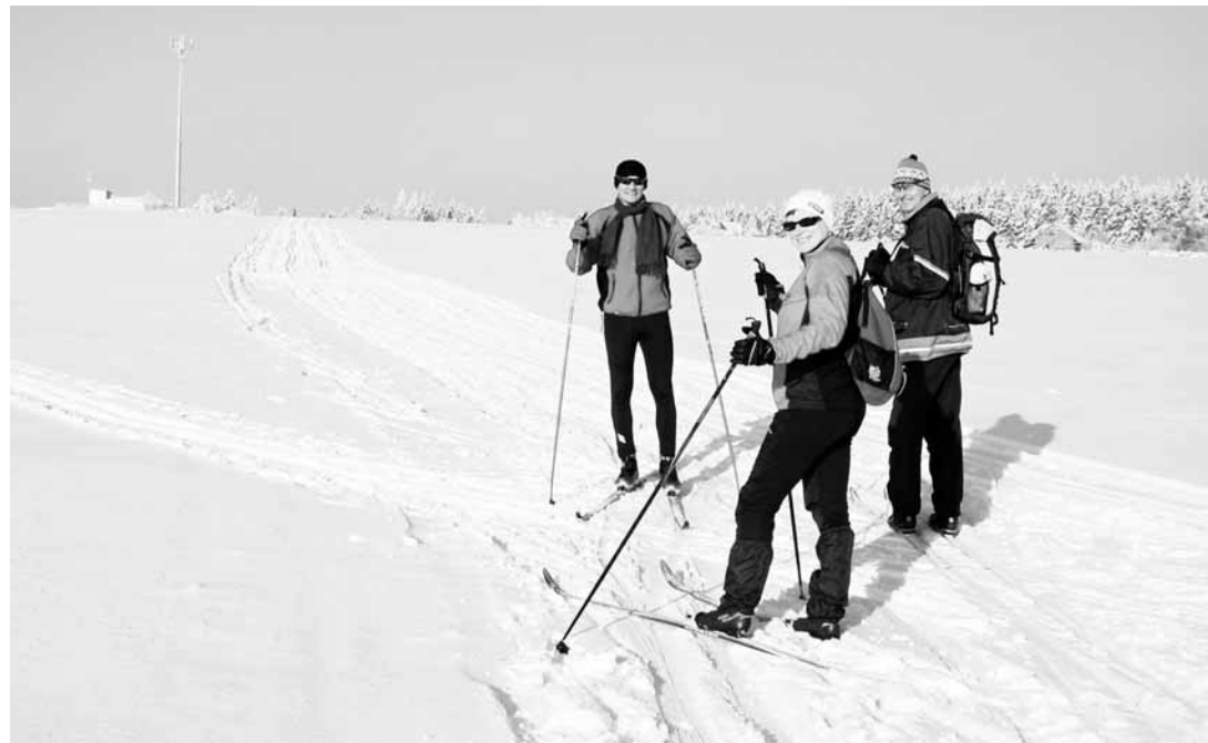
Na běžkách. Jedna z lyžařských tras vede také v okolí Protivanovského mlýna.

Za lyžováním do okolí Suchého se vydávají nadšenci z blízkého okolí i ze vzdálených měst. A obec je na ně dobře připravena. K odstavení aut slouží parkoviště v kempu, které nabízí až sto dvacet míst k stání. Nejvytýčenější jsou páteční odpoledne a víkendy. O perfektní stav tras se starají dva skútry, které