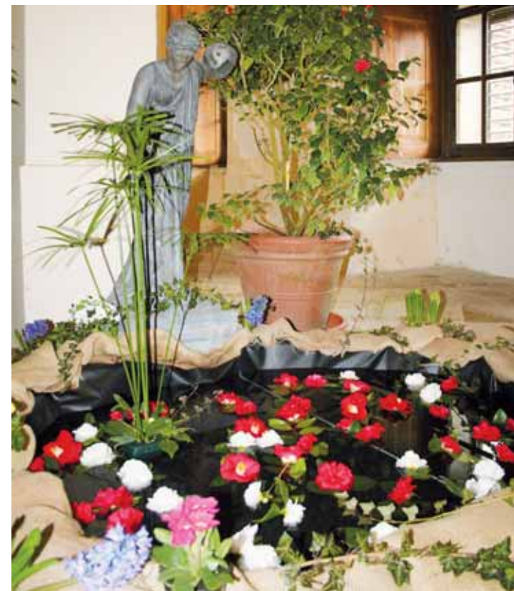
Výstava. Kamélie si v rájeckém zámku můžete prohlédnout od 27. února do 7. března.

U nás končí výstava v neděli 7. března a už o den později začneme kamélii převážet do Rajhradu, ve středu je tam na programu vernisáž a od čtvrtka 11. do neděle 14. března bude výstava otevřena pro veřejnost. Je to pro nás velice náročné, ale jsme limitováni dobou květu kamélií, takže doufáme, že to všechno vyjde.