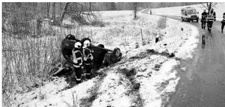
V neděli vyjízděli hasiči k dopravní nehodě u Jedovnic směrem na Křtiny. Osobní auto tam skončilo na střeše mimo vozovku. Nehoda se obešla bez zranění. Hasiči provedli protipožární opatření a řídili kyvadlově provoz.