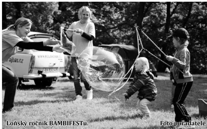
Loňský ročník BAMBIFESTu.

V loňském roce se představilo jednatřicet volnočasových organizací pro děti a mládež, přišlo přes 2 600 návštěvníků, zahrálo dvacet hudebníků, osm kapel a představilo se šest přednášejících v rámci konference. (hrr)