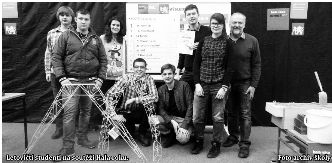
Letovičtí studenti na soutěži Hala roku.