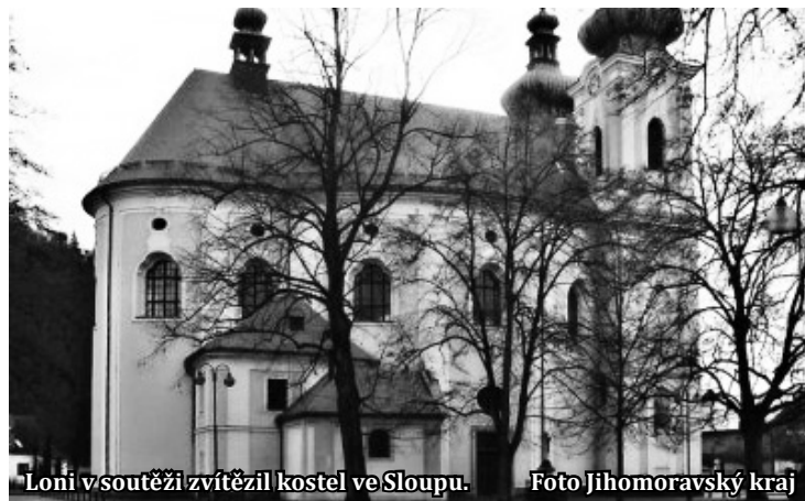
Loni v soutěži zvítězil kostel ve Sloupu.

„V rámci desátého ročníku jsme se rozhodli finanční částkou 25 tisíc korun a titulem Rytíř péče o památky v Jihomoravském kraji ocenit až tři osobnosti Jihomoravského kraje, které vykazují hluboký a trvalý zájem, vytrvalost a obětavost ve vztahu k péči o památky,“ dodal radní Soukal.