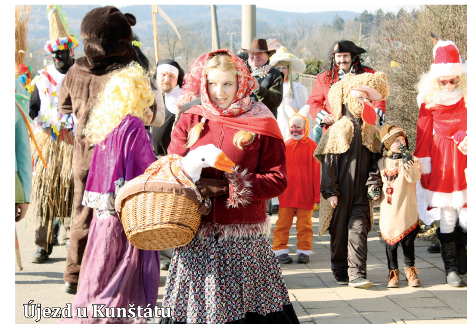
Újezd u Kunštátu