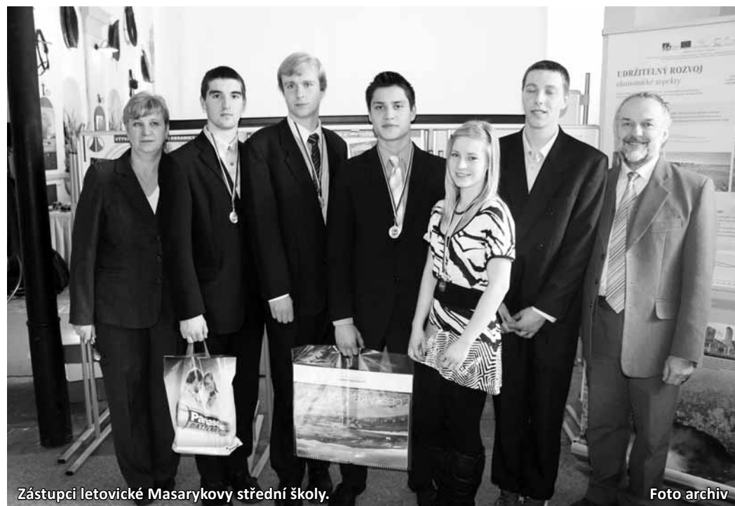
Zástupci letovické Masarykovy střední školy.

„Připravili jsme práci o hlubinném vrtu tepelného čerpadla na Skalním mlýně v Moravském krasu. Práce byla rozdělena na několik částí, v jedné jsme přiblížili tepelná čerpadla, jak fungují a jejich rozdělení. Především jsme se ale zabývali tím, jak je těžké po formální stránce dojít ke schválení vrtu v chráněné krajinné oblasti. Měli jsme zjištěné jed-