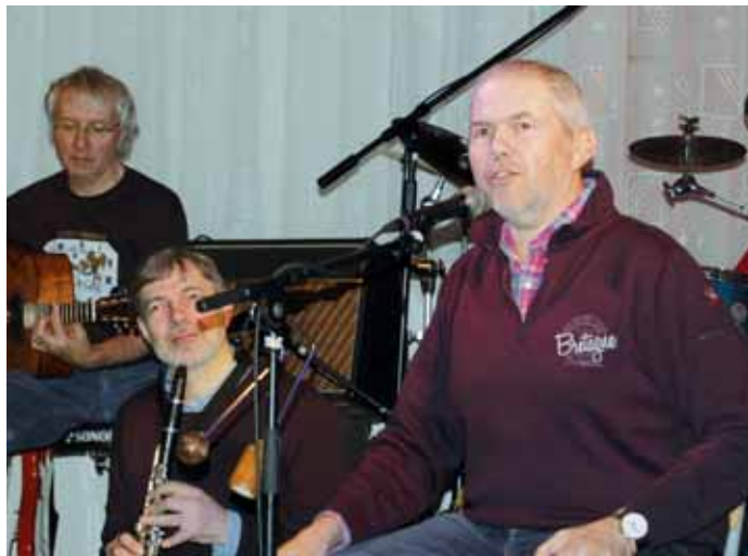
Chlebičky. Marek Eben se svými bratry a ostatními vynikajícími muzikanty své kapely připravili adamovskému publiku nezapomenutelný zážitek.

oblíbené dětské knížky Medvídek Pú. Myslím si, že toto je velmi dobrá akce. Děti jsou dnes víc připoutané k počítačům, než ke knížkám. Možná to tak bude, že budou číst knihy v elektronické podobě, ale pokud se dá ještě něco z klasických knížek zachránit, tak je to docela dobře. Protože přece jen - knížka je knížka. Má svůj půvab, svůj design, svou grafickou hodnotu a formát. Na té čteče to všechno vypadá velmi podobně. Cítil jsem se mezi dětmi velmi dobře.