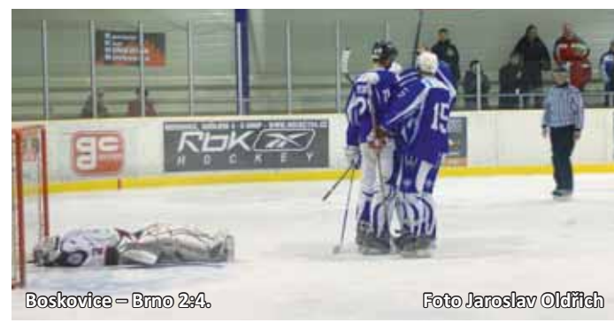
Boskovice – Brno 2:4.

Ve třetí dvacetiminutovce chtěli hosté rozhodnout, Brno ale neložilo zbraně a jejich snaha byla korunována srovnáním, o které se postaral z brejku Hakl. Plichta vydržela do konce, začalo prodloužení. Pokračování na str. 10