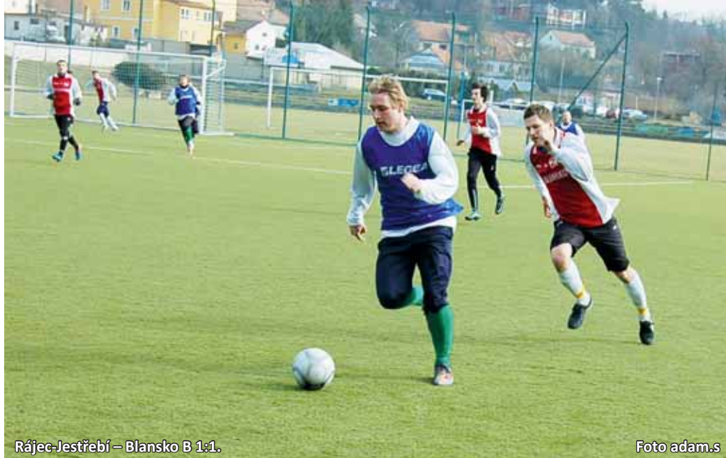
Rájec-Jestřebí – Blansko B 1:1.