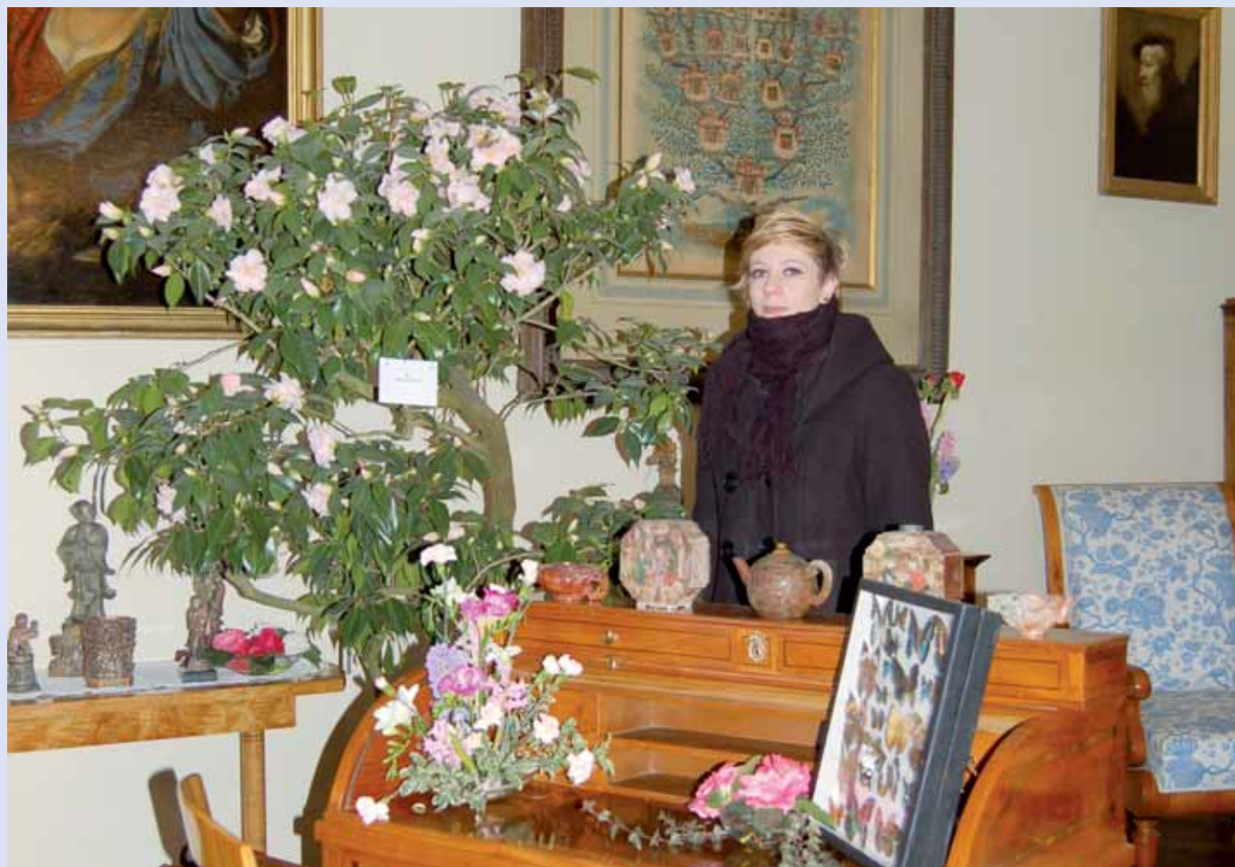
Jubilejní výstava. První předzvěstí jara je letos už podvacáté výstava kamélií v Rájeckém zámku. Ta letošní je tedy už dvacátá a nabízí průřez tematickými expozicemi, které návštěvníci měli možnost vidět v minulých letech. Camelia Jubilaea bude na Rájeckém zámku otevřena až do 10. března.