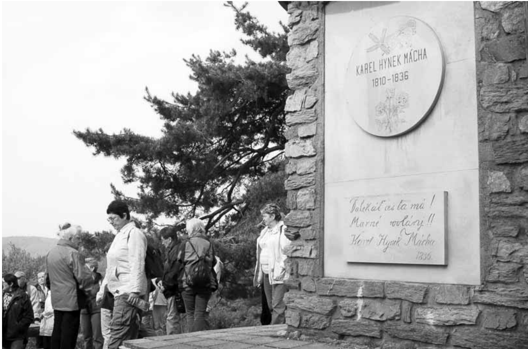
Masarykův les. Nedílnou součástí ŠLP je hojně navštěvovaný Lesnický Slávin. K jeho dominantám patří například Máchův pomník.