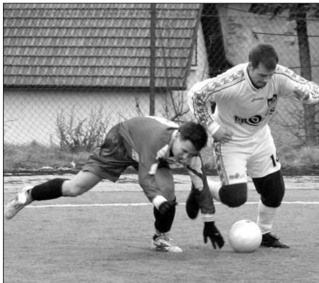
Derby. Soubor mezi Černou Horou a Bořitovem přinesl mnoho osobních souborů.