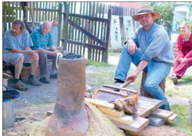
Historie. Ukázkovou tavbu předvedou členové nového občanského sdružení také na Tachovsku.