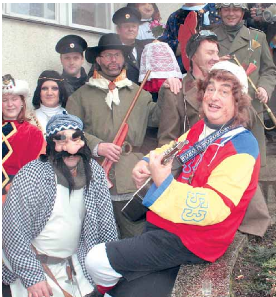
Masopust. Uplynulý víkend patřil v našem okrese oslavám masopustu. Průvody masek se vydaly do ulic, aby rozdávaly veselí. Fotka zachytila maskary ve Sloupě. Na straně šest si můžete prohlédnout, jak to vypadalo v dalších obcích. Pokud se chcete i vy pochlubit a ukázat našim čtenářům vaše masky, pošlete fotografie na adresu redakce.zrcadlo@centrum.cz.