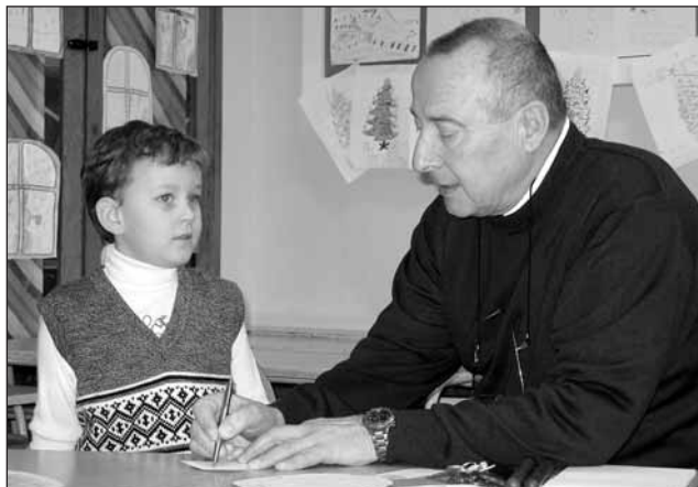
Velký den. Budoucí prvňáčci přišli minulý týden k zápisu do Základní školy v Lysicích.

Učitelé v jednotlivých třídách zjišťovali především základní dovednosti budoucích prvňáčků. Tedy jak děti mluví, jak jsou pohybově zdatní, jak dokáží dvě věci. Za prvé samoobslužnost, tedy jak se dokáže rychle oblékat, zavázat si boty, za druhé pak řeč.