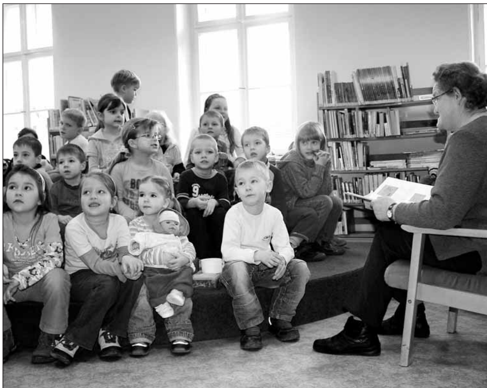
Akce. Děti poslouchají pohádku v rájecké knihovně.