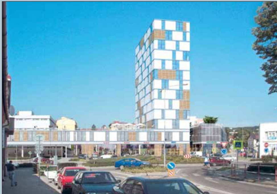
Kruhový objezd. Pohled od vlakové zastávky.