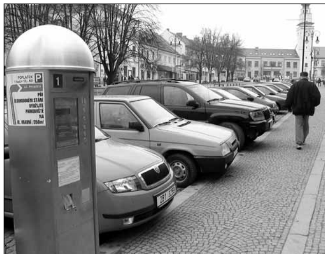
Parkoviště. Nově budou moci lidé jezdící do Boskovic využívat parkovací karty.

Aby se zabránilo masivnímu parkování v okolních ulicích,