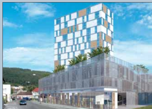
Parkovací dům. Projekt řeší závažný problém parkování v centru města. Vizualizace atx architektii

Budoucnost má areál bývalého Adastu, kde vlastníme téměř jednu třetinu pozemků. Nechceme však nic dělat amatérsky, myslím, že za námi je již něco vidět. V tomto trendu rozhodně chceme pokračovat. Kritici se ovšem najdou, ale o nich si myslím svoje. Když někdo zpochybňuje třeba kupní cenu výškové budovy, jak jsem se dočetl, ať si spočítá, kolik budeme peněz investovat.