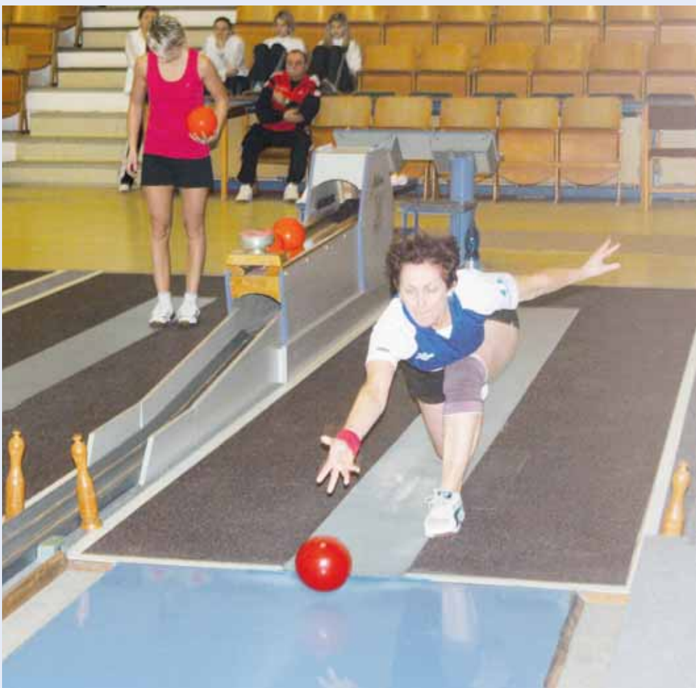
Boj o první místo. Kuželkárky TJ ČKD Blansko stále vedou tabulku 1. ligy o skóre před Slavii Praha. V domácí utkání zdolaly Valašské Meziříčí jasně 7:1.