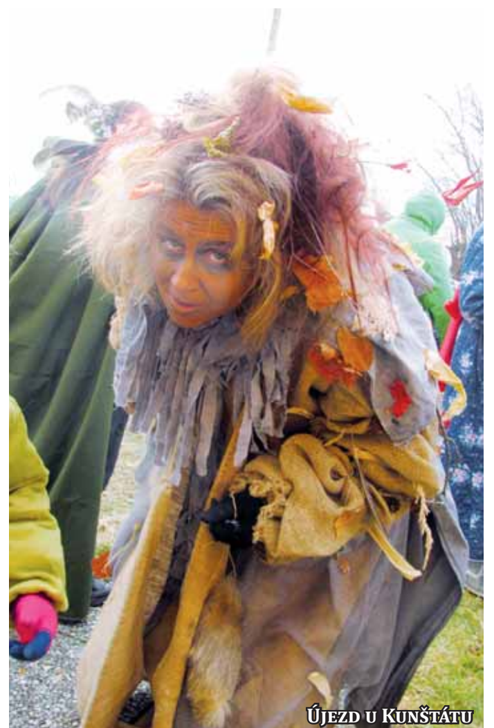
ÚJEZD U KUNŠTÁTU