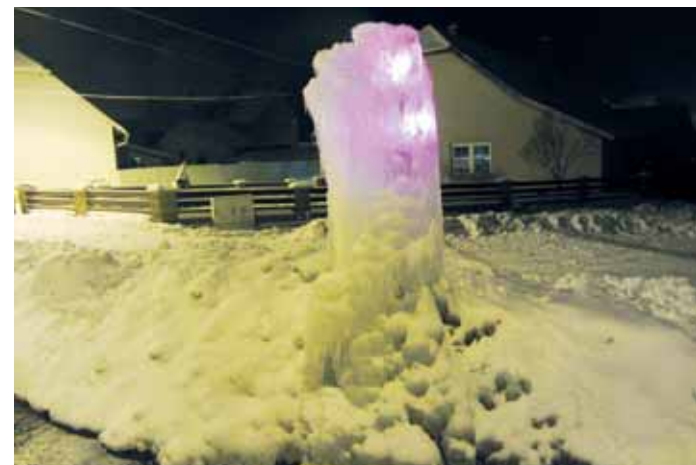
Krásná. Voda a mráz vykouzlily ve Valchově zajímavý ledopád. Netradiční výzdoba obce je navíc vždy ráno a večer podsvícena barevnými světly. Více foto na www.zrcadlo.net .