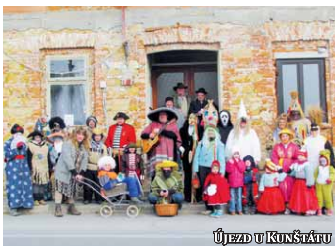
ÚJEZD U KUNŠTÁTU