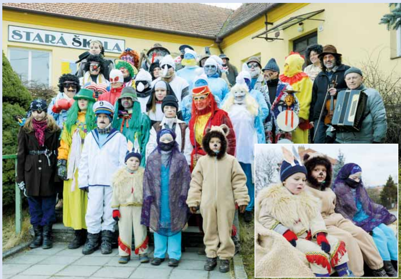
Tradice. Také v letošním roce připravili nadšenci v řadě obcí a měst blanenského okresu masopustní průvody. Nejinak tomu bylo také v Ráječku. Bohatou fotoreportáž naleznete na straně 6 a na www.zrcadlo.net .