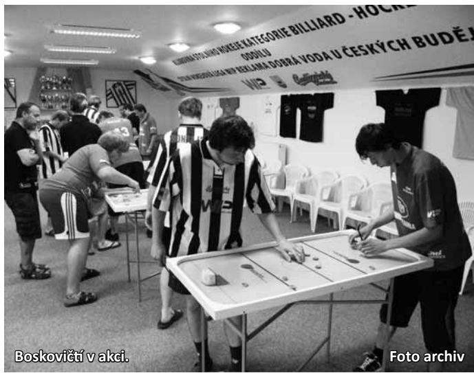
Boskovičtí v akci.

Poté již nastoupil ke svému prvnímu utkání celek Boskovic. Nejdříve proti domácímu celku. Po první směně, po které vedli domácí 3:1, dokázali boskovičtí Orli ve druhé směně senzačně otočit na 5:3 a tento náskok si již precizní