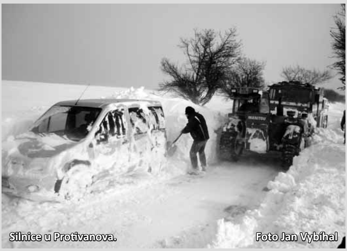
Sílnice u Protivanova.