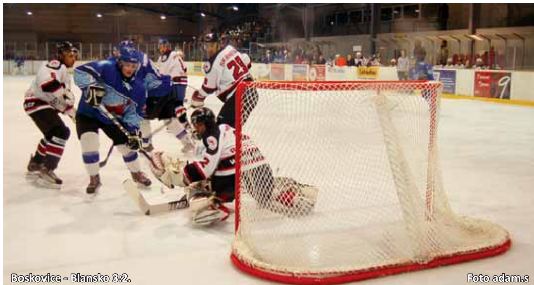
Boskovice - Blansko 3:2.