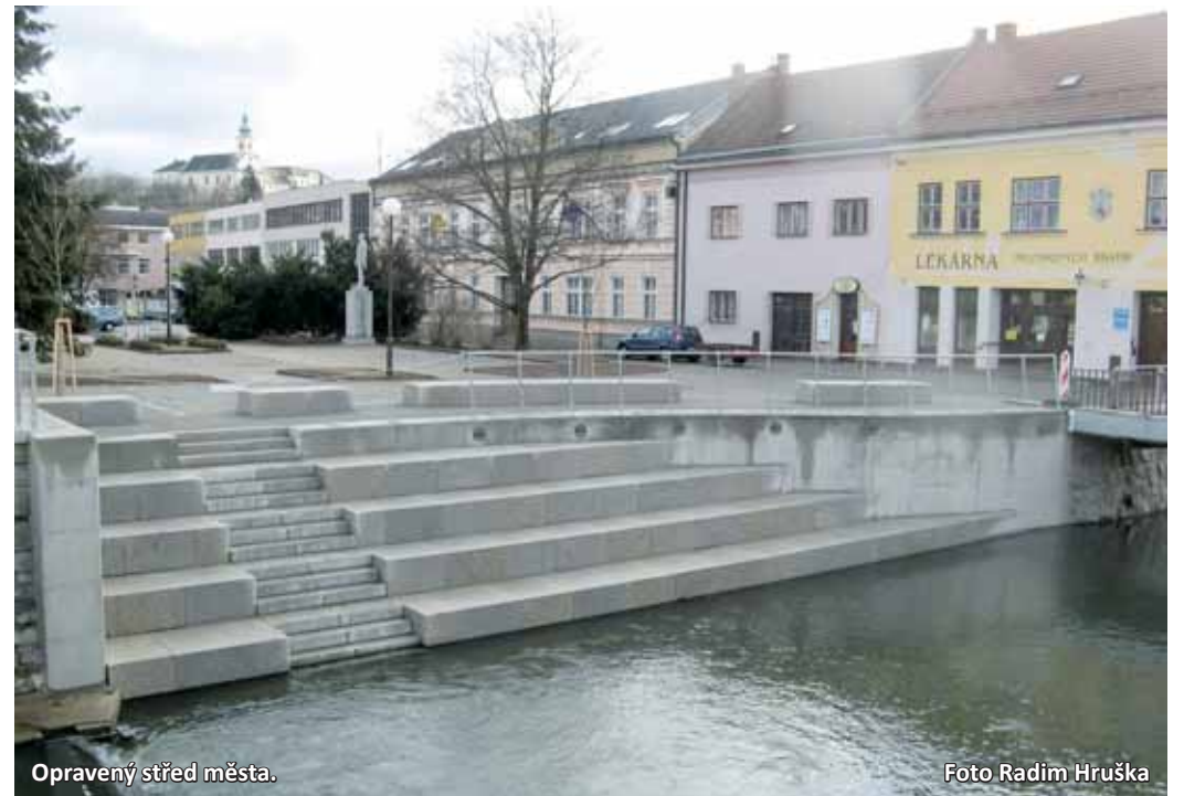
Opravený střed města.

Ano. V Letovicích máme po dlouhé době konečně veřejné toalety, za což jsem velice rád. Věc se řešila poměrně dlouhou dobu, vybíralo se vhodné místo, ale také způsob provozování sociálního zařízení. Nakonec zvítězila varianta, že toalety jsou v prostorách soukromníka a město mu platí náklady na provoz. Vstup na toaletu umožňují za pět korun automatické dveře. Provedení interiéru je takzvaně antivandal, záchodky mají i bezbariérový přístup. Pokud by se někomu udělalo nevolno, má k dispozici také bezpečnostní tlačítko. Toalety slouží čtyřicet hodin denně, což je velkou výhodou.