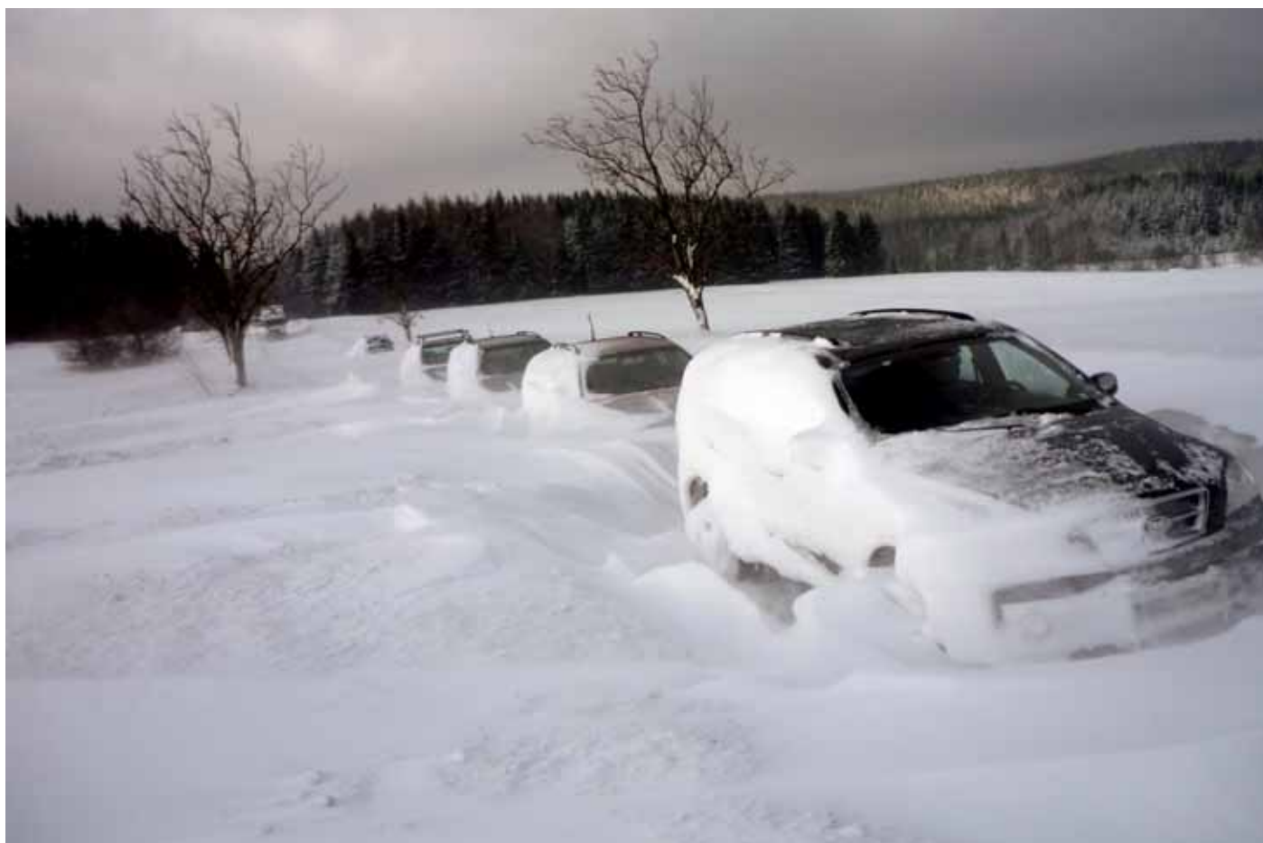
Kalamita. Silnice od Žďárné směrem na Protivanov.

Nejvíce práce měli policisté ve středu. „První nehoda se stala kolem půl šesté ráno v blízkosti Vanovic. Čtyřicetiletý řidič tam vyjel se svou Škodou Felicií ze silnice a havaroval do stromu. Při nehodě byl lehce zraněn, škoda na autě byla vyčíslena na sedmnáct tisíc korun. Dechová zkouška u řidiče nepotvrdila, že by před jízdou pil alkohol. Další nehoda se stala u Křetína, kde jednadvacetiletá řidička vyjela se svým vozem značky Suzuki Swift ze silnice a havarovala do svodidel. Nehoda se obešla bez zranění, na autě a svodidlech vznikla škoda za asi pětadesát tisíc korun,“ uvedla blanenská policejní mluvčí Iva Šebková.