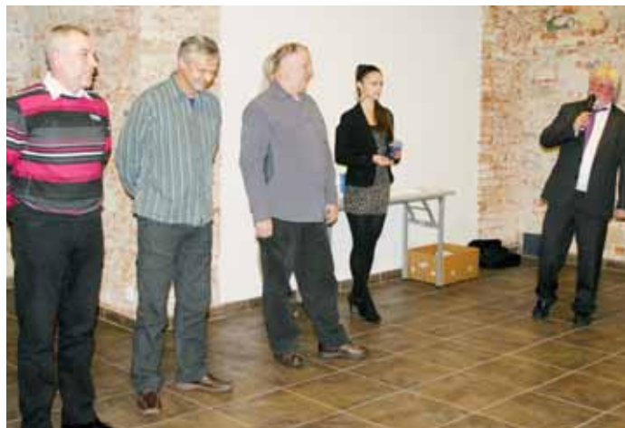
Ocenění fotbalisté. Zástupci bořitovského klubu si účasti na ceremonii považovali.

Jan Kužel, atletika Roman Meluzín, hokej