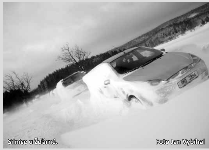
Sílnice u Žďárné.