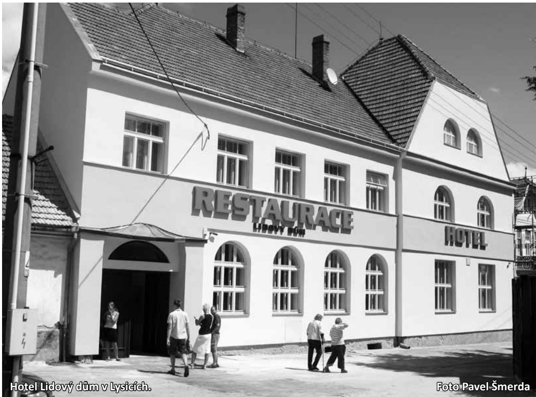
Hotel Lidový dům v Lysicích.

Ještě před penzionem jsme chtěli koupit tamní Porčův mlýn. Chodili jsme kolem něho na procházky se psem, a když jsme viděli, v jakém je stavu, chtěli jsme ho koupit a opravit. Jenže to nebylo tak jednoduché. Majitel ho nechtěl prodat, mezitím zemřel a objevilo se několik dědiců. Po složitém jednání se nám nakonec podařilo mlýn získat. Koupili jsme ho s tím, že ho buď zbojíme nebo obnovíme. Nechali jsme si tedy zpracovat statický posudek a nakonec jsme se rozhodli ho zachránit. Už v minulosti jsme z vyprávění slyšeli, jak tam byl náhon a vedle rybník. Musím říct, že obnova historického mlýna byla hodně náročná, ale nakonec se nám podařilo dát vše do takového stavu, jaký jsme si představovali. Tedy včetně náhonu, rybníka i mlýnského kola. Nyní tam funguje i stylové ubytování, rybářská krčma a zájemci si mohou zkusit umlít i mouku.