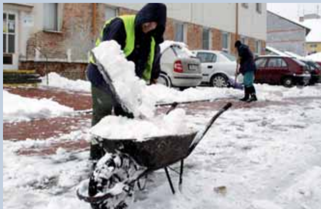
Kalamita. Pracovníci technických služeb si ve všech sil snažili poradit se sněhovou nadílku.