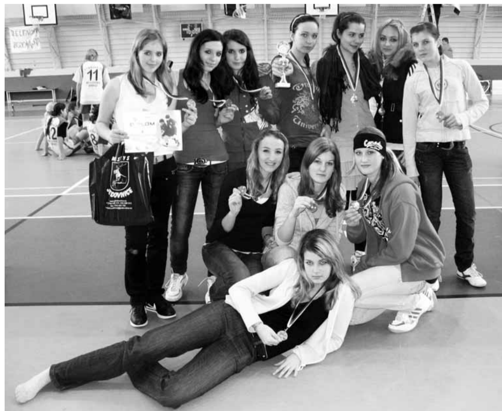
Bronz. Děvčata ze ZŠ Salmova v Blansku skončila na třetím místě v kraji.

bude vrcholem krajský přebor, který se uskuteční v polovině února v hale SPŠ Jedovnice, kde budou náš region reprezentovat.