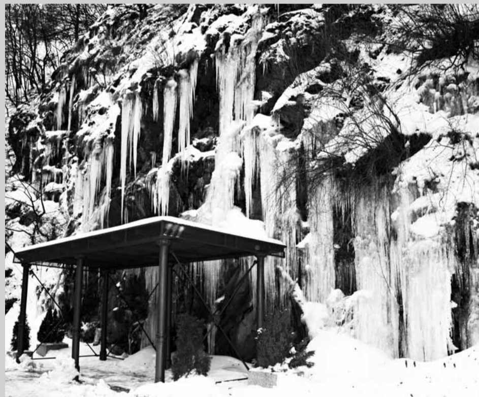
Zimní krása. Mrazivé počasí způsobilo, že u autobusové zastávky před vchodem do DSB Euro v Pustém žlebu vznikla unikátní přírodní scenérie.