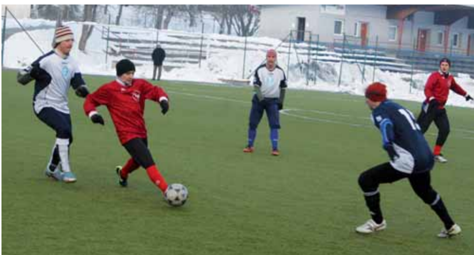
Remíza. Boskovice se na úvod turnaje rozešly smírně s Kunštátem.

Domáci se ujali velmi záhy vedení, když v 10. minutě roz-