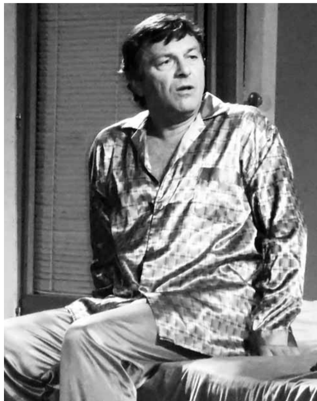
Divadlo. V únoru se divákům v Blansku představí také oblíbený herec Pavel Trávníček.

stoupí v Dělnickém domě Petr Spálený a Apollo Band, 1. dubna pak přijde jeden z vrcholů letošního roku, koncert první české SuperStar Anety Langerové. Na ten naváže 14. dubna v kině koncert Karla Plíhala a o tři dny později jazzové vystoupení HDV Tria z Rakouska.