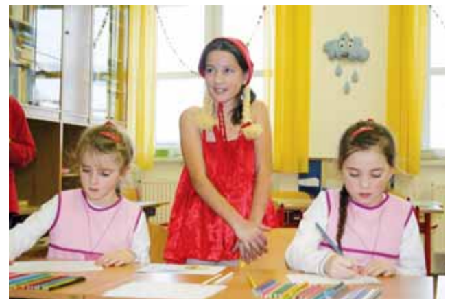
Pohádka. Červená karkulka doprovázela děti při zápisu do první třídy v Drnovicích.

Stejně jako v Jablůnanech pojali i v Drnovicích zápis do první třídy, který se konal minulý týden, pohádkově. „Po škole se pohybovali žáci čtvrté