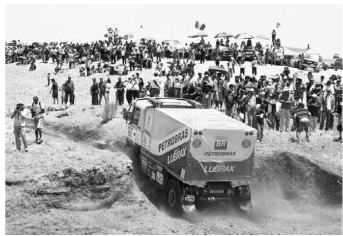
Závod. Vozidlo tatra pilotované Andre de Azevedem na trati Rally Dakar.