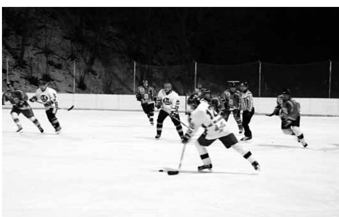
Pod Skalami. I letos je ve Sloupu díky arktickému počasí přírodní led. Ve středu zápas domácí hráli před asi 150 diváky mistrovské utkání proti HC Blansko. Úspěšnější byli hosté.