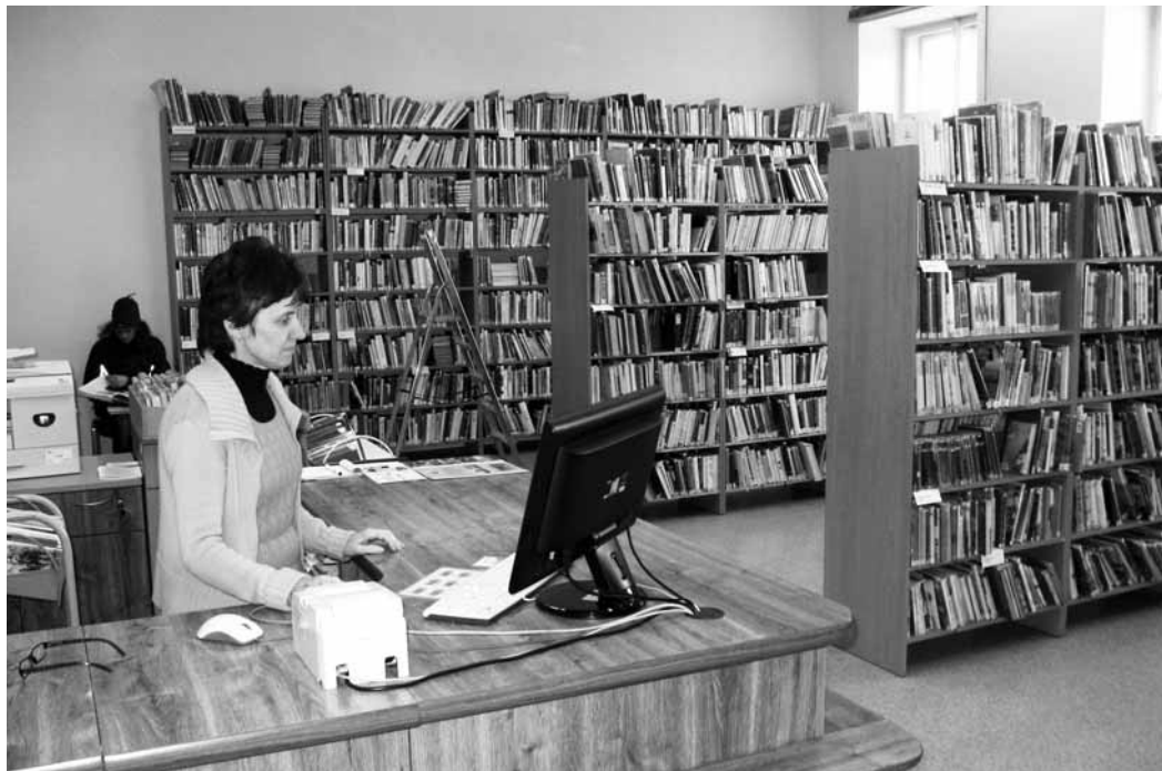
V novém. Knihovna se přestěhovala do budovy bývalé školy v Tyršově ulici.

Letovická knihovna nabízí více než tisícové registrovaných čtenářů na osmdvacet tisíc svazků. Aktuálně se tam koná například