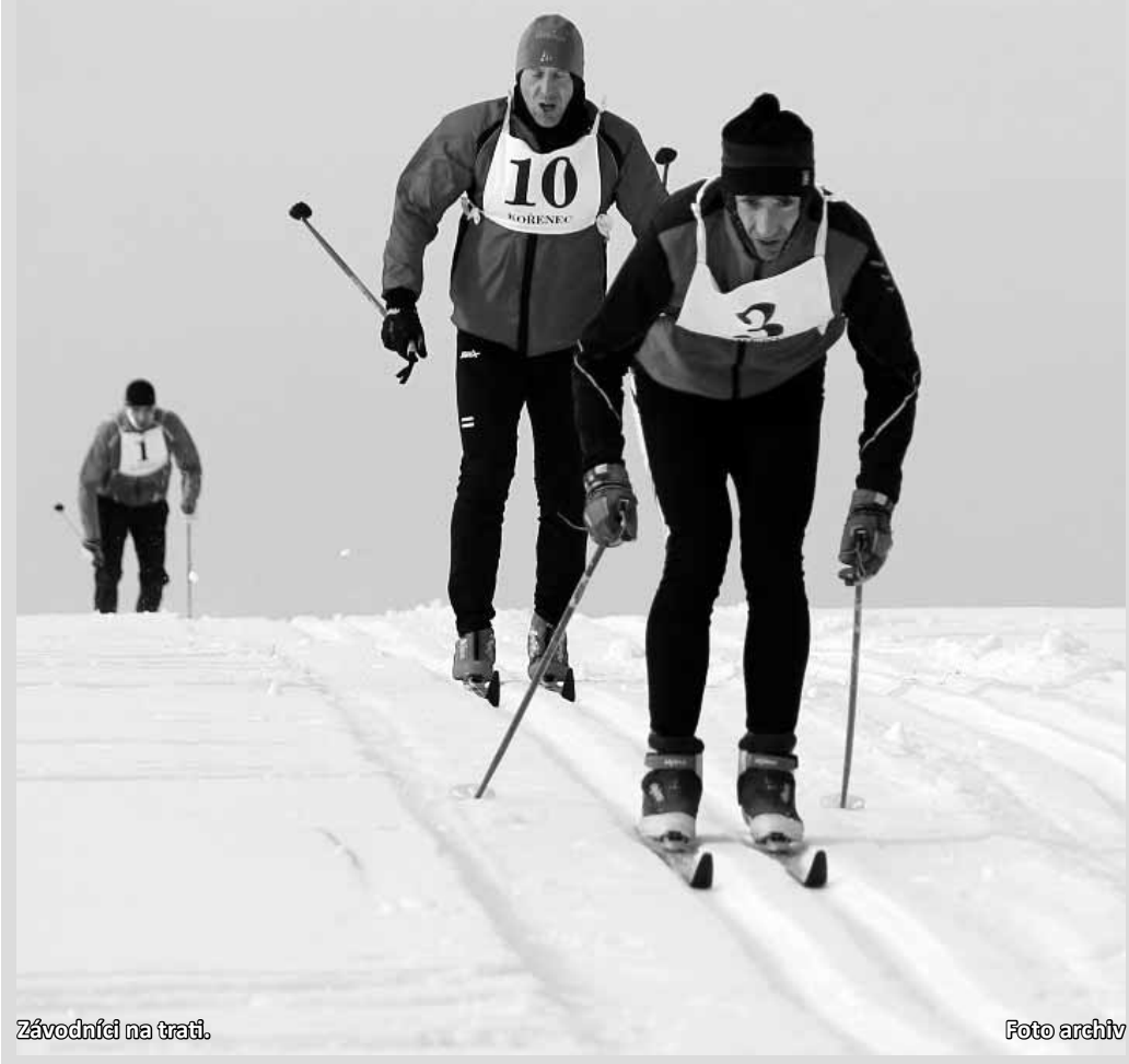
Závodníci na trati.