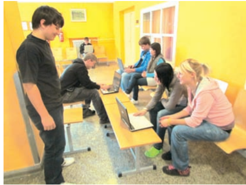
Foto: – studenti školy mohou využívat WI-FI síť v celém areálu.

v přijímacím řízení. Každá návštěva nás potěší.