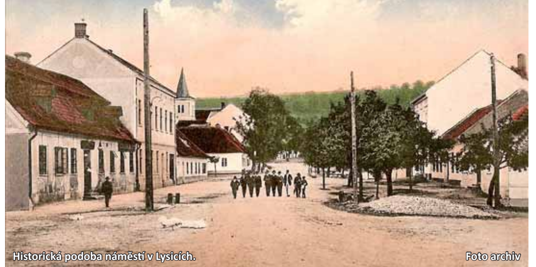
Historická podoba náměstí v Lysicích.