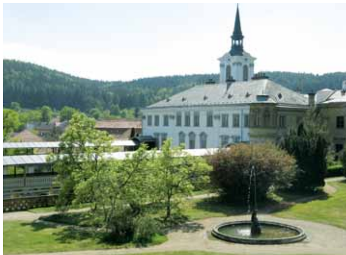
Dominanta. Lysický zámek každý rok navštíví desítky tisíc lidí.