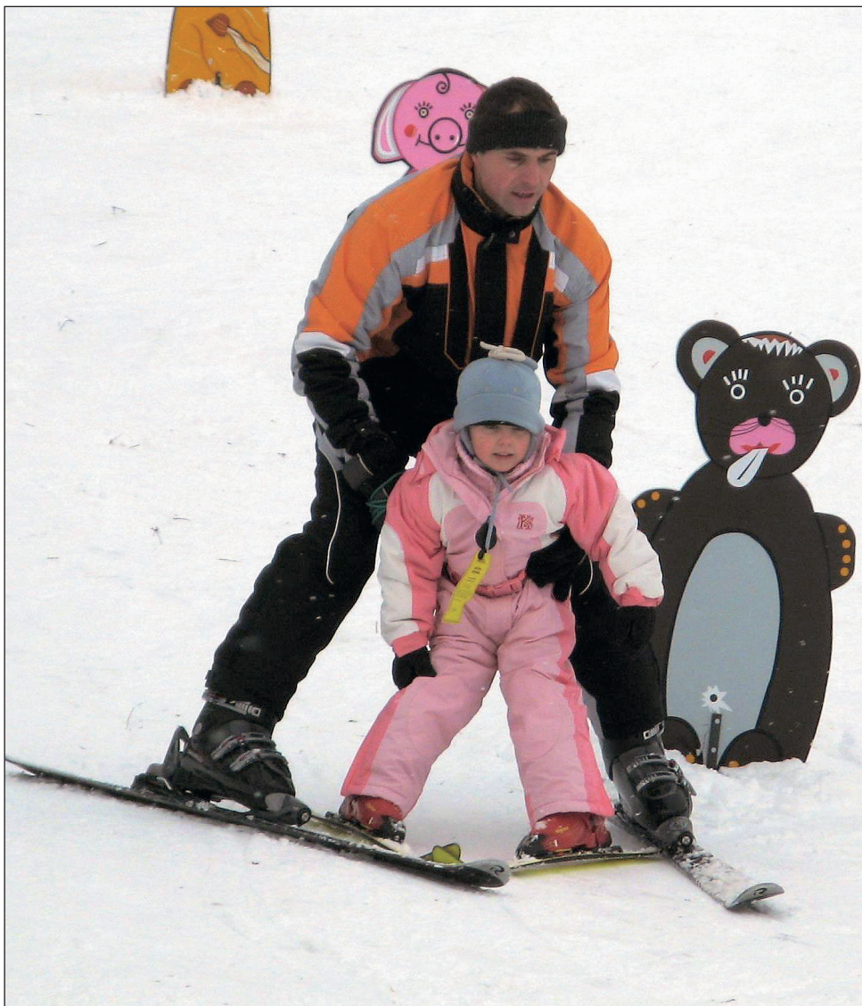
Zimní radovánky. Přivázy sněhu přivítali nejvíce lyžaři. Plno bylo o víkendu ve všech zimních střediscích na Blanensku.

Množství napadeného sněhu potěšilo lyžaře. O víkendu se rozjely vleky v Blansku, Hlubokém i Olešnici. Zájem milovníků sněhu byl velký. „Jen v sobotu jsme měli na parkovišti lyžařského areálu kolem sto padesáti aut,“ pochvaloval si starosta Olešnice Zdeněk Peša.