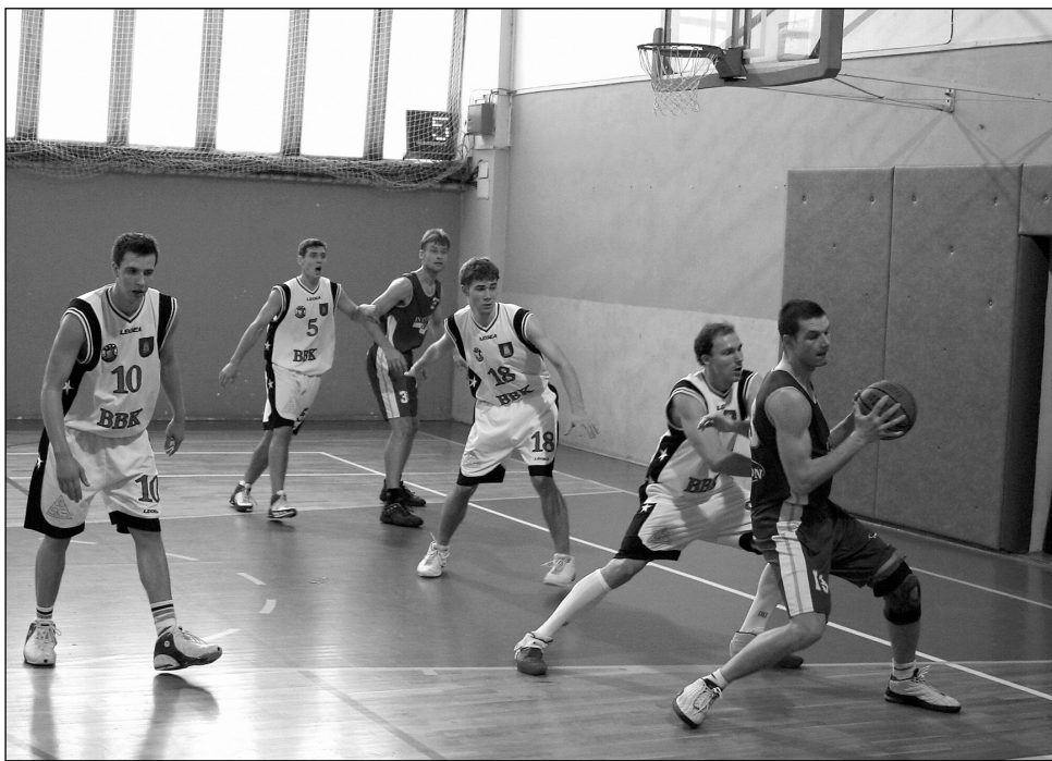
Dvě výhry. Domáci palubovka tentokrát blanenským basketbalistům (v bílém) svědčila.