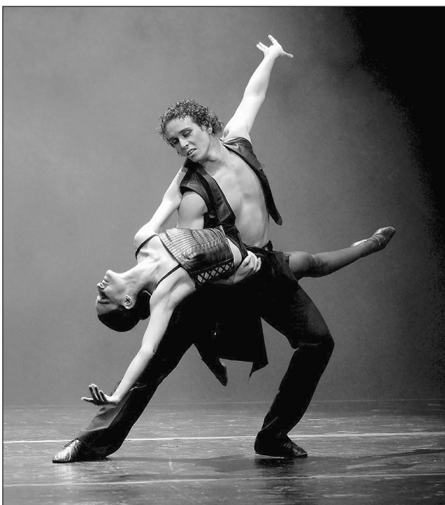
Umění. Inspirací pro fotografii jsou často i divadelní představení.