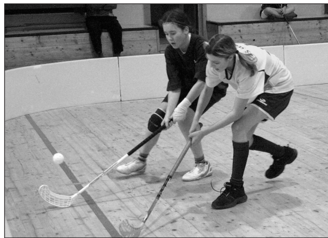
Souboj. Děvčata ze Sloupu (ve světlém) uhrála ve skupině remízu proti pozdějším vítěžkám z Brna.