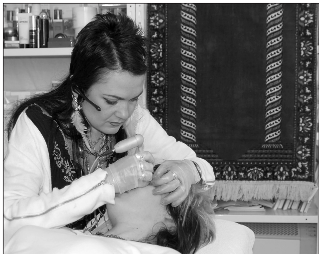
Vizážistka. Tetování obočí a očních linek je náročné, ale ženě ušetří čas při každodenním líčení.

Už teď přemýšlí, jaká témata líčení asi budou zadána na mistrovství republiky a jak zvládnout zadaný úkol co nejlépe, aby se sen o Düsseldorfu stal skutečností.