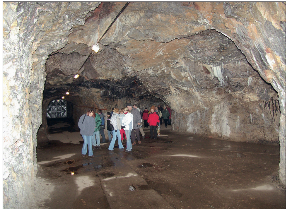
Novinka. Největším lákadlem letošní sezóny bude v Moravském krasu zpřístupnění další jeskyně.

Plány, které máme, nelze realizovat v průběhu jediného roku, důvody jsou kapacitní i finanční. Navíc nechceme omezovat návštěvníky. Proto některé změny plánujeme na etapy trvající i několik let. Například jeskyni Balcarcku čeká celková rekonstrukce. Sloupsko-šošůvské jeskyně se dočkají, řekneme v průběhu pěti let, rozšíření stávajícího parkoviště, počítáme i s vybudováním skanzenu sídliště lovců doby kamenné v jeskyni Kůlna.