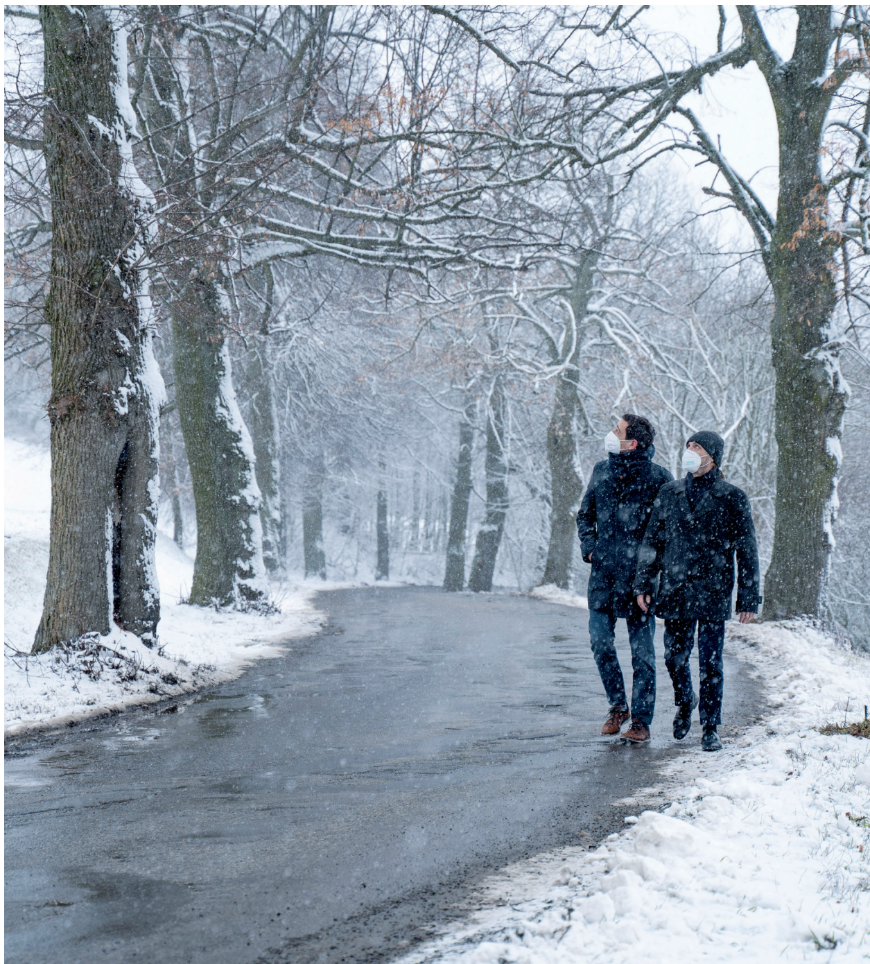
Svárovská alej by mohla zůstat zachována. Čtěte na straně 12