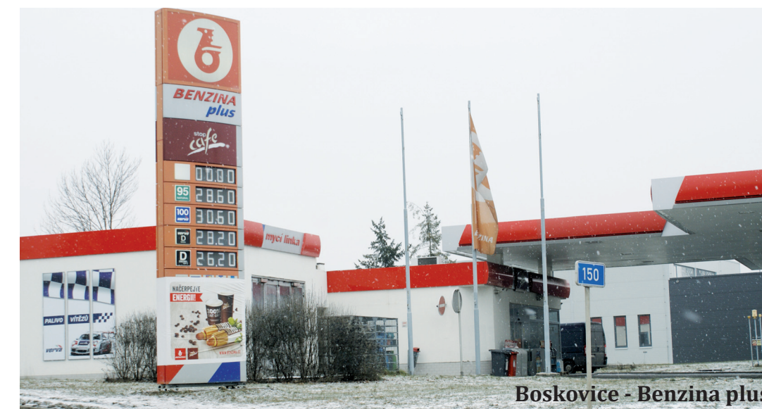
Boskovice - Benzina plus