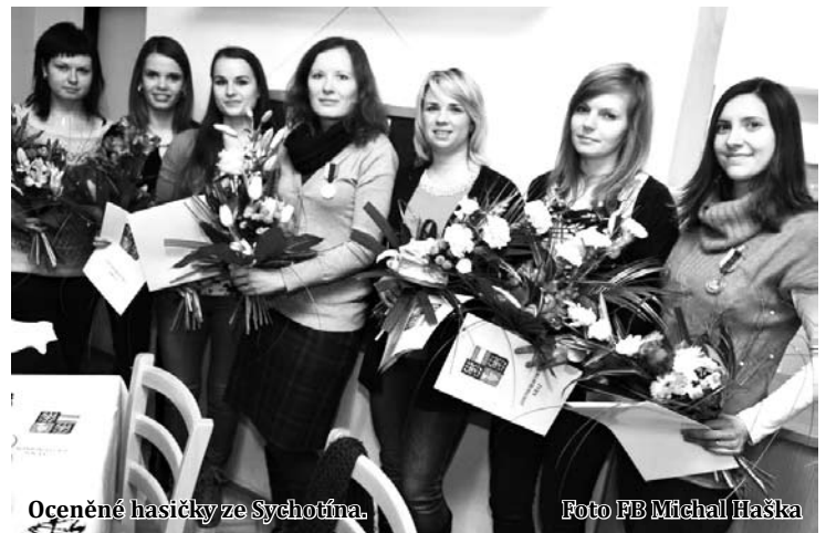
Oceněné hasičky ze Sychotína.

Ženy SDH Sychotín bojují v extralize ČR od roku 2011. V letech 2011 a 2012 obsadily šestá místa, v roce 2013 místo čtvrté, v roce 2014 mís-