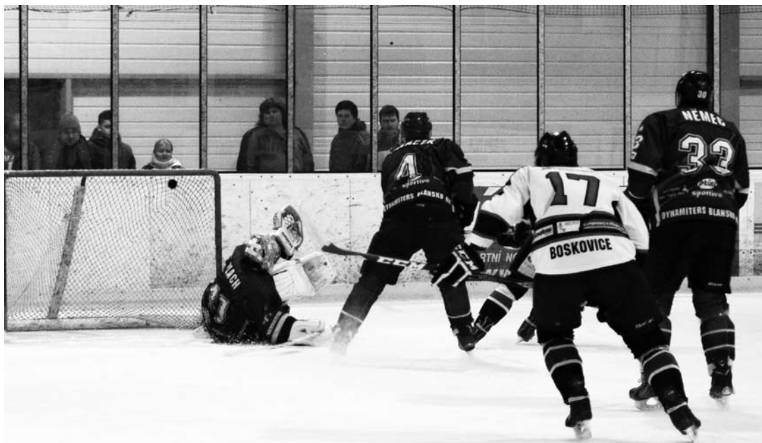
Boskovice - Blansko 4:3.