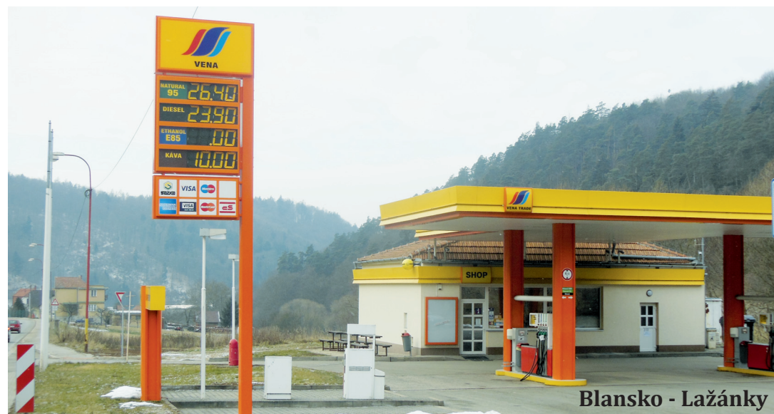
Blansko - Lažánky

REGION - Ceny benzínu a nafty díky levné ropě klesají. Podle statistik řidiči kupují pohonné hmoty nejlevněji za posledních šest let. Zrcadlo proto zmapovalo aktuální ceny benzínu a nafty u většiny čerpacích stanic v regionu. K benzínkám vyrazili zpravodajové Zrcadla v pondělí 18. ledna dopoledne. Nabídku každé z nich vyfotografovali. Ze srovnání cen vyplývá, že rozdíl mezi tou nejlevnější a nejdražší u benzínu činil dvě koruny a dvacet haléřů u benzínu Natural 95 a tři koruny v případě nafty. Z přehledu pak vykristalizovaly tři čerpací stanice, které suverénně kralovaly v nejnižších cenách obou paliv.