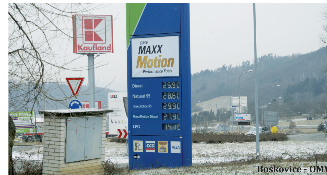
Boskovice - OMV