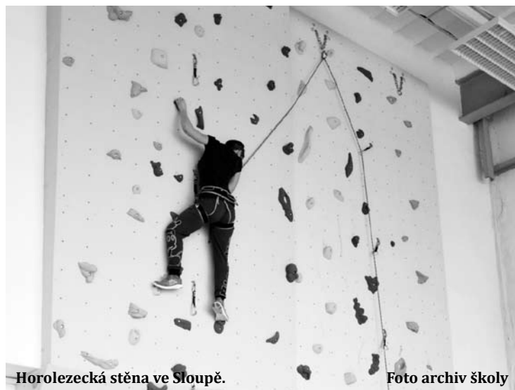
Horolezecká stěna ve Sloupě.

Od druhého pololetí se rozbíhá nepovinný kroužek lezení. Také je samozřejmě možné využívat stěnu v hodinách tělocviku, bude záležet na každém vyučujícím, jakým způsobem zařadí nový prvek do výuky. Horolezecká stěna navíc navazuje na místní přírodní podmínky; do Sloupu se sjíždějí horolezci z celé republiky. „Jedním z výstupů kroužku by tedy