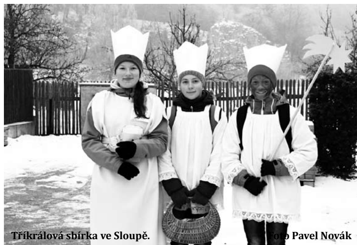
Tříkrálová sbírka ve Sloupě.

Další prostředky půjdou na preventivní aktivity dětí a mládeže, na