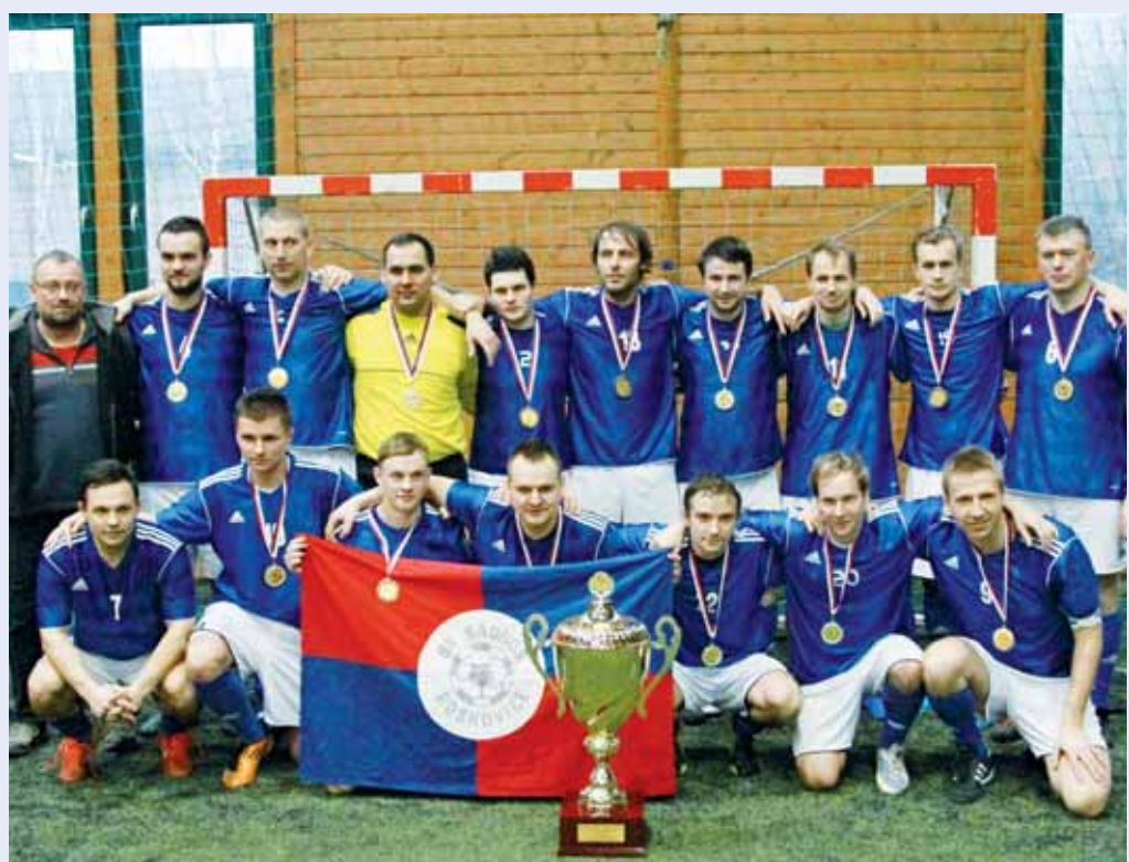
Úspěch. Boskovická malá kopaná slaví úspěch. Hráči TJ Sadros Boskovice získali o víkend titul mistra republiky. Více na straně 10.