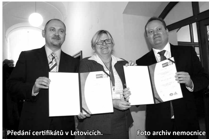
Předání certifikátů v Letovicích.

bude mít nadále moji podporu i podporu krajské samosprávy,“ líbí se mu. S vedením radnice se i proto dohodl na jedné konkrétní věci. „Budou navrhovat krajské samosprávě podporu zavádění nových informačních technologií v blanenské nemocnici. Předpokládám, že půjde o jednotky milionů korun. Samozřejmě jako kraj investujeme i do krajských zařízení, která se nacházejí tady v Blansku, konkrétně listopadové zastupitelstvo schválilo využití prostředků z Evropské investiční banky mimo jiné i na zateplení blanenského gymnázia, které zřizuje kraj,“ uvedl na tiskové konferenci na závěr návštěvy Blanska hejtman Michal Hašek. Jak dodal, bude-li mít vedení školy zájem, přijde na program jednání i možná investice do venkovního sportovního hřiště, které jí dlouhodobě chybí.