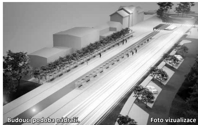
Budoucí podoba nádraží. Foto vizualizace

kvalitnímu zastřešení nástupišť autobusového nádraží a doplnění potřebného mobiliáře, čímž se významně zvýší komfort cestování pro občany celého regionu Tišovska, kteří tento významný krajský přestupní uzel denně užívají. „Dlouhodobě také řeší-