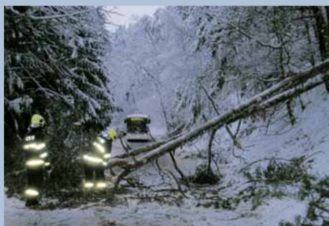
Zásah. Hasiči odstraňují popadané stromy, které blokovaly provoz.

Nadále budu spolupracovat s dětmi, pracovat ve firmách. Na druhé straně budu mít více času na rodinu, na manželku, která byla většinou sama doma, zatímco já byl na cestách. Chci se věnovat i svým koníčkům. Jezdit po památkách, obdivovat starožitnosti, krásu ruční lidské práce.