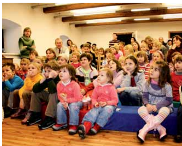
Zahájení. Jednou z prvních akcí v nových prostorách mateřského centra bylo loutkové představení pro děti.

„Mateřské centrum Jablíčko vzniklo v únoru roku 2008. Od začátku jsme se scházeli ve farním sále. Byli jsme za to moc rádi, ale na druhé straně musíme přiznat, že to nebylo úplně ideální. Pokaždé jsme po našem setkání museli stěhovat různé věci, takže nám v hlavě „hlodala“ myšlenka, najít vhodné „vlastní“ prostory pro naši činnost. Jsme rádi, že se pan farář rozhodl zrekonstruovat první patro fary, čímž naše hledání značně uspěl. Moc