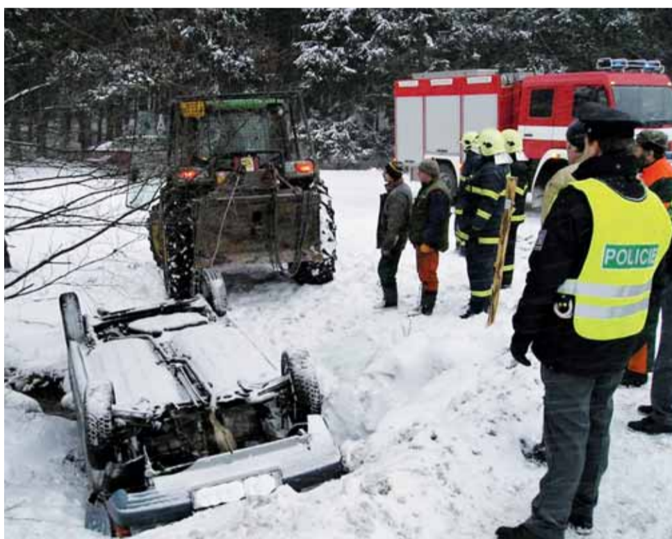
Nehoda. Hasiči zasahují u Ludíkova. Auto tam skončilo v potoce.

Plné ruce práce měli především v sobotu a v neděli hasiči, kteří vyjžděli na celém území Blanenska a Boskovicka odstraňovat větve a stromy popadlé na silnice a dráty elektrického vedení. „Stromy a větve