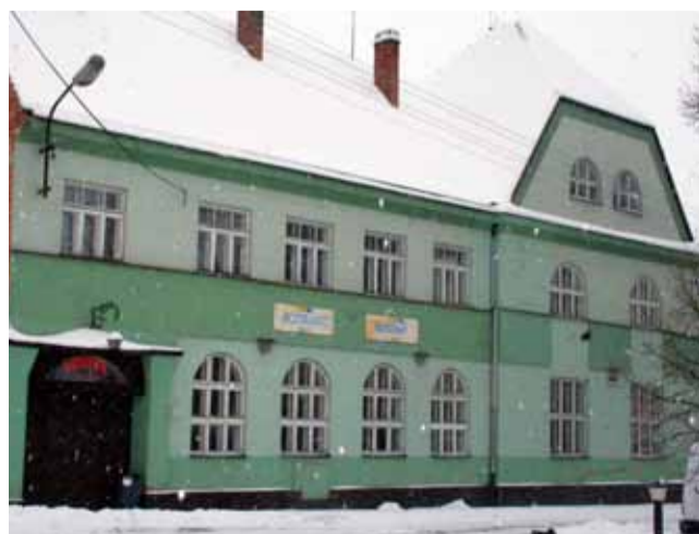
Oprava. Hotel Lidový dům čeká v nejbližších měsících rekonstrukce.

„Hotel Lidový dům pro nás není žádná neznámá. Dříve jsme tam chodili na oběd, vedli jsme ale také v patrnosti, že je už několik let uzavřený. V Býkovicích jsme postavili a rozjeli provoz penzionu, opravili historický mlýn, dokončujeme rybárnu, takže jsme si řekli, co dál. Jedna z myšlenek byla, že bychom rozšířili naše aktivity