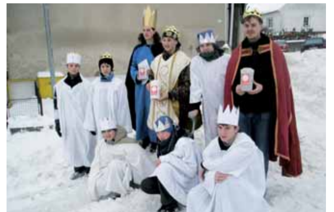
Pro charitu. Jedovnickí skauti se zapojili do celorepublikové akce Tříkrálová sbírka. Skupinky koledníků putovaly po domácnostech. Vybraná částka z jedenácti pokladniček bude využita na projekty pro Oblastní charitu Blansko.

Je to neuvěřitelné, ale ani uprostřed sněhové kalamity nezaháleli zloději. Před domem na blanenském sídlišti Sever zmizelo přes noc z pátku na sobotu osobní auto.