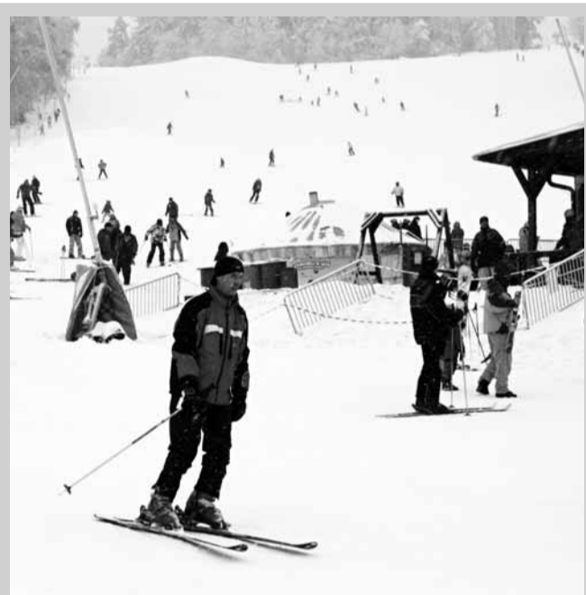
Lyžování. Milovníci zimních sportů si o víkendu přišli na své. Do ski-areálu v Olešnici se jich sjely stovky. Čekalo na ně šedesát centimetrů upraveného sněhu a tři vleky. Pro nejmenší si provozovatel připravil speciální školu lyžování.