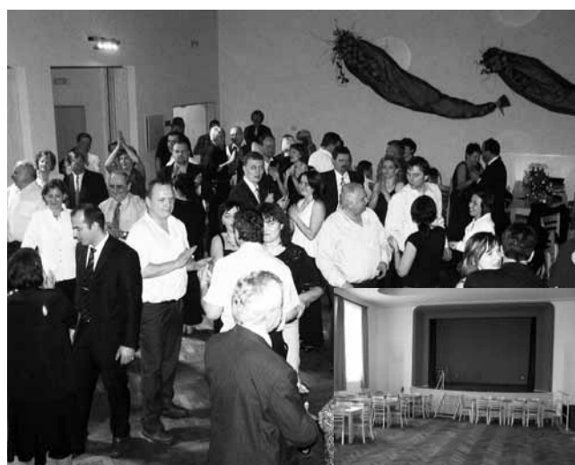
Sokolovna. První akcí v nově opraveném kulturním domě v Knínicích byl I. reprezentační ples městyse.

„Budova patří v současné době městyši, který ji převzal od Sokolů. Počátky kulturního domu sahají až do roku 1951, kdy Sokol požádal o povolení jeho stavby. To dostal o dva roky později a v roce 1954 kulturní stánek zahájil svůj provoz. Samotná stavba probíhala pomocí mimořádných brigád hlavně Sokolů a obyvatel obce.