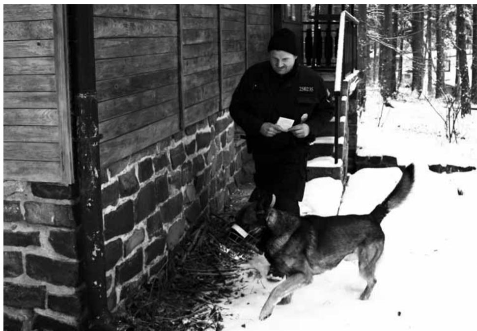
Obchůzka. Policista se psem při kontrole jednoho z objektů v rekreační oblasti v Jedovnicích.

Už delší dobu pozorují příklon k operačním porodům. Počet císařských řezů v celé republice i v Boskovicích konti-