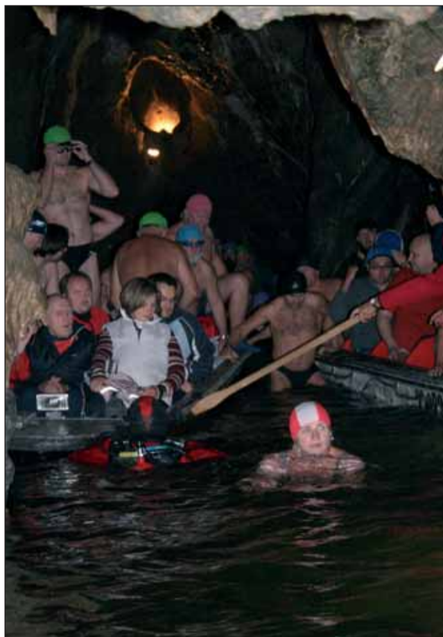
Do chladných vod podzemní říčky Punkvy se ponořili již tradičně na úvod své sezóny otužilci.

Kalendář města na příští rok představili v Letovicích. Fotografie Bohumila Kociny vystřídaly malby dětí ze základní školy.