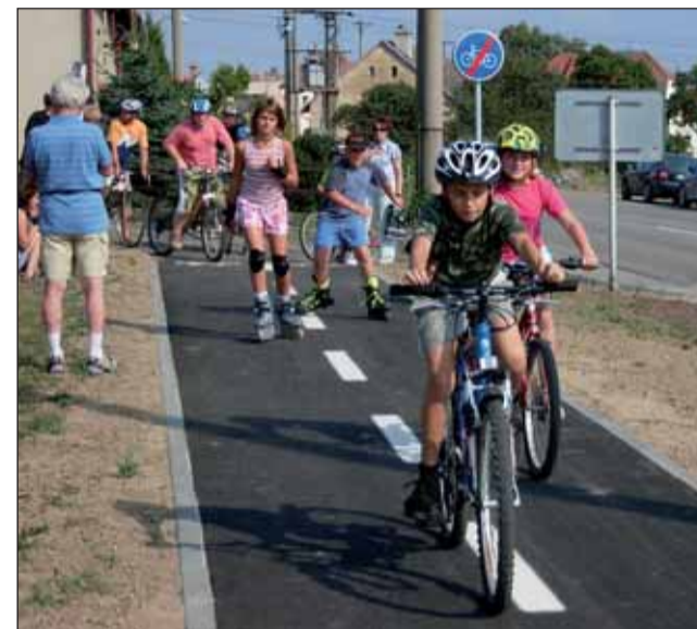
Nová stezka spojila v loňském roce Kunštát a Újezd u Kunštátu.

První místo pro Moravské sklepní nefiltrované pivo v kategorii Desítka roku a druhé místo pro Kvasar v kategorii Speciál roku získal Pivovar Černá Hora v soutěži, kterou