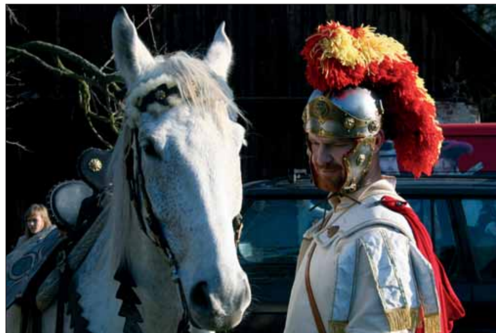
Již podruhé se vydal do blanenských ulic průvod vedený patronem města svatým Martinem.

Na Hubertovu jízdu do Lysic přijel herec Václav Vydra.