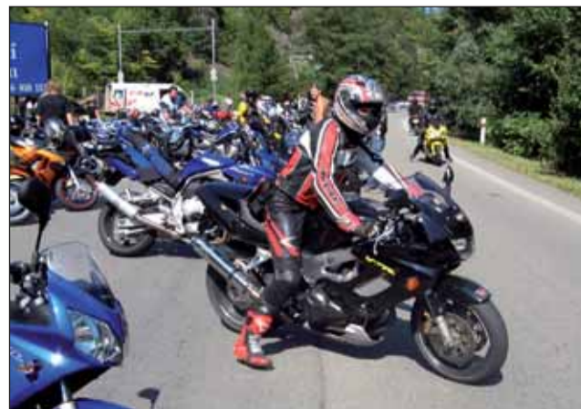
Blanenští policisté připravili pro milovníky motorek speciální preventivní akci.

Ve Vilémovicích byla otevřena nová Peší trasa Vilémovice – brána do Moravského krasu.