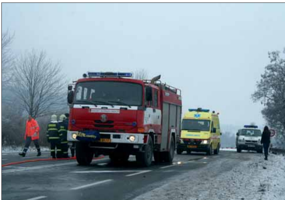
Nehoda. Na silnici zůstaly dva vraky ohořelých vozidel. I přes okamžitou pomoc záchranářů na místě zahynuli čtyři lidé.