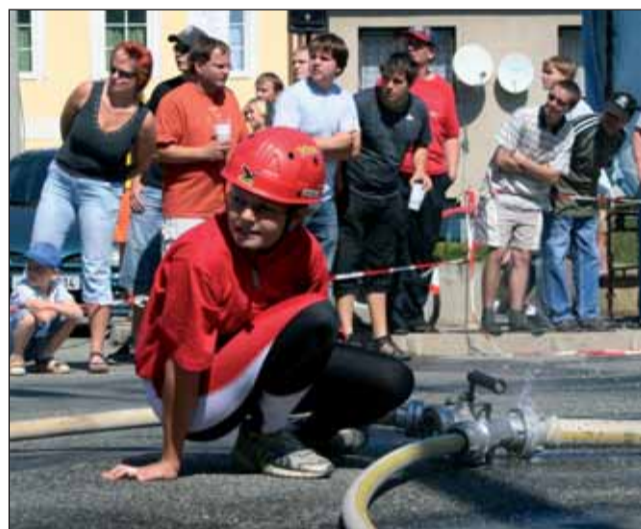
Velká cena Blanenska v požárním útoku zavítala také loni na náměstí v Lysicích.

Šestatřicetiletá motorkářka zahynula na silnici mezi Hodonínem a Rozsečí.