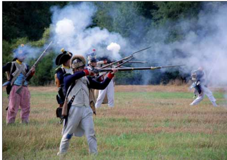
Již tradičně se setkaly koncem prázdnin kluby vojenské historie na poli u sloupského autokempu.

Němčice hostily sedmé kolo Velké ceny Blanenska v požár-