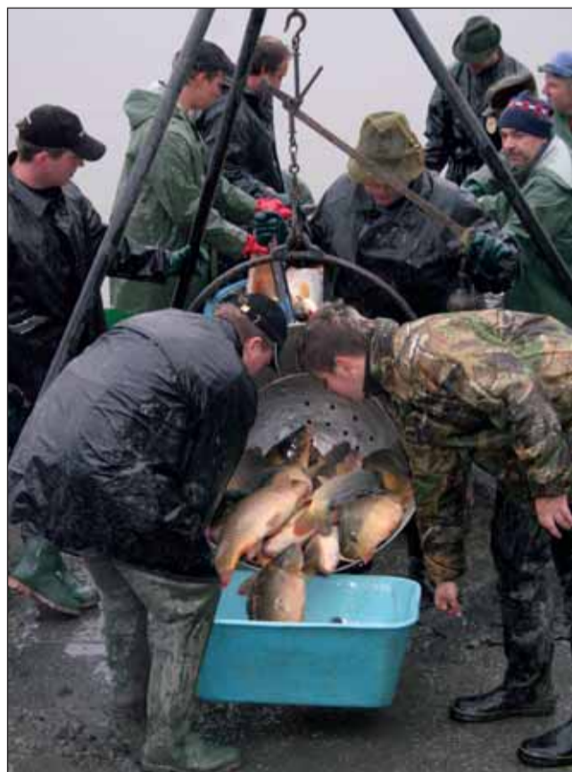
Nebyvalému zájmu se v loňském roce těšil výlov jedovnického rybníka Olšovec.

Velká cena Blanenska v požárním útoku pokračovala ve Žďáru. S těžkou tratí se nejlépe vyrovnaly domácí ženy a muži z Horního Poříčí.