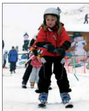
Pro děti. V Olešnici funguje i dětský vlek.

Olešnický lyžařský areál v těchto dnech jede na plné obrátky. Hlavně o sobotách a ne-