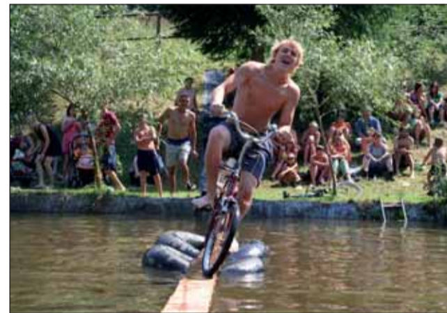
Populární přejíždění lávky na kole se konalo v Drnovicích (viz. snímek) a v Lažanech.

Dvanáctý ročník Evropské noci pro netopýry se ko-