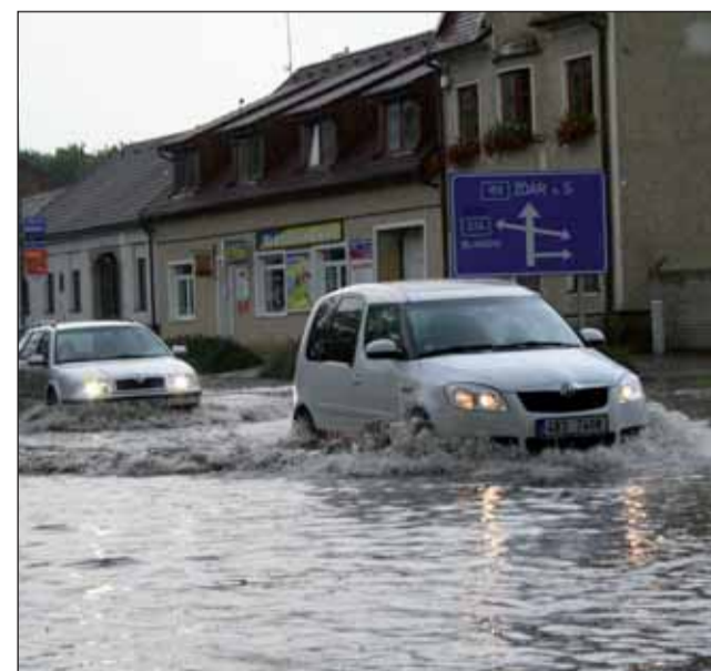
Boskovice zasáhl silný přívalový déšť. Některé ulice se proměnily v řeku.

Křest knihy Jiří Brtnický – Obrazy byl součástí vernisáže