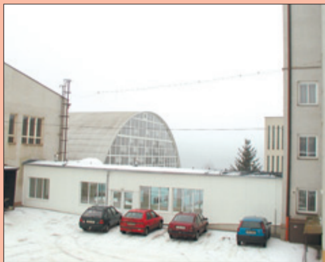
Střední průmyslová škola v Jedovnicích se chlubí moderním vyučovacím a sportovním zázemím. Nový bezbariérový spojovací krček propojuje objekty areálu školy.

Střední škola potravinářská a služeb, Brno, Charbulova 106 SÍDLŮ: Charbulova 106 • 618 00 Brno