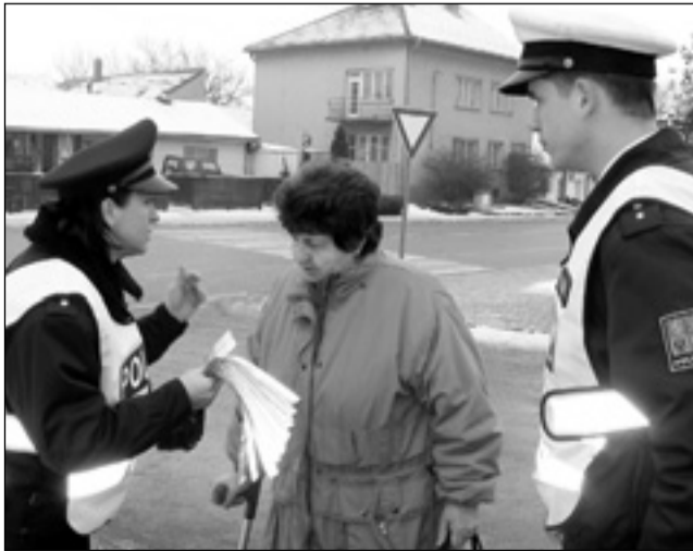
Akce. Policisté předávali lidem reflexní přívěšky a pásky.

Toto motto se objevilo na všech materiálech, které policisté rozdávali účastníkům silničního provozu – jak řidičům, tak zejména chodcům. Pro jejich bezpečnost byla určena především. „V prosinci byli za špatné viditelnosti na několika místech na přechodech sražení chodci včetně dětí. Tomu bychom rádi předcházeli,“ vysvětlila Soňa Svobodová