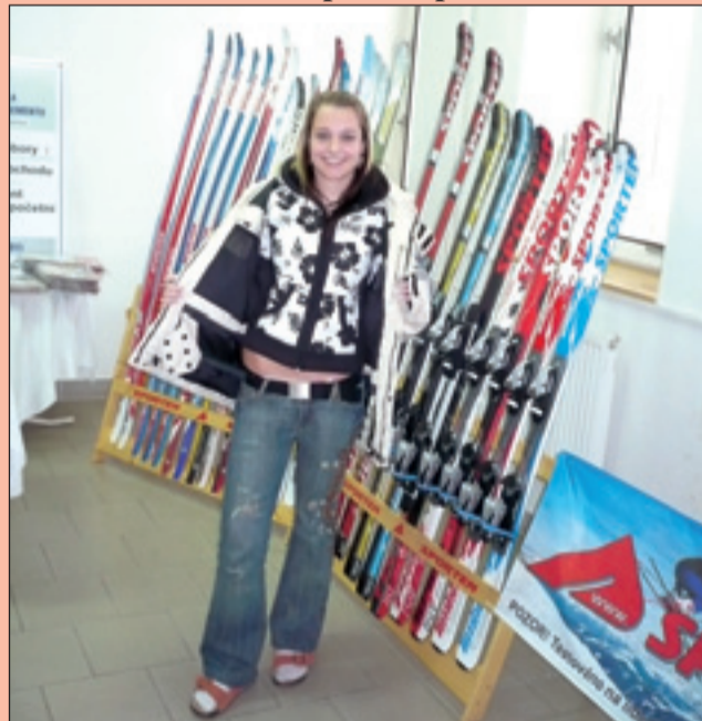
Velkým lákadlem pro žáky základních škol byla v rámci Dne otevřených dveří dne 7. 12. 2007 na Soukromé střední škole podnikání a managementu, o.p.s. v Boskovicih výstava kompletního sortimentu lyží a snowboardů firmy SPORTEM z Nového Města na Moravě.