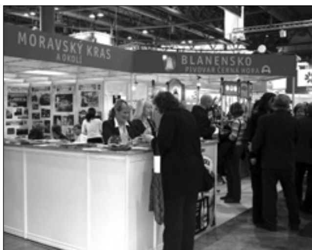
Veletrh. Stánek Moravský kras a okolí na brněnském výstavišti.