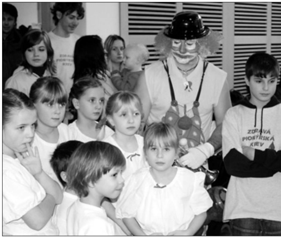
S úsměvem. Pionýrská skupina Boskovic připravila pro hendikepované děti tradiční vítání nového roku v boskovickém zámeckém skleníku. Již sedmý ročník akce přinesl řadu zajímavých vystoupení (viz foto) a na děti se přišel podívat také klaun.

vanovsko, Časnýř a Černohor-sko. Skupina se snaží rozvíjet své území pomocí metody LEADER. Základním principem této metody je partnerství rozhodujících aktérů rozvoje oblasti, tedy podnikatelů, obcí a neziskových organizací. Skupina realizuje i vlastní projekty, jedním z nich je například značení místních produktů v turistickém regionu Moravský kras a okolí. (ama)