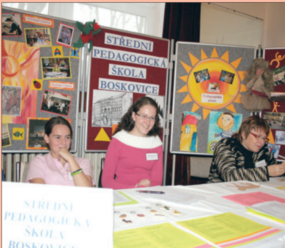
Burza středních škol se v boskovické sokolovně stala již tradicí. Začátkem listopadu se pro žáky a jejich rodiče stává burza jednou z posledních možností získání informací k volbě výběru budoucího povolání.