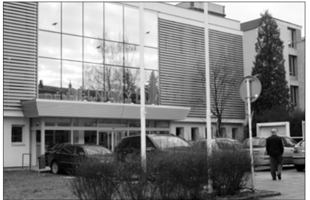
Investice. Blanenští chtějí i letos dát peníze do Dělnického domu.