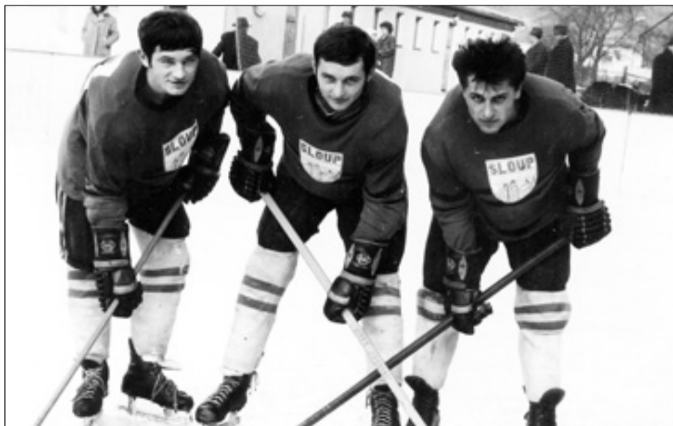
Bašta. Zejména začátkem sedmdesátých let patřil k nejlepším týmům v celém kraji Sokol Sloup, na jehož přírodním kluzišti se odehrálo bezpočet nezapomenutelných derby.

Na území bývalých okresů Boskovice a Blansko byly v té době ustaveny okresní sekce ledního hokeje, které řídily soutěže na úrovni okresů. Na úrovni kraje řídily soutěže krajské sekce. Po sloučení obou našich okresů v roce 1960 řídila okresní soutěže na okrese Blansko okresní sekce ledního hokeje, později přejmenovaná na okresní svaz ledního hokeje. Pokračování příště