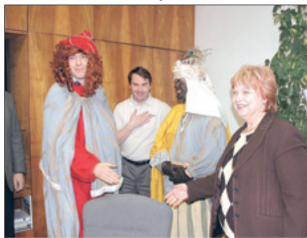
Tři králové vybírající na charitu navštívili v pondělí 7. ledna i vedení radnice v Blansku.