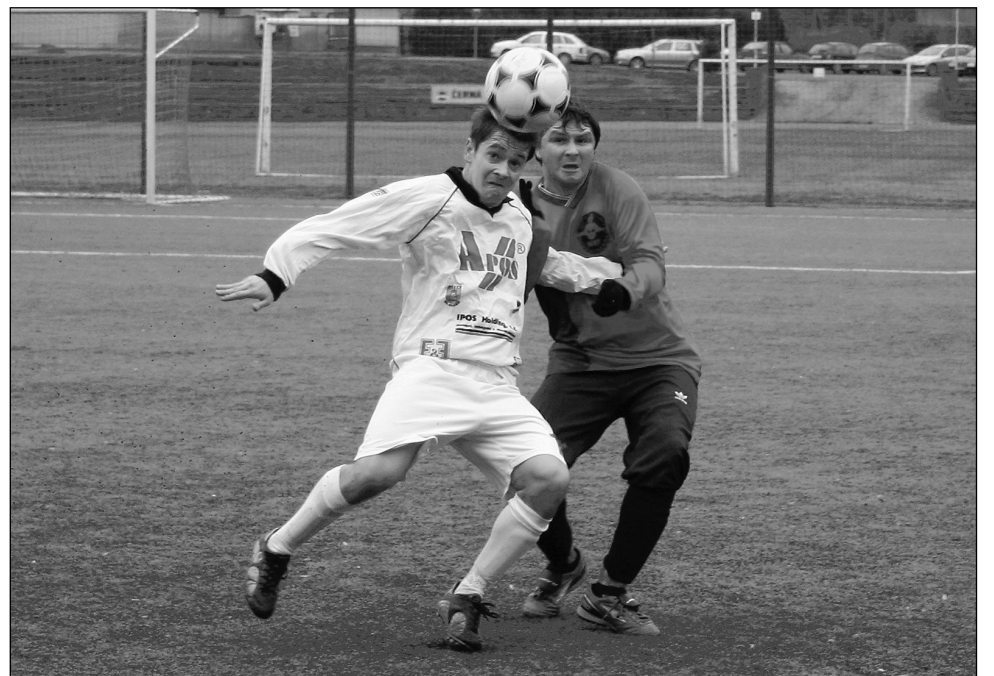
Úvodní zápas. Artézia Cup v Boskovicích odstartoval souboj Blanska a Kunštátu.

Se dvěma černými Kamerunci v sestavě trenér Záleský vyzkoušel experimentoval. V prvním, velice vyrovnaném poločase, si jedinou velkou šanci vypracoval tým Rájce, ale