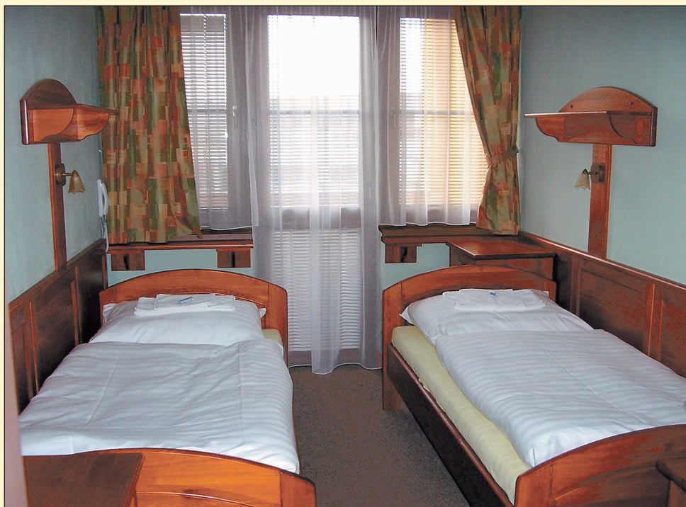
Hotel Závřší nabízí ucelený sortiment služeb pro místní i návštěvníky Olešnice a okolí.