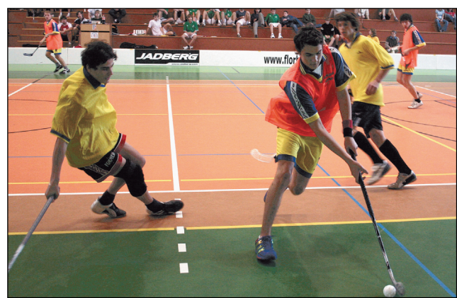
Poražení obhájci. Hráčům z domácí SPŠ Jedovnice (v oranžovém) se loňské prvenství nepodařilo obhájit.

Výsledky chlapeckého turnaje: Skupina A: 1. Gymnázium Blansko, 2. SOŠ a SOU André Citroena Boskovice, 3. SOŠ a SOU Lomnice. Skupina B: 1. SOŠ a SOU MŠP Letovice, 2. Gymnázium Boskovice, 3. BiGy Letovice. Skupina C: 1. OA a SZdŠ Blansko, 2. SPŠ Jedovnice, 3. Gymnázium Rájec-Jestřebí, 4. SOŠ a SOU Blansko. Finálová skupina: 1. OA a SZdŠ Blansko, 2. SOŠ a SOU MŠP Letovice, 3. Gymnázium Blansko. (bh)