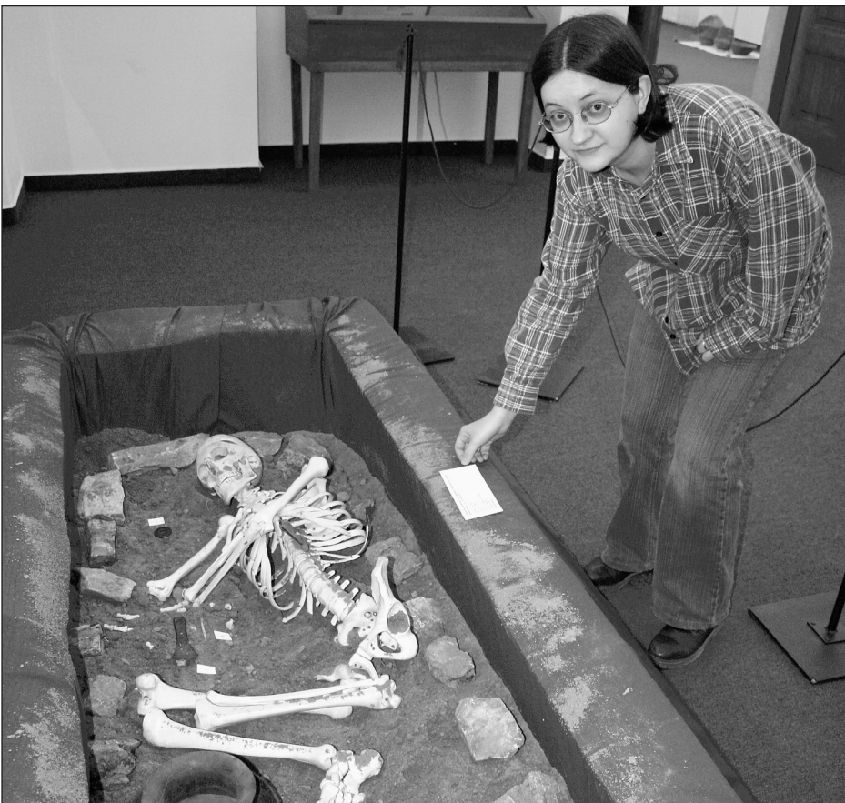
Hrob. Návštěvníci boskovického muzea si mohou po příští tři měsíce prohlédnout novou expozici, Doba bronzová na Boskovicku. Součástí jsou předměty nalezené v tamním regionu, ale také rekonstruovaný dobový hrob, tak jak se ho podařilo archeologům odkrýt.