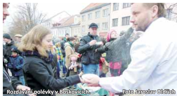
Rozdávání polévky v Boskovicích.

Stejná akce se letos konala již popáté v Letovicích. Lidé si pochutnali na hrstkové polévce. Na pomoc potřebným se pak v Letovicích podařilo vybrat více než šestadvacet tisíc korun. (hrr)