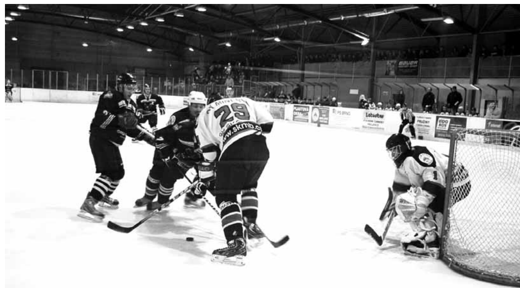
Boskovice - Uničov 5:2.

Sobotní zápas se vyvíjel tak trochu podle papírových předpokladů. Již v 7. minutě hosté otevřeli skóre Křemečkem, v závěru třetiny se pak trefil podruhé Sedlář. Další branka přibyla hned na úvod druhé dvacetiminutovky po necelé minutě a půl. Zdálo se být rozhodnuto, obzvláště když v půlce utkání to bylo již 0:4. Dynamiters ale ukázali bojovné srdce a ještě do druhé sirény dvěma zásahy snížili, když se o ně postarali Látal a Skácel. Po devatenácti sekundách třetí části již zaznamenali kontaktní gól Kazdou. Na ten ale Kroměříž odpověděla na 3:5. V závěru se Blanenští vzhopili k nevídanému tlaku. V 57. minutě snížil Antoň a o minutu později dokonce vyrovnali po dorážce Kuběny. Pětiminutové prodlouže-