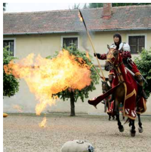
Rytířský turnaj. K nejoblíbenějším akcím na zámku patří tradiční Lysické jeřie.

Co stavební práce na Salla terénu a kolonádě?