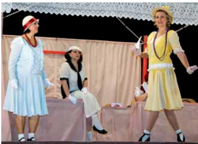
Divadlo. Sextánky v podání Kunštátského ochotnického souboru.

„Ročně navštívím asi třicet ochotnických divadel. Sextánky jsem viděla před dvěma roky na