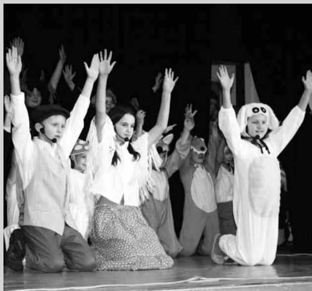
Svátky. Tradiční vánoční besídka uspořádali na Oboře. Zaplněnému sálu se představily se zpěvem, tancem, hrou na hudební nástroje i při divadelním představení děti z Jablůňan, Svitávků, Doubravice a Obory. Foto Pavel Šmerda * Živý betlém byl k vidění na náměstí v Lomnici. Kromě starého biblického příběhu mohli přítomní přispět také na Tříkrálovou sbírku. Foto Pavel Šmerda