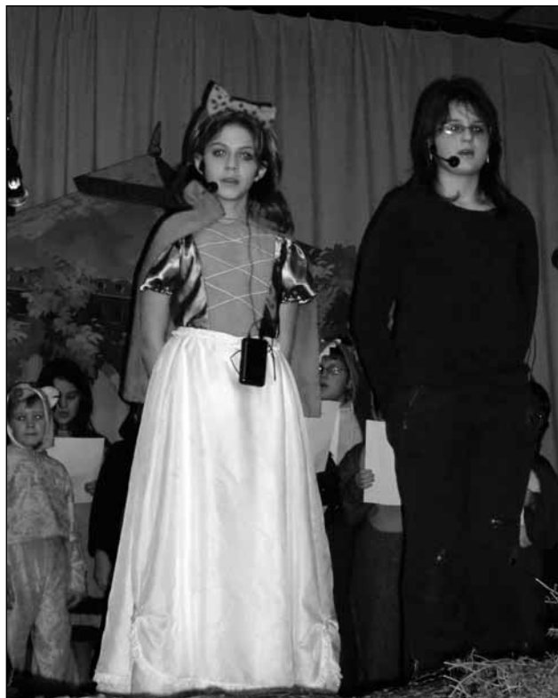
Vánoční besídku uspořádali na Oboře. Ve více než hodinovém programu vystoupily děti z několika obcí Svazku obcí Svitava. * Tradiční živý betlém mohli spatřit první svátek vánoční návštěvníci zámeckého parku v Blansku.