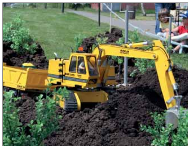
Zmenšené tanky, stavební stroje nebo závodní auta mohli obdivovat příznivci modelů ve Velkých Opatovicích.

Blanenský zastupitelé na svém mimořádném zasedání rozhodli, že novým majitelem výškové