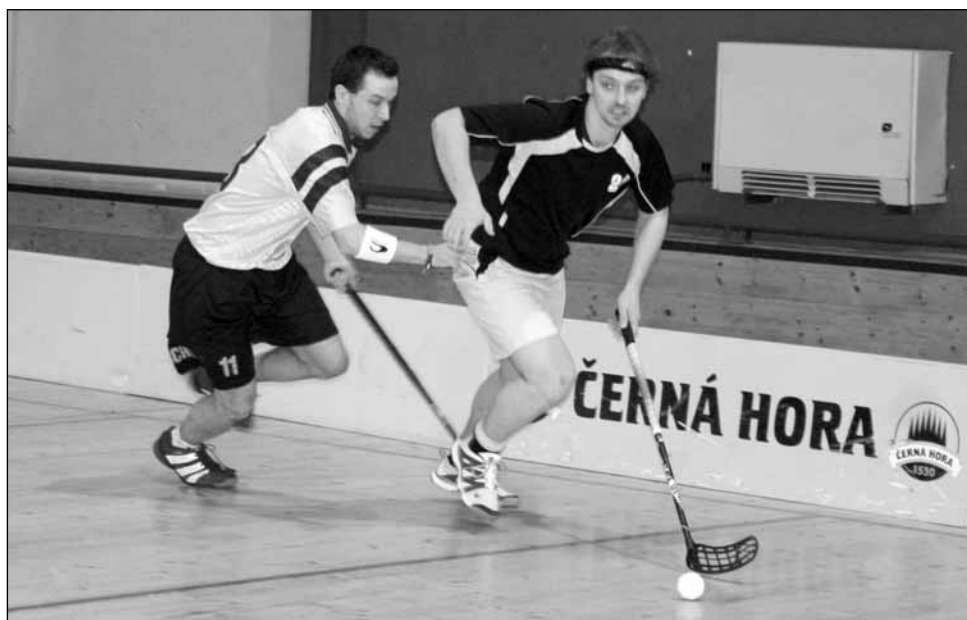
Turnaj. Atraktivním duelem bylo osmifinálové derby, ve kterém se střetla mužstva Atlasu A a Atlasu B. Úspěšnější byli favorizovaní prvotní muži.

První, a jak se později ukázalo jediný, zářel nastal hned první den brzy ráno. Hráči Sokola Jedovnice se bez omluvy nedostavili a tak je k dalším dvěma utkáním ve skupině mimo souztaž nahradili mladíci z týmu