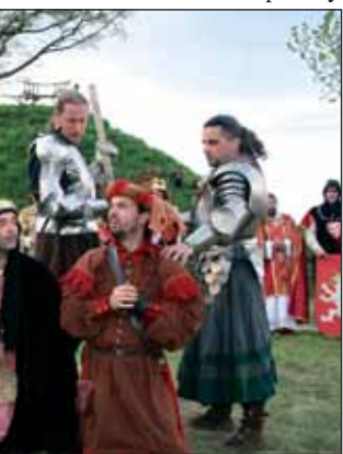
Konaly se oslavy korunovace Jiřího z Kunštátu a Poděbrad českým králem.

vyrazili na tradiční pochod z Velkých Opatovic do Javoříčka.