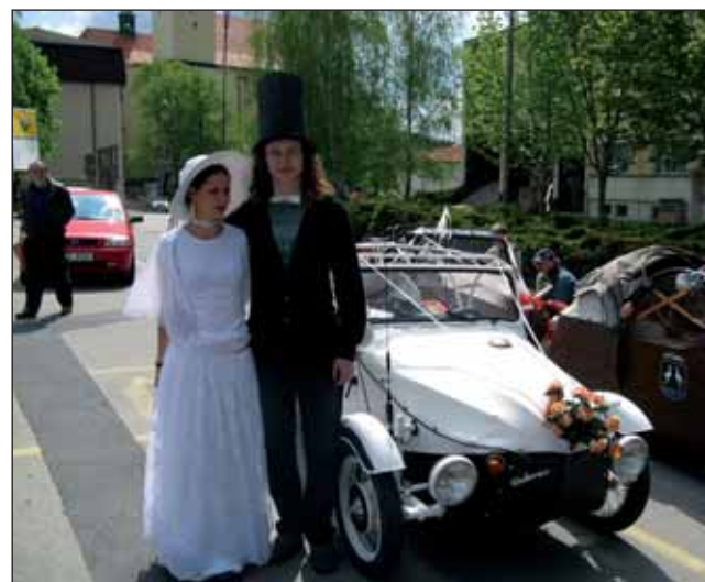
Boskovic se staly dějištěm dalšího ročníku srazu velorexů.

Na boskovickém hradě vystoupila kapela Čechomor, v Blansku se představila mu-