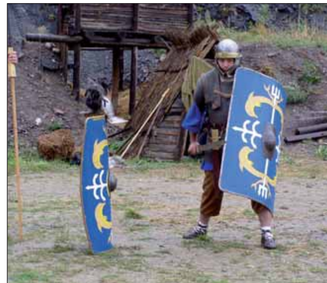
Vrchol loňské sezóny keltské usedlosti Isarno byla bitva Svatobor.