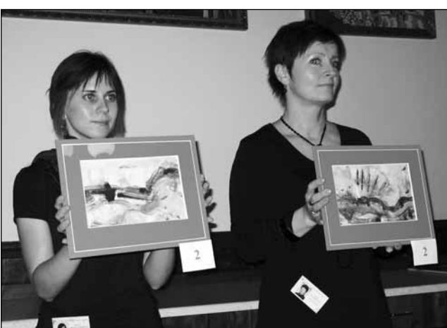
Dražba. O obrazy klientek šebetovského sociálního zařízení byl velký zájem.

Zájemci o obrazy klientek ústavu se také dozvěděli, k čemu vybrané prostředky slouží. V minulosti v Šebetov-