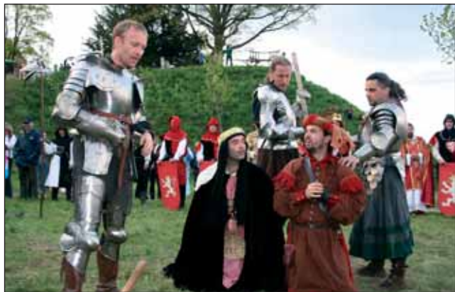
Konaly se oslavy korunovace Jiřího z Kunštátu a Poděbrad českým králem.

Amatérský potápěč našel v přehradě Křetínka u Letovic