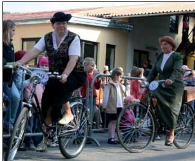
Historická kola se představila na jedné z akcí v Pivovaru Černá Hora.

V Základní škole Slovákova v Boskovicích otevřeli tak zvanou žakovskou galerii. Na chodbách jsou vystaveny práce