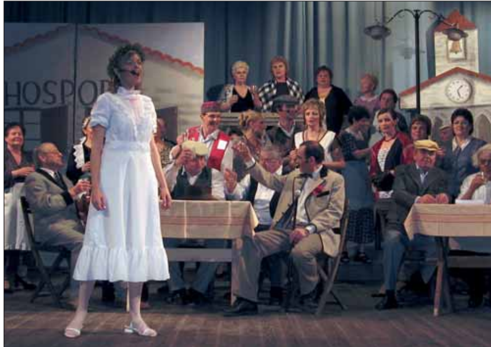
Muzikál Zvonokosy znamenal premiéru pro Ochotnické divadlo Mirka Konečného.

Třiapadesátiletá žena a sedmašedesátiletý muž se otrávil v Blansku na sídlišti Zborovce zplodinami z porouchaného plynového kotle.