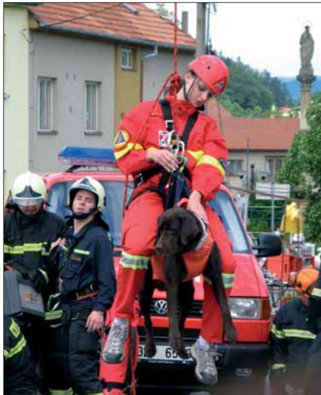
Hasiči v Lysicích oslavili 135. výročí svého sboru.

Cyklistický nezávod Brno – Černá Hora s Jozefem Zimovčákem a Pivní máj se konaly v Černé Hoře. Součástí akce bylo vystoupení Vladimíra Hrona,