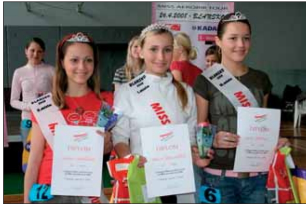
Konalo se regionální kolo Miss Aerobik 2008.

Uskutečnil se tradiční festival folkové muziky Olešnická kytka. Hlavními hosty byly letos skupina AG Flek a Robert Křesťan a Druhá tráva.