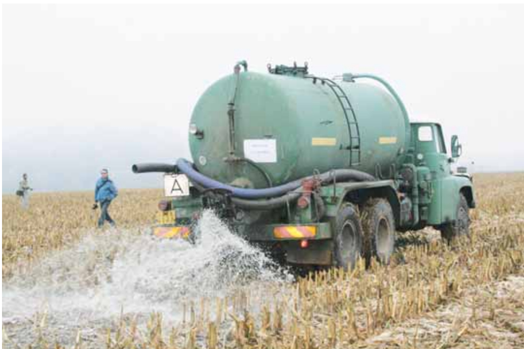
Protest. Na nízké výkupní ceny mléka se v minulosti snažili zemědělci upozornit jeho demonstrativním vypouštěním na pole.

Co se týče dalších komodit, kam patří hlavně maso, tak zde je podle jeho slov situace ještě dale-