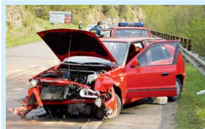
Nehoda. Zraněním skončila havárie, která se stala na Velikonoční pondělí krátce po patnácté hodině v Blansku. Na místě zasahovali i profesionální hasiči, kteří zajišťovali osobní auto převrácené na bok.

Tam se hloubí základy pro opěrnou zeď a navyšuje původní val, který v případě potřeby zachytí stoletou vodu. „Je to poslední část první etapy. Jsme si však vědomi toho, že protipovodňová ochrana města musí být komplexní. Takže na první etapu bude navazovat druhá, která bude zahrnovat zkapacitnění koryta řeky Svitavy, opravy výdřev a zpevnění svahů. Chceme, aby celá hráz, která chrání část Rájce, byla obnovena a zajištěna tak, že při velkých vodách udrží jakýkoliv nápor,“ doplnil starosta. (pš)