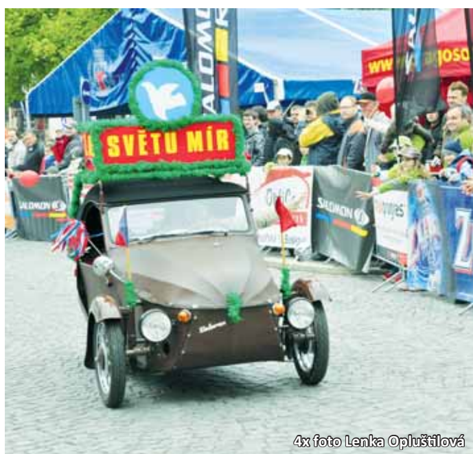
4x foto Lenka Opluštřilová