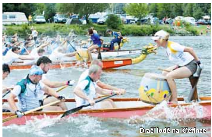
Dračí lodě na Křetínce