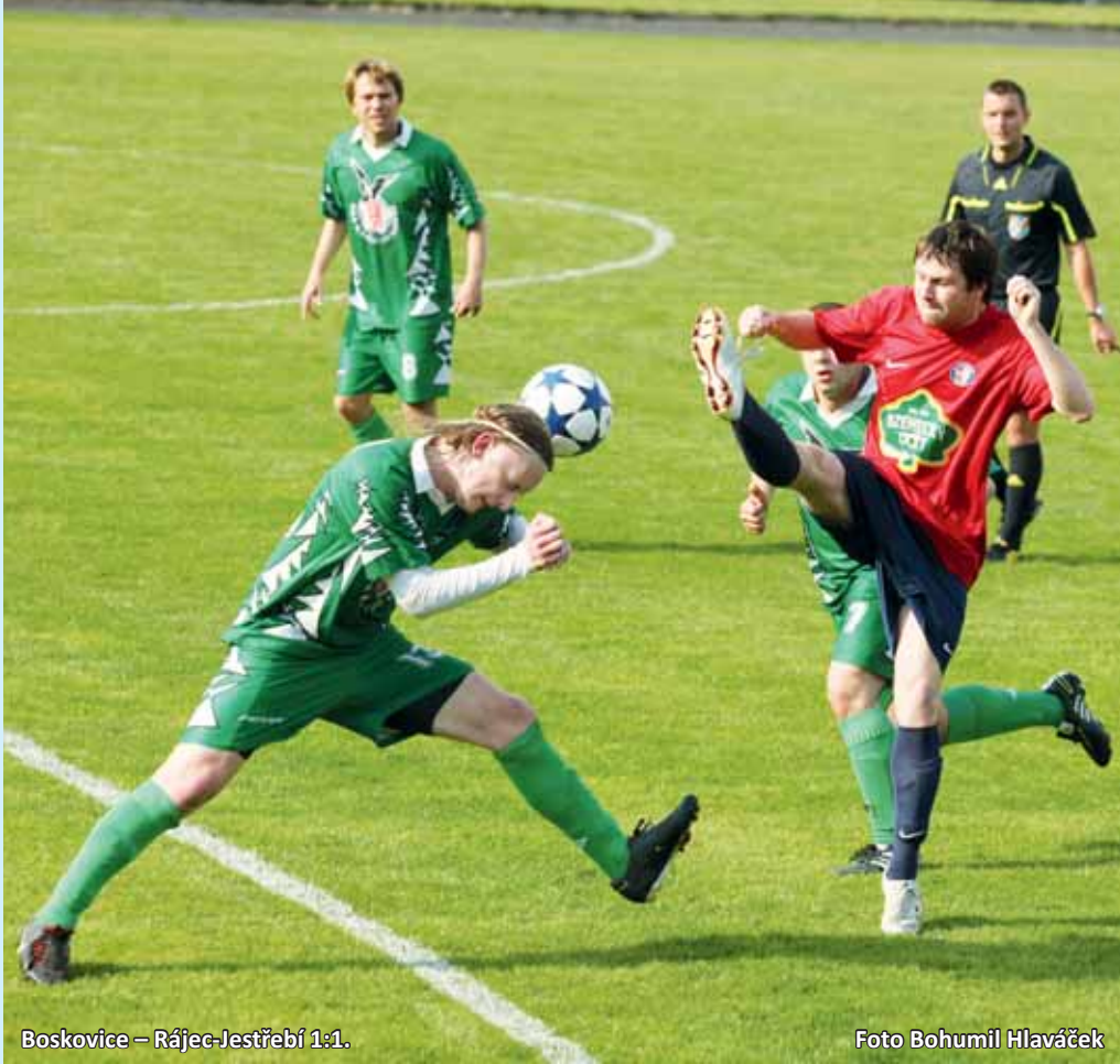
Boskovice – Rájec-Jestřebí 1:1.