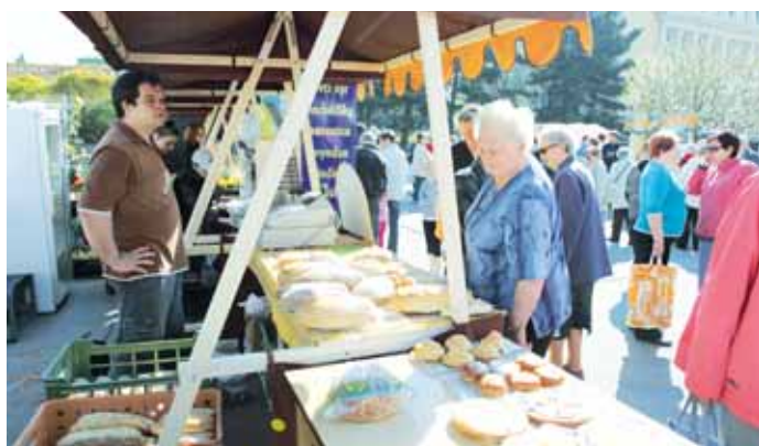
Vydařená akce. Premiéra farmářských trhů v Blansku vyšla organizátorům na jedničku.

„Jsme velmi příjemně potěšeni. Ukazuje se, že něco podobného ve městě asi opravdu chybělo,“ usmí-