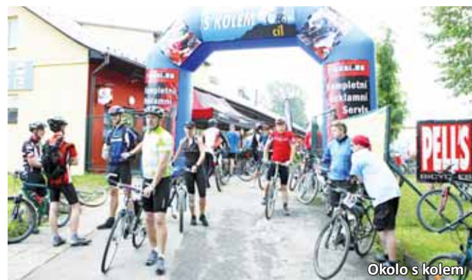
Okolo s kolem