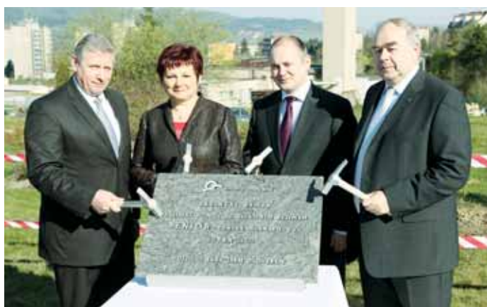
Slavnost. V Blansku byl položen základní kámen přístavby Senior centra.

Na stavební část třípodlažního objektu, situovaného na volné ploše v zahradě a spojeného zastřešeným krčkem se současným objektem Senior centra, vynaloží Jihomoravský kraj 42,2 milionu