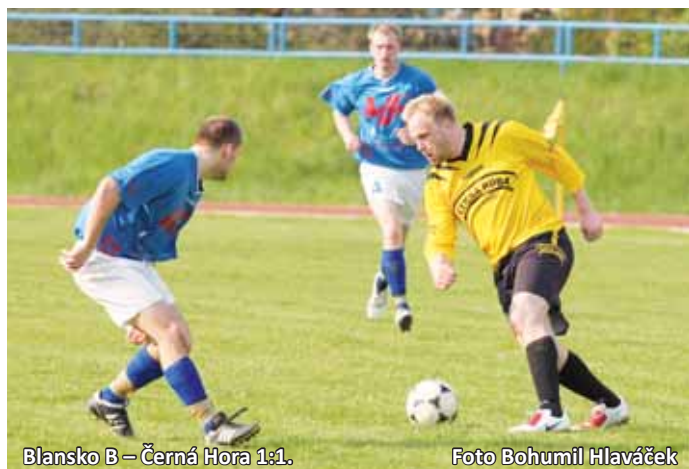
Blansko B – Černá Hora 1:1.