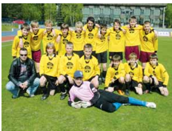
Úspěch. Vynikající úspěch dosáhli chlapi výběru OFS Blansko z ročníku 1998 na turnaji ve Znojmě.