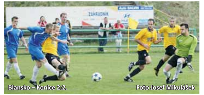
Blansko – Konice 2:2.