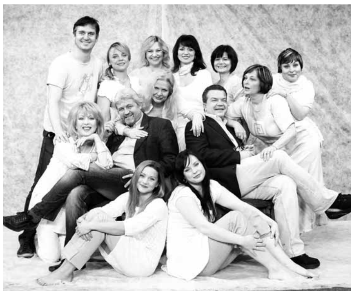
12. dubna v 19.30 hod., Dělnický dům, Blansko Divadlo Háta - Jakeovy ženy

Kromě individuálních klientů, které budeme nabízet zajímavé pobytové balíčky, se chceme zaměřit i na firemní klientelu, protože máme i výborné kongresové zázemí. Konkrétně sál pro 200 osob, který je vybaven nejmodernější audiovizuální technikou. Přijďte vyzkoušet naše nové služby, zveme vás k nám.