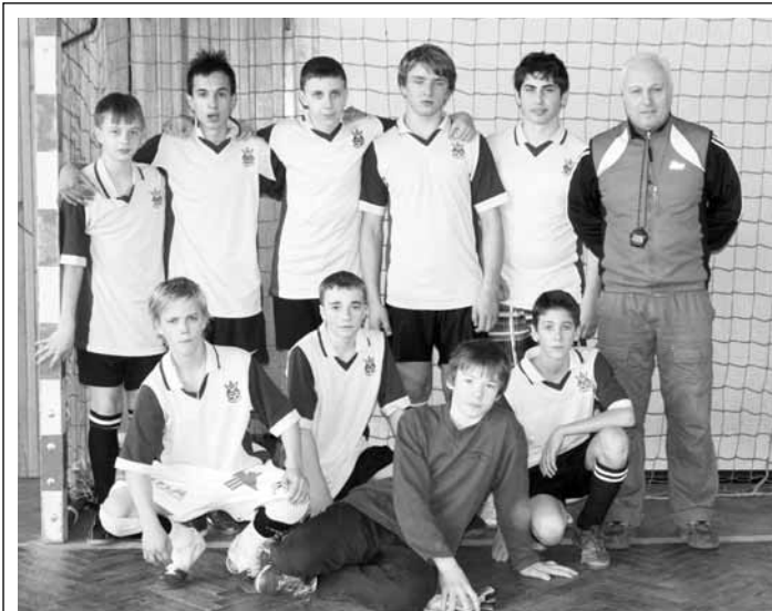
Vítěz. Již po patnácté se konal v Adamově třídení okresní přebor ŽŠ v halové kopané. Stejně jako loni se z titulu radovali domácí.

Blansko - Oddíl turistiky TJ ČKD Blansko ve spolupráci s Klubem českých turistů a TJ Obůrka pořádá 26. března 34. ročník dálkového pochodu Za sněženkou do krasu. Organizátoři připravili celkem čtyři trasy. Nejdelší padesátikilometrová vede z Blanska na Těchov, Nové Dvory, Macochu, Ostrov u Macochy, Holštejn, Vysočany, Šošůvku, Sloup přes Vavřinec, Veselici a Obůrku zpět do Blanska. Trasa 35 km je s výjimkou Vysočan stejná jako výše uvedená. Přípravenci jsou i délky 25 a 10 km. Registrace účastníků je v Blansku na kuželně od 6.30 do 8.30 hod. u delších tratí, u desetikilometrové od 8 do 9 hod. Na trasách je připraveno občerstvení a možnost opékání buřtů z vlastních zdrojů. (bh)