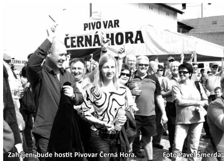
Zahájení bude hostit Pivovar Černá Hora.