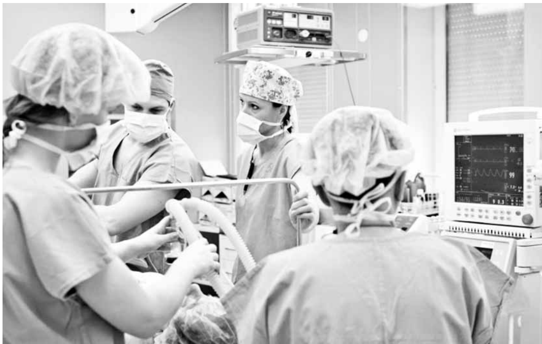
Na sále. V boskovické nemocnici provedou ročně zhruba dva tisíce operací.

Můžeme nabídnout široký rozsah operativy v břišní chirurgii, včetně laparoskopické. Také traumatologie tedy úrazová chirurgie i ve spolupráci s ortopedickým oddělením je u nás na velmi dobré úrovni. Jsme na tomto poli v podstatě soběstační s výjimkou operací páteře, pánve a poranění mozku a proto udržujeme i nadá-