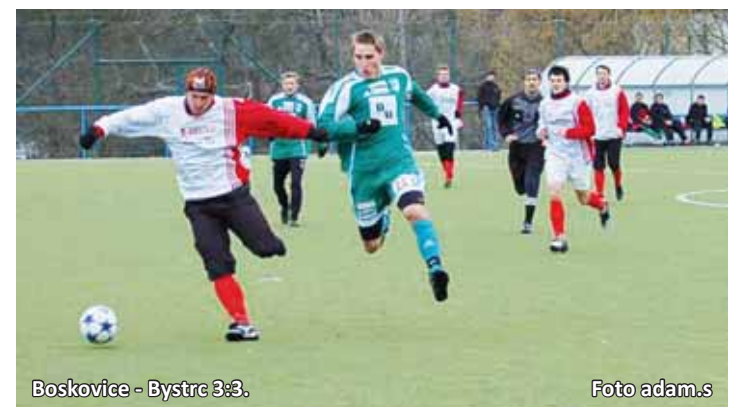
Boskovice - Bystrc 3:3.