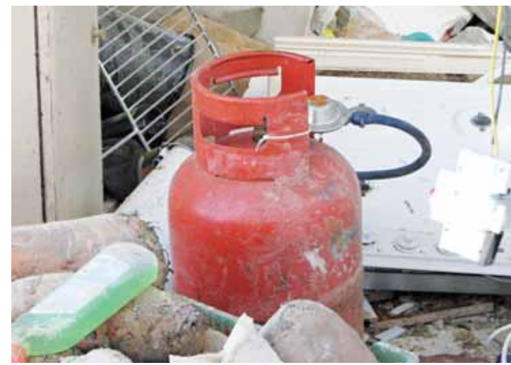
Příčina. Tlaková láhev, ze které unikal plyn.

Záchranáři přebírali zraněného muže při vědomí, ale následně ho uvedli do umělého spánku. „Utrpěl