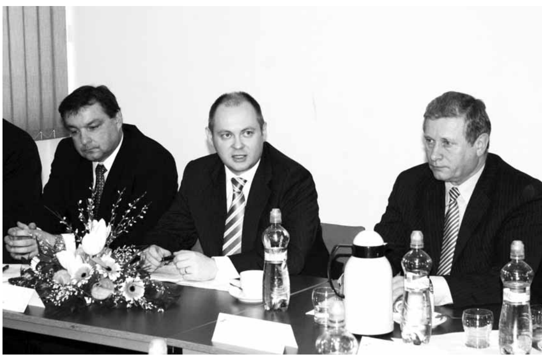
Jednání. Hejtman Jihomoravského kraje Michal Hašek (uprostřed) se starostou Boskovic Jaroslavem Dohnálkem (vlevo) a Blanska Lubomírem Toufarem.

Druhým důležitým bodem jednání byla dopravní situace. „Se starosty jsme se vzájemně informovali o názorech na superkoncept Ministerstva dopravy. Vedení kraje preferuje výstavbu komunikace R43 po etapách. Jednoznačně požadujeme, aby se na Blanensku začalo s výstavbou co nejdříve,“ shodli se hejtman i starostové. Rada kraje v této souvislosti vyzvala všechny zákonodárce zvolené na jižní Moravě, aby razantněji toto rozhodnutí podporovali. „Jde nám zejména kromě podpory přípravy a budování zmíněné silnice R43 včetně rozčlenění její stavby také o silnice R52 a R55 a železniční uzel Brno. To jsou klíčové dopravní stavby, které ovlivní atraktivitu regionu,“ zdůraznil Hašek.