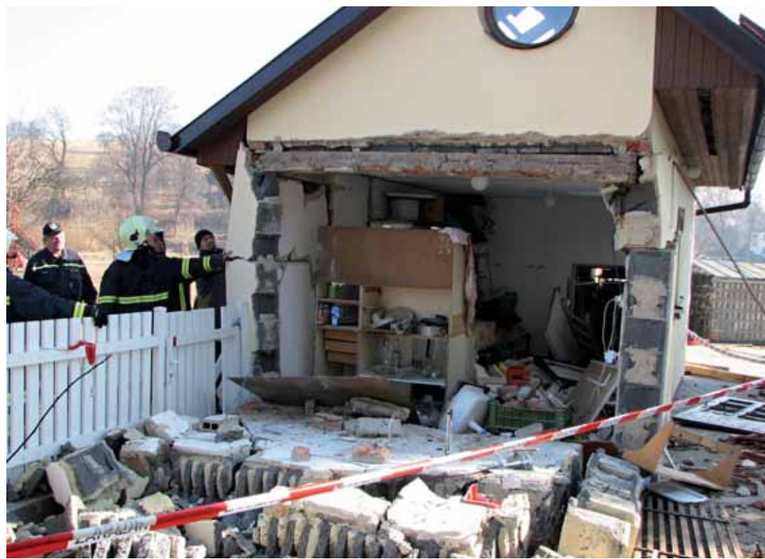
Na místě. K výbuchu došlo v úterý 1. března krátce před devátou hodinou ranní. Část domu tlaková vlna zničila, zbytek musel být po rozhodnutí statika zbourán.

těžké popáleniny prvního a druhého stupně na téměř třiceti procentech těla. Zasažena byla hlava, krk, horní a dolní končetiny. Pro zajištění rychlého a šetrného transportu byl z Brna povolán vrtulník Letecké záchrané služby, který muže za stálé intenzivní péče přepravil na popáleninové centrum Fakultní