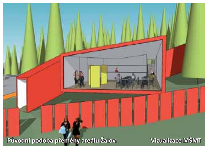
Původní podoba přeměny areálu Žalov.

„Chceme, aby toto vzdělávací zařízení sloužilo nejen k připome-