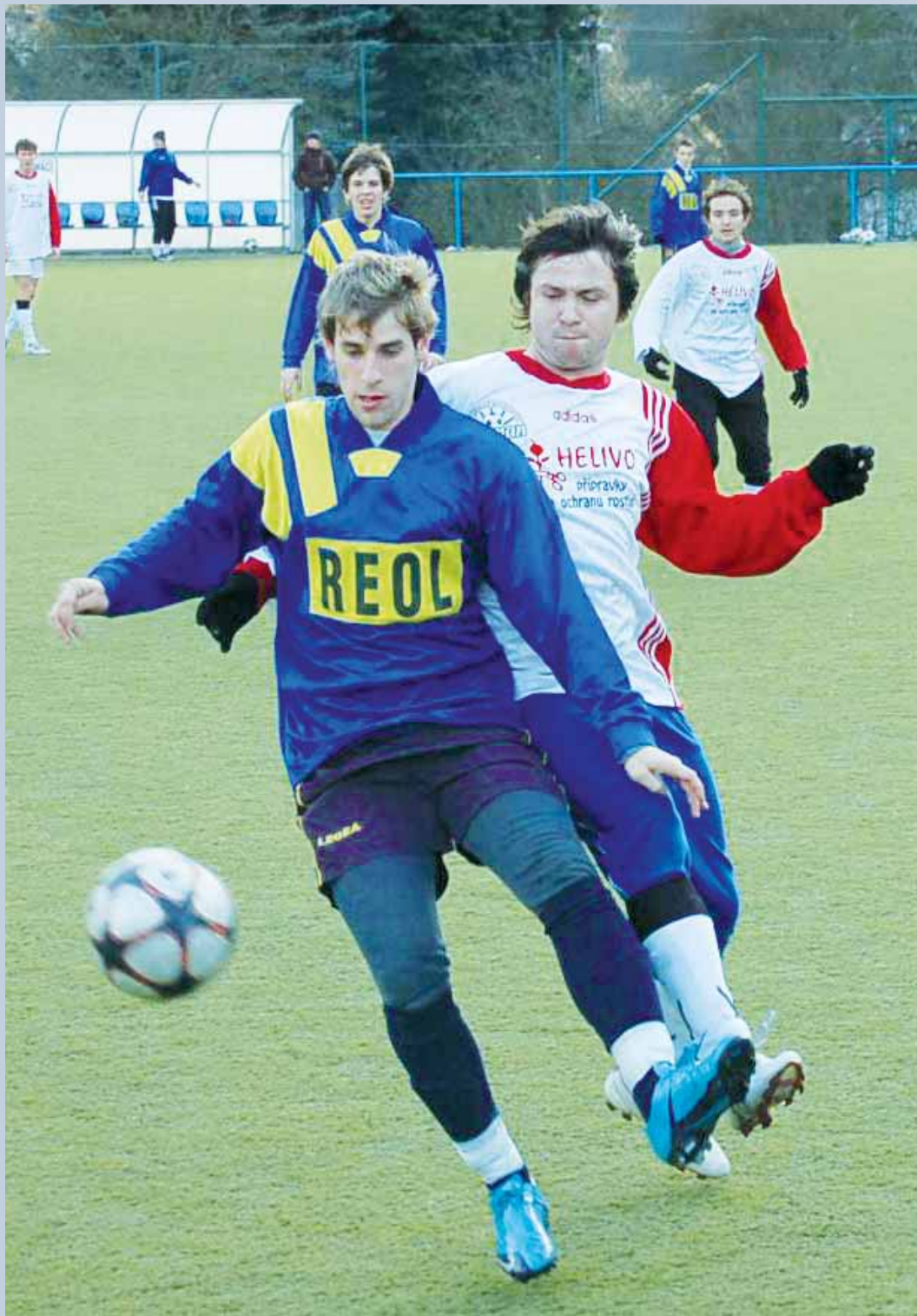
Umělá tráva. Pod boskovickým hradem se každý víkend odehrávají lité boje zimních boskovických turnajů. Výsledky na str. 12. (bh)