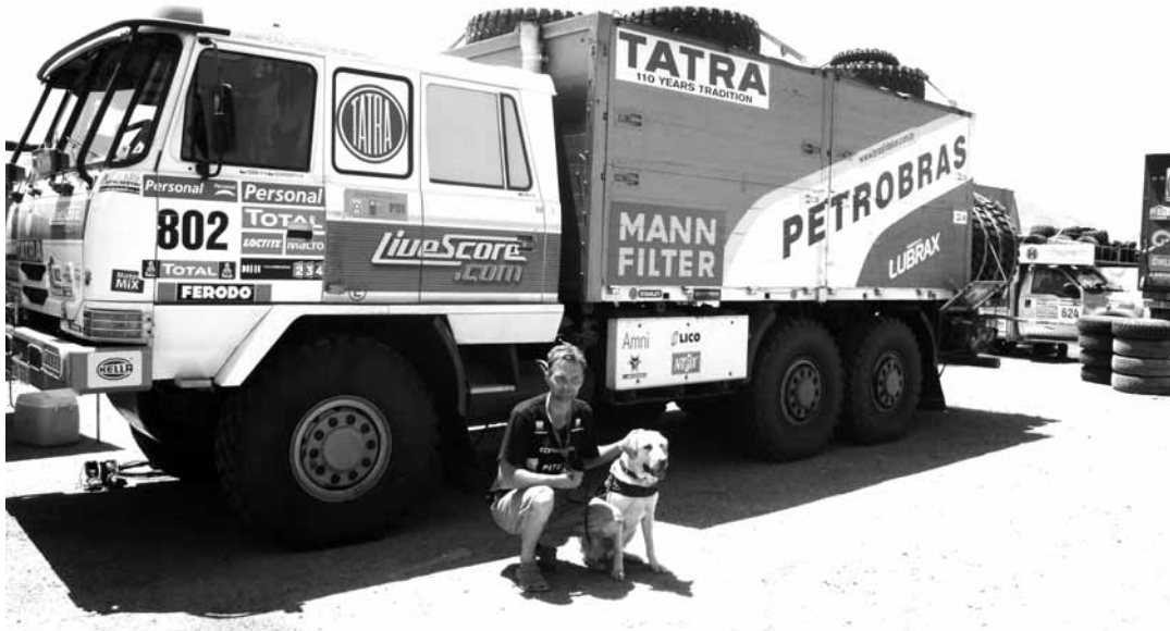
V bivaku. Šéfmechanik Petr Vodák z Boskovic s chillským policejním psem.

aby se zase Tatrovky vrátily mezi nejlepší, ale hlavně aby alespoň dojevy do cíle?