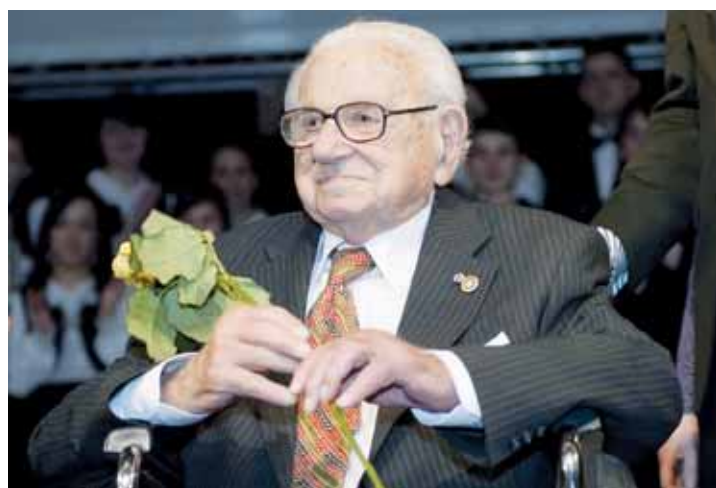
Osobnost. Nicholas Winton při premiéře.

Ten zážitek v nich možná zůstane celý život. Vybraní žáci ze Základní školy v Kunštátě se zúčastnili v Praze premiéry filmu Nickyho rodina, který je volným pokračováním slavného dokumentu Nicholas Winton – Síla lidskosti o záchraně 669 českých a slovenských dětí před transportem do koncentračních táborů za 2. světové války. A právě Nicholas Winton, který letos oslaví už sto druhé narozeniny, byl na slavnostní akci v