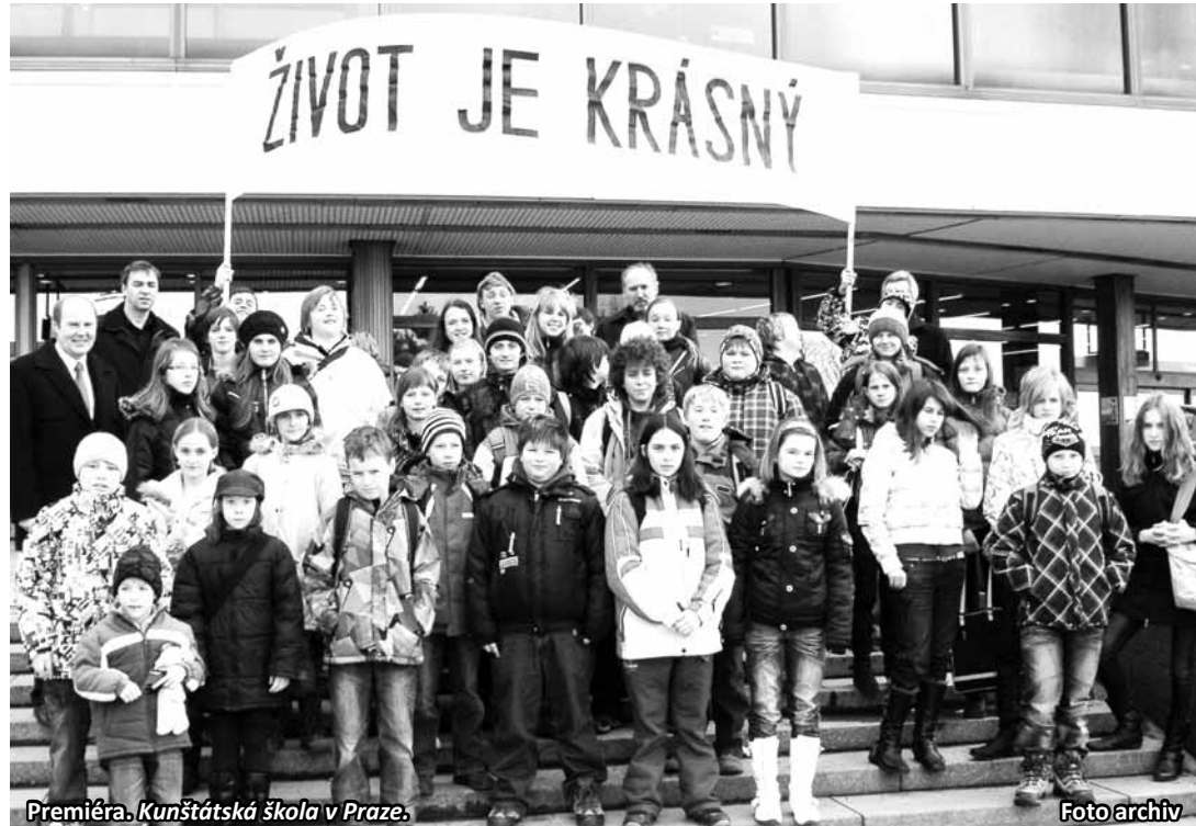
Premiéra. Kunštátská škola v Praze.