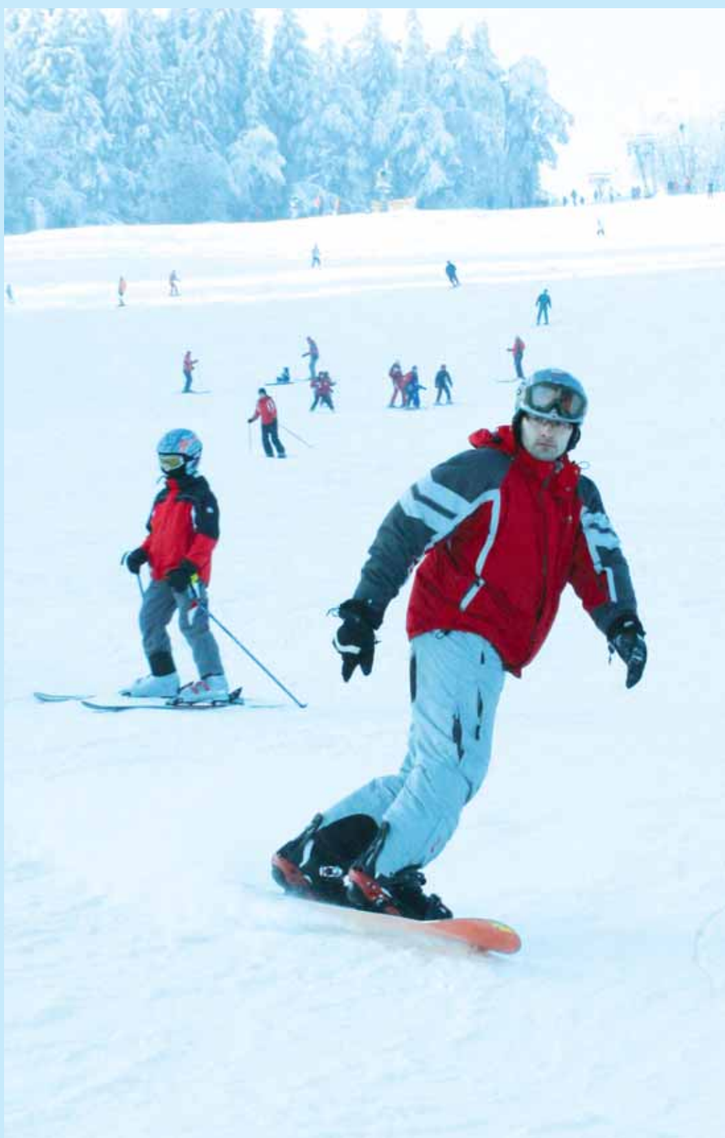
Zábava. Lyžařský areál v Olešnici přilákal uplynulý týden stovky milovníků zimních radovánek. Hlavně děti pak využily páteční pololetní prázdniny.