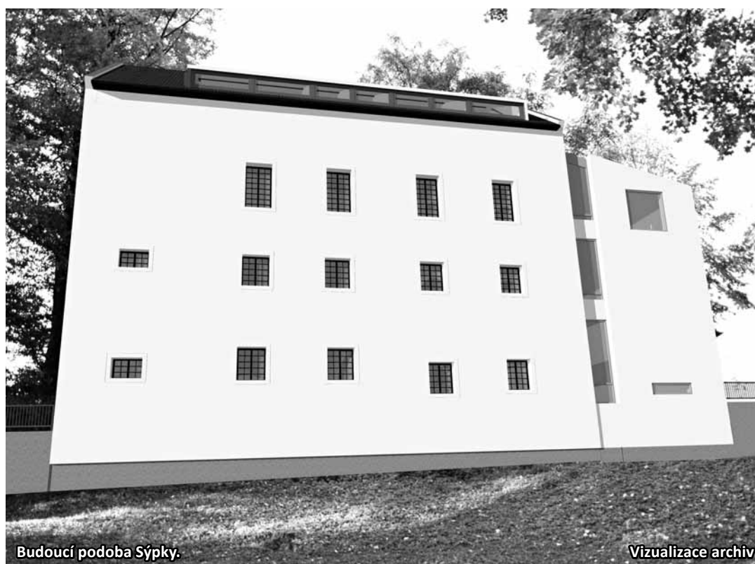
Budoucí podoba Sýpky.

Určitě. Chybí k němu ubytovací kapacity, proto jsem se pro ni rozhodl. Nemít bowling, nepouštěl bych se do toho, to je jasné. Má to logiku.