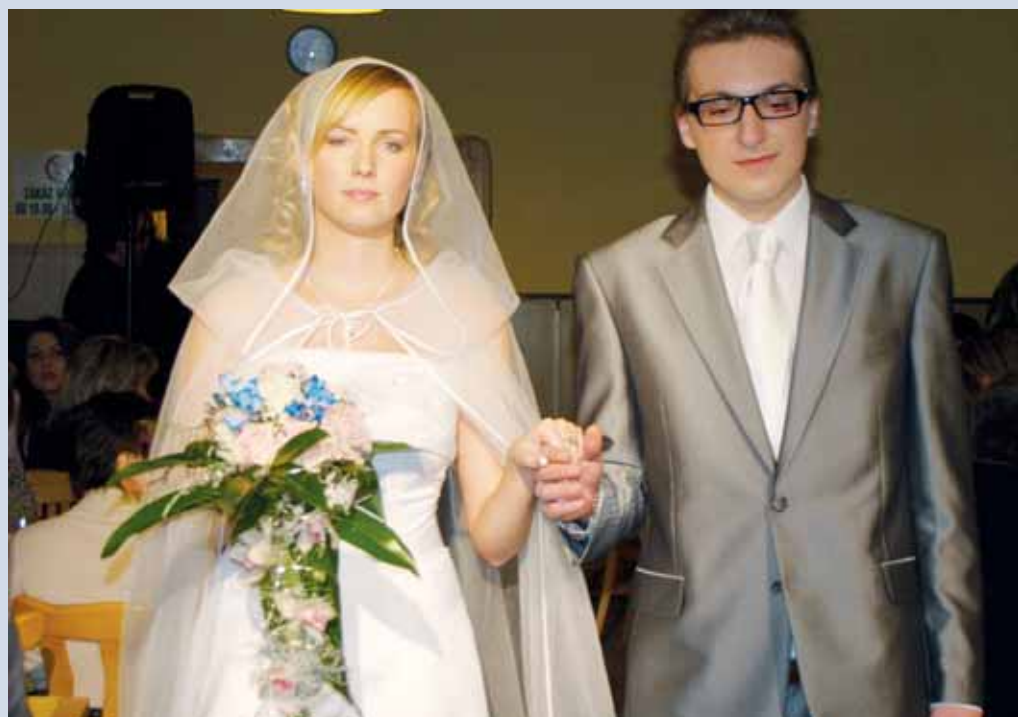
Společnost. V Restauraci Punkva v Blansku se v sobotu konala akce s názvem Podzimní setkání s módou. Návštěvníci měli možnost obdivovat svatební a společenské šaty, pánskou módu, sportovní oblečení, pleťnou módu, kožichy i spodní prádlo. Akce, která měla loni premiéru v Boskovicích, se těšila velkému zájmu veřejnosti, jen by si do budoucna zasloužila atraktivnější prostředí.