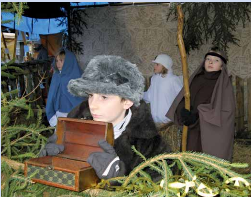
Jarmark. Boskovické Masarykovo náměstí hostilo uplynulý pátek Vánoční jarmark tradičních řemesel a výrobků. Kromě řady stánků si mohli lidé vychutnat i bohatý kulturní program. Ten odstartovalo vystoupení dětí z místních mateřských škol a příjezd Pána z Boskovic s průvodem. K vidění byl i živý betlém v podání kostelního sborečku Jakubáček (viz foto).