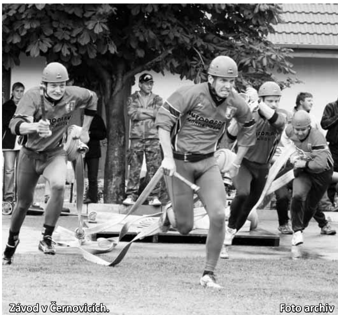
Závod v Černovicích.

Aby nebylo náhodám dost, tak obdobná situace nastala také v kategorii žen. O pomyslné řezání zlatých medailí na polovic se postaraly závodnice ze Sychotína a ze Žďáru se shodným časem 17,88 s.