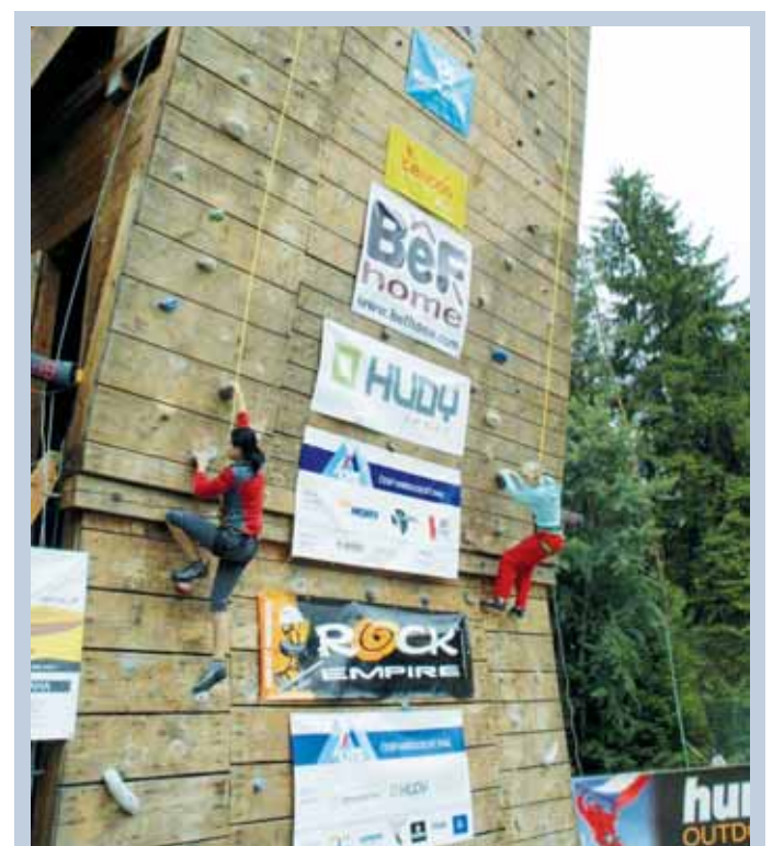
Závody. Již tradičně v polovině prázdnin se v Baldovci sešli lezci, aby opět po roce změřili své síly při závodech na rychlost – BaldCup 2011. Letos tyto závody byly obohaceny o mistrovství České republiky v lezení na rychlost dospělých. Závodilo se na 20 m dlouhých cestách, které stavěl Ondřej Nevěšník.