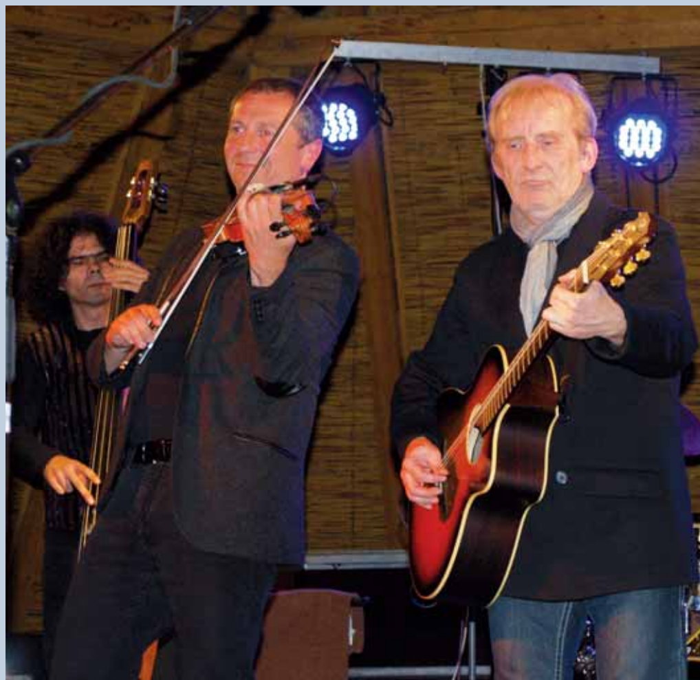
Vystoupení. Jedním z vrcholů Býkovicického kulturního léta byl nedělní koncert kapely Čechomor, která se na tamním hradě představila v rámci svojí letošní tour.