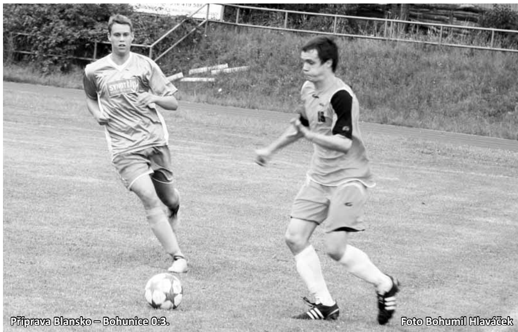
Příprava Blansko – Bohunice 0:3.