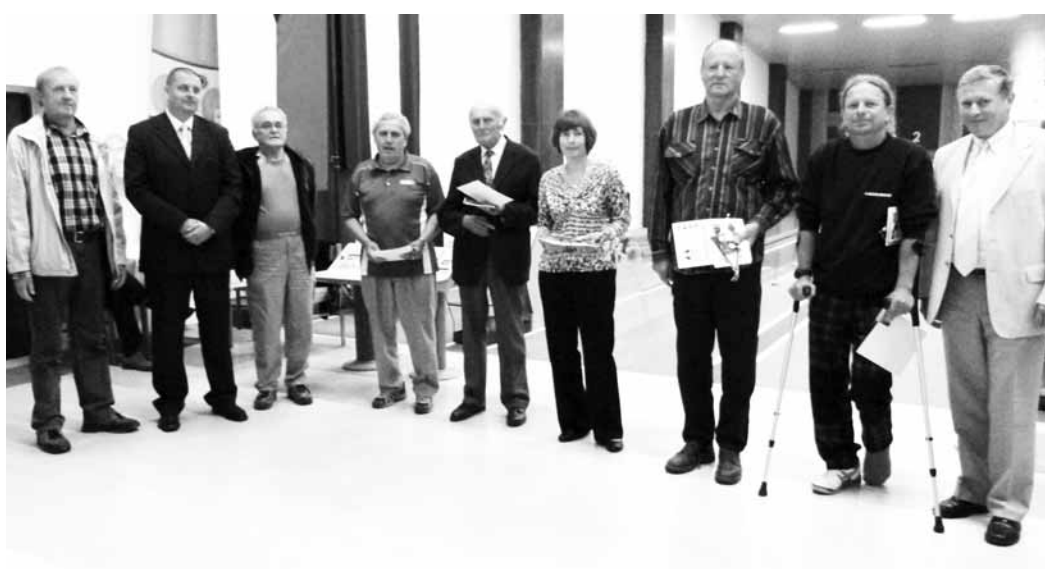
Výročí. Na slavnostní valné hromadě byly oceněny osobnosti historie TJ ČKD Blansko.

V dalších letech se TJ ČKD Blansko stala významnou sportovní organizací ve městě Blansku i v celém okrese. Její činnost vzrostla po vybudování vlastního hřiště v místech zvaných „U kamenného kříže“ v letech 1957 – 1958. Během let se hřiště užívané hlavně fotbalisty, stalo rozsáhlým