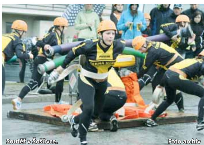
Soutěž v Šošůvce.

Bohužel prázdninový termín připomínal pouze zápis v kalendáři. Počasí si tentokrát pro soutěžící připravilo vytrvalý déšť a teploty