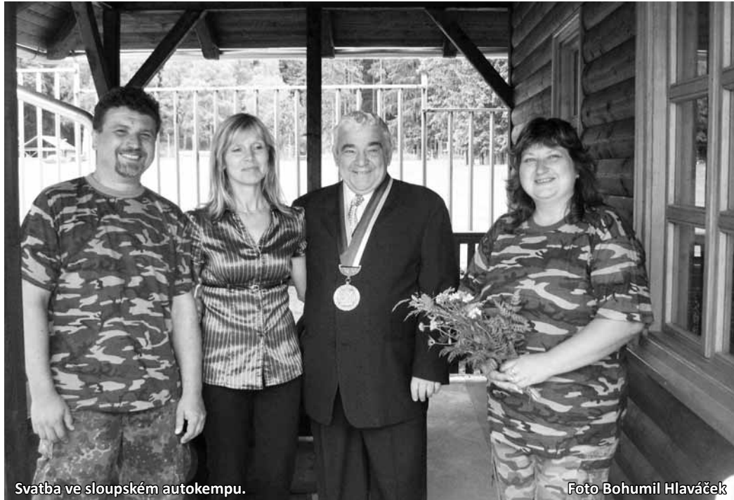
Svatba ve sloupském autokempu.

Cenové relace vstupu na koupaliště se lehce změny směrem nahoru. „Museli jsme zdrazit o deset korun. Za celodenní lístek teď dospělí zaplatí čtyřicet korun, děti třicet. Oproti loňsku ale máme slevy na odpolední či rodinné vstupné. To bude vycházet při dvou dospělých a dvou dětech na jednoho potomka zdarma,“ upřesnil Janeček. Služby u přílehlé restaurace se podle něho také zlepšily. „Pečeme pizzu z