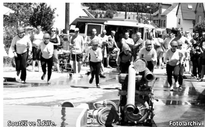
Soutěž ve Žďáře.