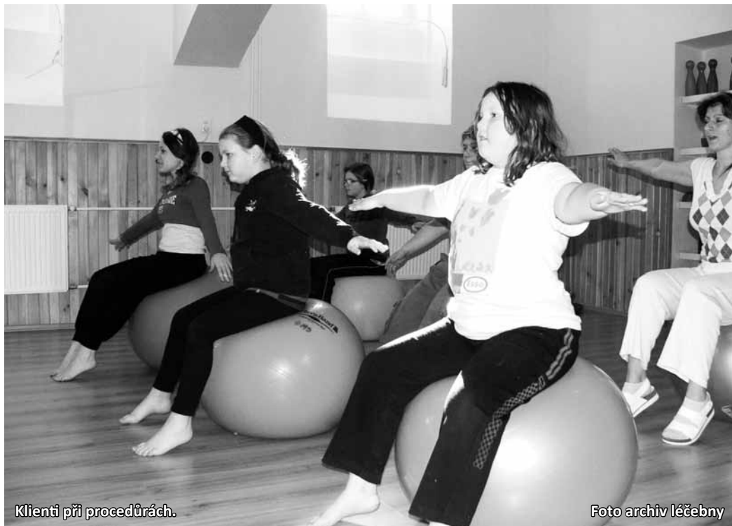
Klienty při procedurách.

Změněn statut jsme se museli přizpůsobit i po stránce vybavení. Máme vřívku, takže můžeme nově nabízet i vodoléčbu, nádoby na střídavé noční koupele, saunu, rozšířili jsme tělocvičnu. Nyní si jeden pracovník dodělává certifikovaný kurz kondičního trenéra. Nabízíme magnetoterapii, inha-